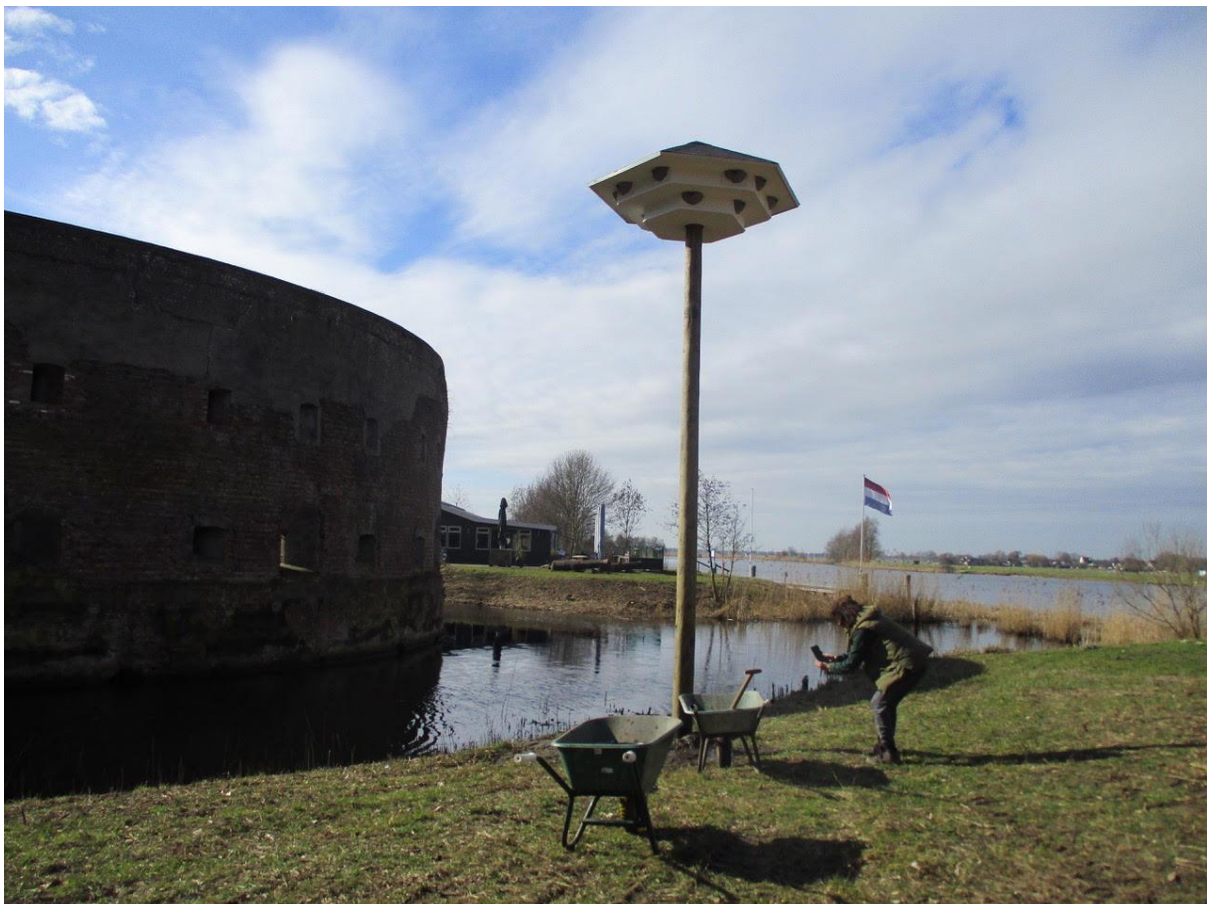
Huiszwaluwtil bij fort Uitermeer (Weesp, Noord-Holland), meteen na plaatsing.

Inmiddels heeft Vogelbescherming Nederland de beschikking over een bestand waarin de bezetting van huiszwaluwtilen in de periode 2009-2021 is gedocumenteerd; er zijn dus zes extra jaren aan de dataset toegevoegd (2022 was ten tijde van deze analyse nog niet beschikbaar). De tillen zijn tussen 2009 en 2015 gemonitord door Wilfried de Jong en Will van Berkel, en daarna door Hans Willemsen, de gehele periode in samenwerking met Vogelbescherming. Het aantal huiszwaluwtilen in Nederland is sinds de eerste geplaatste til in 2008 toegenomen naar 141 tillen in 2015 en 275 tillen in 2021 (en dus naar 292 in 2022). Sinds de vorige analyse in 2015 zijn er dus ruim 130 tillen bijgeplaatst, bijna een verdubbeling. Vogelbescherming heeft aan Sovon gevraagd om een nieuwe evaluatie te maken van de succesfactoren van huiszwaluwtilen, gebruik makend van de data verzameld t/m 2021 (van den Bremer & van Turnhout 2023), waarvan hier een samenvatting.