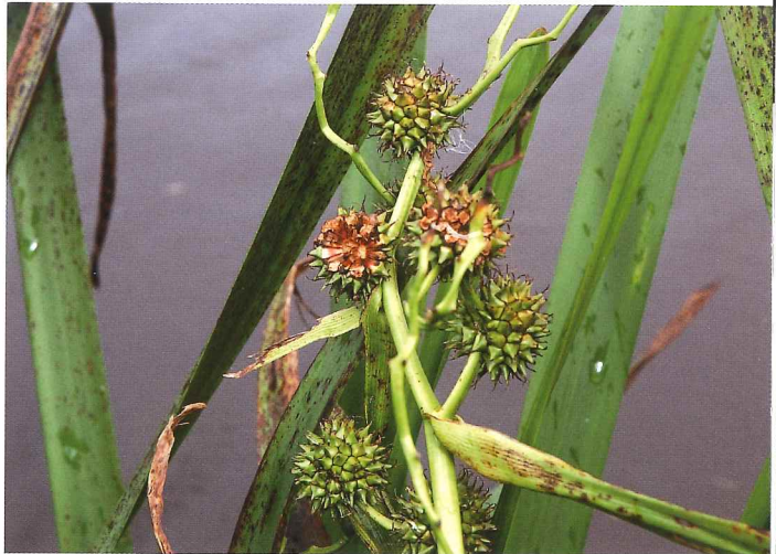
Kleine egelskop – snegels.

Een bijzondere veldnaam is de Snegelstukken die aan de rechterkant liggen. Snegels is de Drentse naam voor waterplanten met lange smalle bladeren, zoals gele lis, zwanebloem, lisdodde, egelskop en riet.