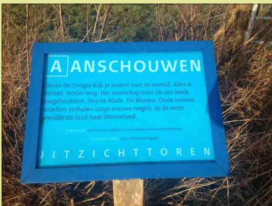
Gedicht bij Het Beeld door Aldrik Pot