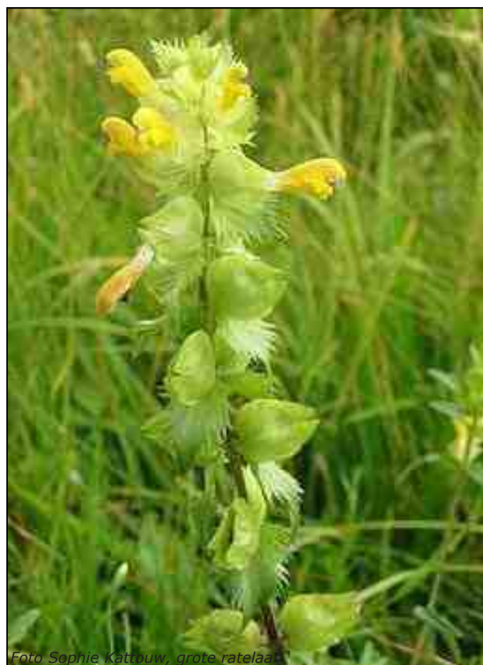
grote ratelaar