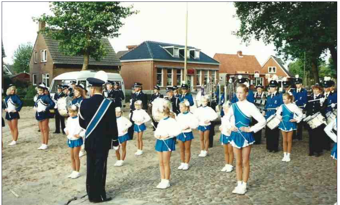
Na afloop van de tocht werden we verrast door Excelsior, juni 1992