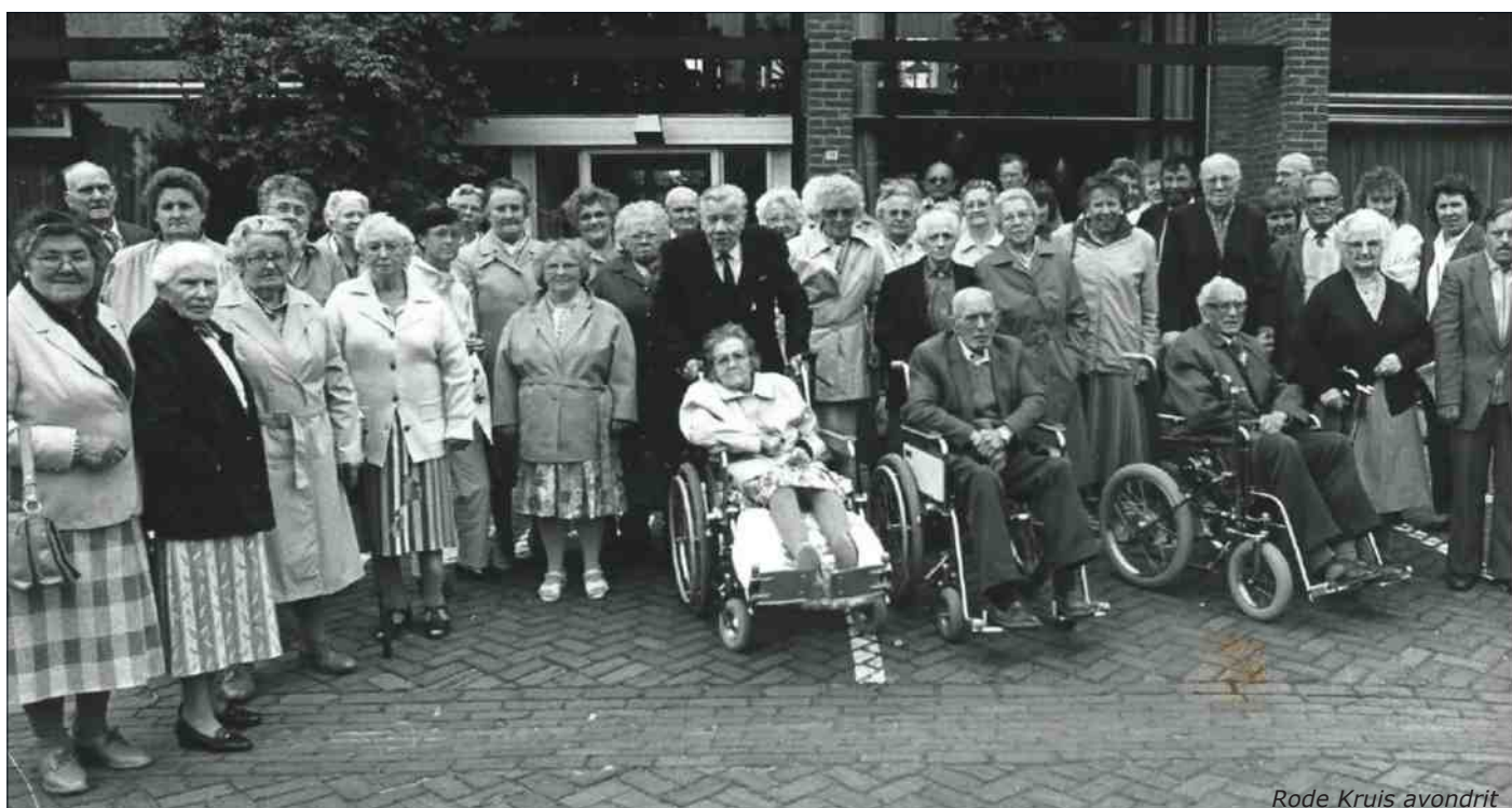
Rode Kruis avondrit