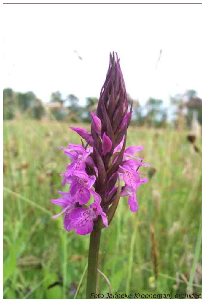
orchidee

plekje. Ga er eens wandelen, kun je meteen de huiszwaluwen bewonderen in de til. De gemeente is op de hoogte en denkt eraan bij het maaien.