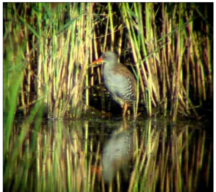
Waterrallen laten zich niet makkelijk zien.

den, waar het lawaai van het verkeer op de Groningerweg nog flink storend kan zijn. Als ik bij Roderwolde de fietsbrug over het Peizerdiep over ga, hoor ik mooi een Sprinkhaanzanger snorren vanuit de ruigte langs het diep. Overdag gaat het hoge en vrij zachte geluid van deze vogel vaak verloren tussen alle andere geluiden van vogels, verkeer en wind. Maar in de nachtelijke stilte is het, ook voor mijn al wat oudere (en dus slechtere) oren, goed waarneembaar. In de verte hoor ik ook een Vos 'blaffen'. Dit geluid houdt het midden tussen hoog keffen en janken. Zo in het duister klinkt het best griezelig voor degene die niet weet dat het een Vos is die deze kreten slaakt. Ik fiets de Roderwolderdijk op naar het noorden en luister ondertussen goed naar alles wat er te horen is. Veel kikkers uiteraard en hier en daar een Rietzanger die, door mij gestoord in z'n nachtrust, kort wat zingt. Ook het "gep-gep-gep" van Waterrallen klinkt op veel plaatsen uit het moeras, maar de soorten waar ik voor kom laten zich niet horen. Met gedoofde lichten fiets ik via de Onlandse Dijk