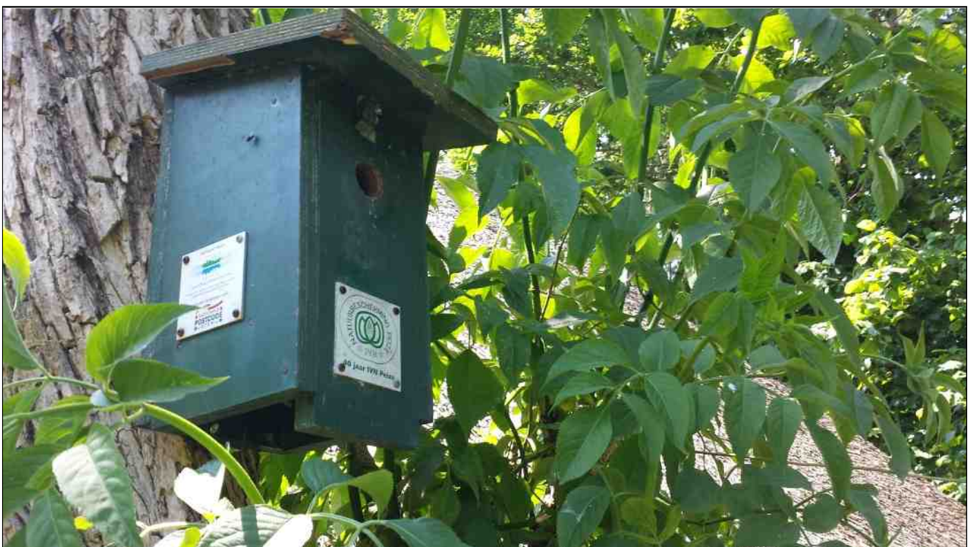
Nestkast, indertijd uitgedeeld door IVN Peize tgv 40 jarig bestaan. Acht jonge koolmezen uitgevlogen