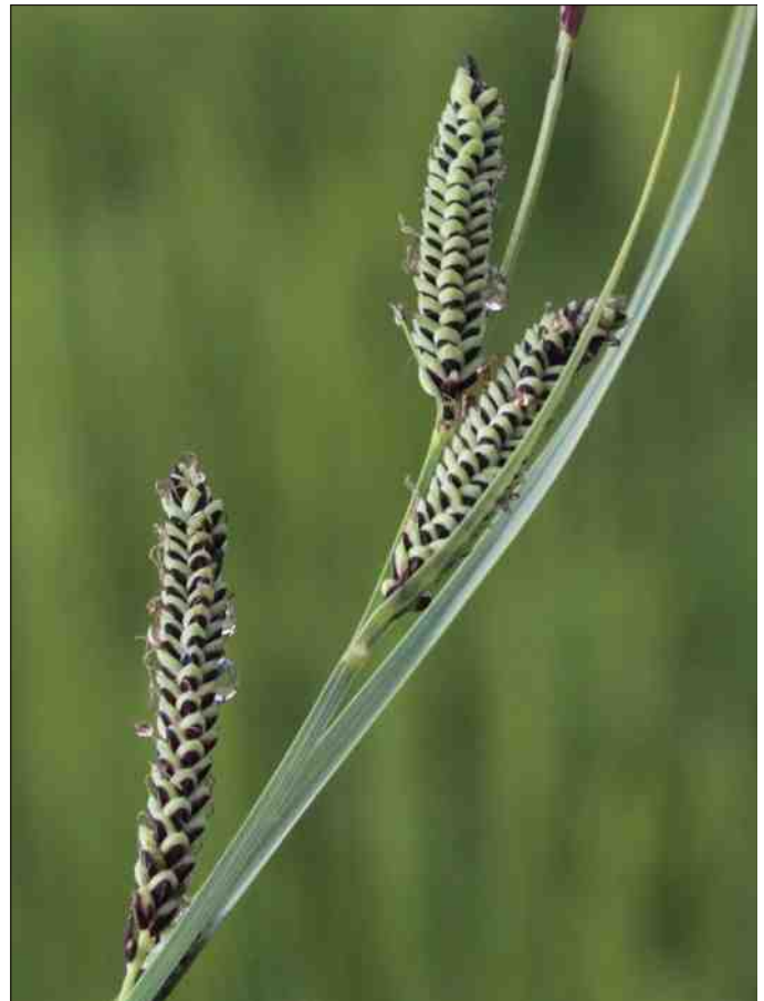
Carex nigra

Verwildert de heemtuin? Zonder onderhoud gebeurt dit zeker. Elk jaar schieten er weer bramen, berken en andere houtige gewassen op in de heemtuin. Om het open karakter van de heemtuin te behouden