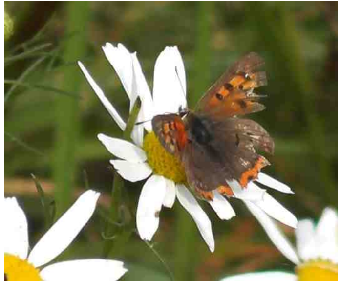
Gehavende Kleine Vuurvlinder

Ook aan vlinders geen gebrek onderweg. Het Koninginnekruid (vroeger heette dat Leverkruid, wat ik een veel toepasselijker naam vind) zit vol met Kleine Vossen, Atalanta's en Dagpauwogen. De witjes houden het liever bij de Kattenstaarten. Hier en daar vliegt ook nog een Kleine Vuurvlinder. Die hebben hun beste tijd al weer gehad zo te zien. Ik zie enkele zwaar gehavende exemplaren. Tja, ook het vlinderseizoen zit er helaas weer bijna op. Maar goed, over een maand of twee komen de winterganzen weer. En dat is ook een goede reden om er op uit te gaan in De Onlanden.