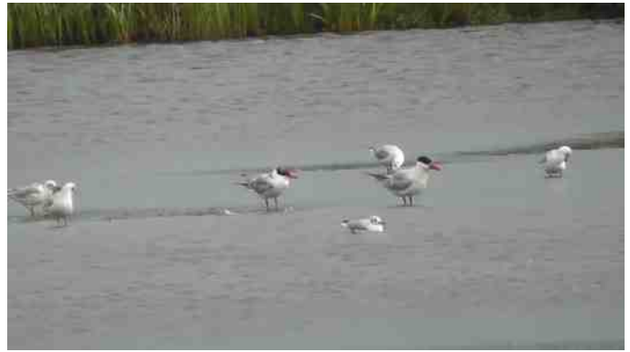
Reuzensterne tussen de kokmeeuwen langs Het Peizerdiep

Tussen de Kokmeeuwen die staan te rusten op de eilandjes langs het Peizerdiep bij de Roderwolderdijk ontdek ik twee sterns. Dit zijn bepaald geen Visdiefjes, want ze zijn flink groter dan de Kokmeeuwen en hebben een knaap van een snavel. Reuzensterne! Imposante vogels vergeleken met Visdiefjes. Deze vogels zijn ongetwijfeld vanuit hun broedgebied langs de Oostzee op weg naar Afrika. Leuk dat ze De Onlanden blijkbaar waarderen als tussenstop. Even verderop zie ik de eerste Slechtvalk al in een hoogspanningsmast zitten. Die is er vroeg bij voor een wintergast. Dit exemplaar is zo te zien een mannetje. Die zijn, zoals bij de meeste roofvogels, een stuk kleiner dan de vrouwtjes. De hoogspanningsmasten worden vaak gebruikt door Slechtvalken om te speuren naar prooien. Het loont dus altijd de moeite om deze horizonvervuilers even te scan-