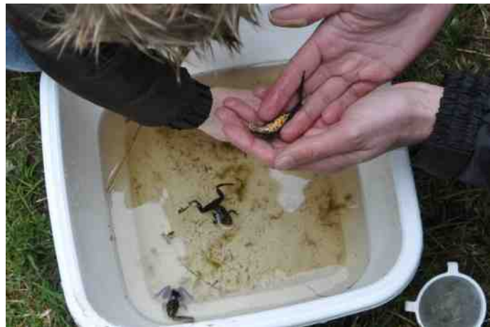
De buik van de kleine watersalamander is oranje

Ik vond het zelf heel leuk om te zien dat zowel de ouders als de kinderen voorovergebogen over een bak zaten waar dan een slakje in zat, of een vlokreeftje, watervlooien, kikkervisjes, bloedzuigers of bootsmannetjes. Na een tijdje werd de eerste salamander gevangen, prachtig van kleur en we konden 'm heel goed bekijken! ( foto onderkant salamander ) Uiteindelijk ving we een stuk of acht salamanders, een geweldige score. Halverwege was er nog een drankje en een koekje, waardoor er ook