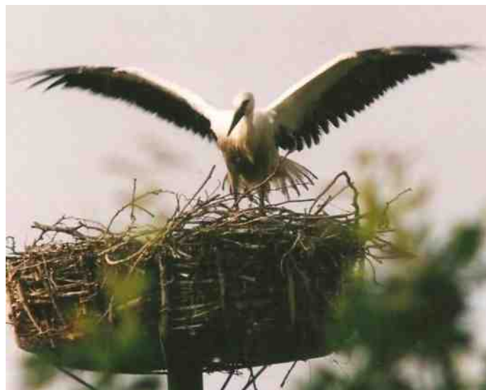
Vliegles.....alle begin is moeilijk!

Namens de ooievaarswerkgroep, Ben Stellink