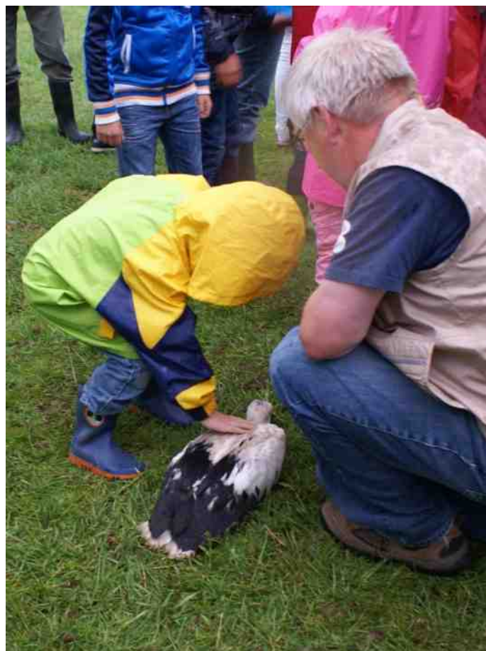
Een jong blijft doodstil liggen. Je kunt ze zelfs aaien!

Vroeger dacht men dat ooievaars geluksbrengers waren.....vandaar dat de ooievaar zelfs tot op de dag van vandaag het symbool is bij geboorte. Ook was het bijgeloof dat een ooievaarsnest op het dak het huis beschermde tegen bliksem en brand. Waarschijnlijk dacht men dat, omdat bij warm weer de ouderdieren grote hoeveelheden water (liters!) meesleepten naar het nest om de jongen extra vocht te geven, om zodoende uitdroging van de jongen te voorkomen.