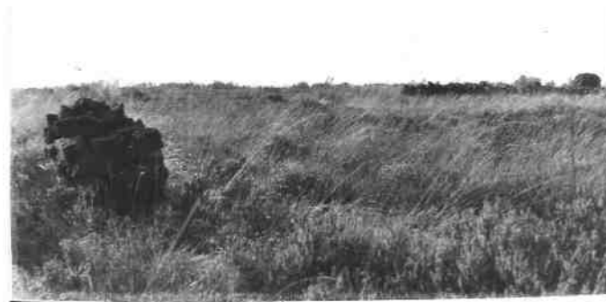
Bunnerveen vroeger, met hier en daar wat turf

aanwakkeren. En in een ommezien stond de heide weer in brand. Voor ons kinderen was het een feest. Brandweer wagens en militairen zag je aan het werk. Duizenden liters water werden over het smeulende vuur gestort en de huizen moesten ook nat gehouden worden. Voor ons kinderen kon de lol niet op. We kregen tranende ogen van de rook, het roet en de stank. Overigens hadden de volwassenen daar ook last van, maar ze kwamen toch in grote aantallen naar de brand kijken. De tranen in de ogen kwamen ook door echte tranen van verbijstering en verdriet, omdat zoveel moois ineens werd weggevaagd. En nu is het veen op een paar kleine stukjes na helemaal verdwenen door de ruilverkaveling. De wegen die er liggen hadden fietspaden moeten zijn in een met rust gelaten mooi veengebied. Maar gedane zaken nemen geen keer en we zullen ons erbij neer moeten leggen. Wanneer ik op de fiets in de buurt kom, moet ik er toch altijd weer aan denken hoe mooi het daar was. Tot een volgende keer volk.