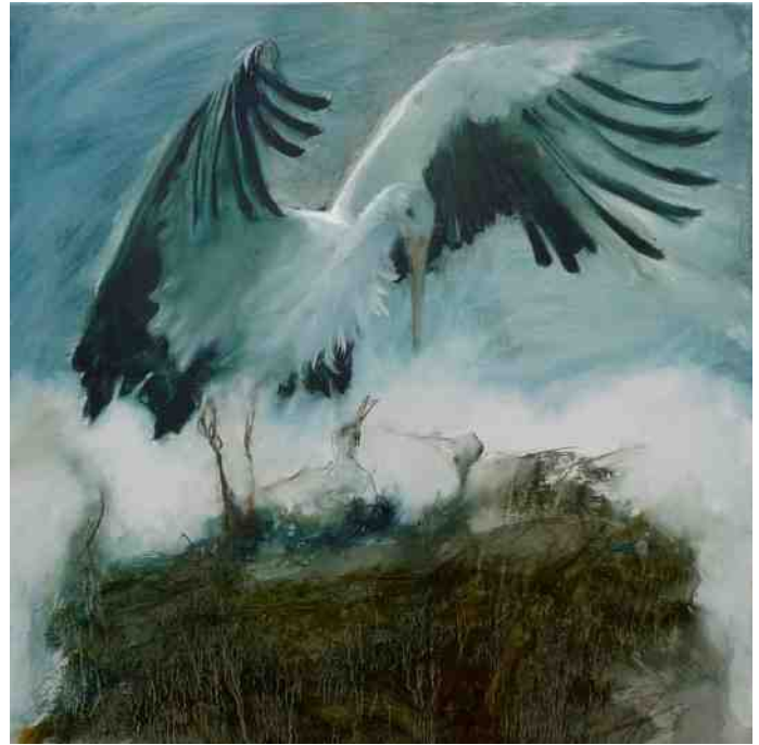
Ooievaar. Walter Leon Kuivenhoven

De Groninger Kroon is te vinden aan de Reiderwolderpolder 2 te Finsterwolde. Een goede uitvalsbasis voor een wandeling door de polders naar de kwelders, waar je kunt genieten van het weidse polderlandschap van het Oldambt. Langs uitgestrekte akkers loop je over dijken via de kwelder naar zee. Hier kun je sporen zien in het landschap die ontstaan zijn door de eeuwenlange strijd tegen het water.