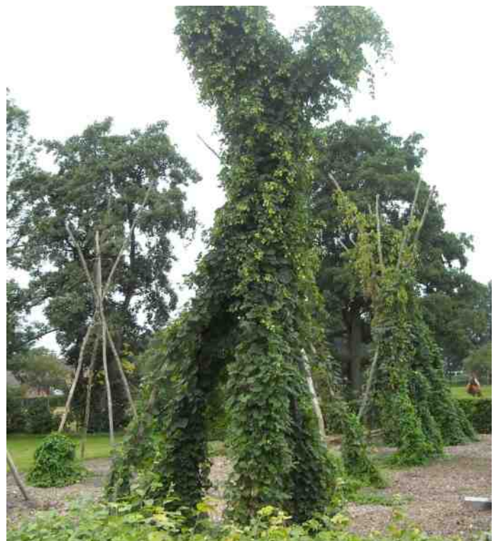
De hoptuin.

Namens de werkgroep Hopteelt, Ben Stellink.