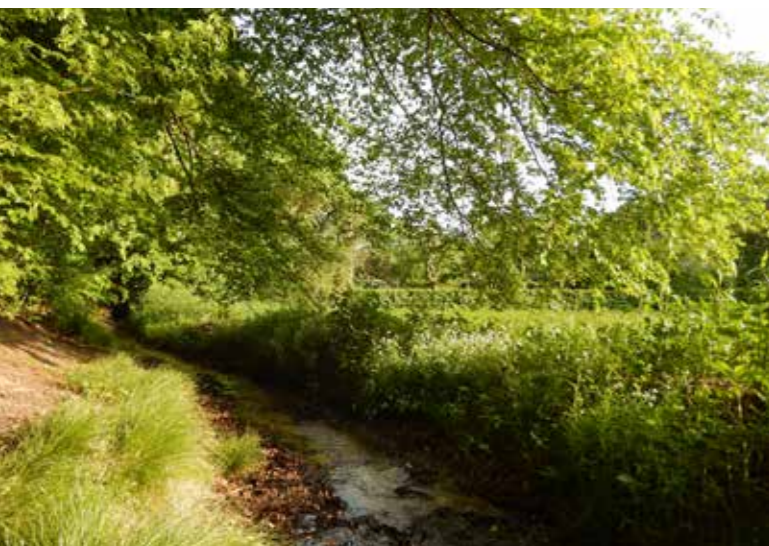
Rozendaalse Beek.