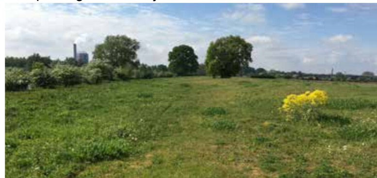
Rivierduin met wede en droogtegradiënt

We lopen nu richting de IJssel. Je ziet dat het landschap hier glooit. Dat zijn de rivierduinen.