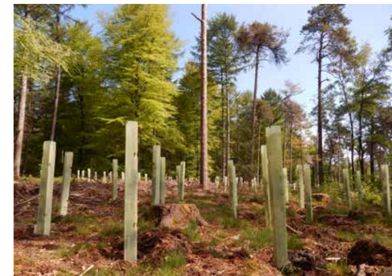
Jonge aanplant bij Emmapiramide

Velhorst vervolgt: "We willen vooral meer boomsoorten in het bos, dat geeft in een later stadium meer mogelijkheden voor strooiselverbetering, biodiversiteit en risicospreiding van ziekten en plagen."