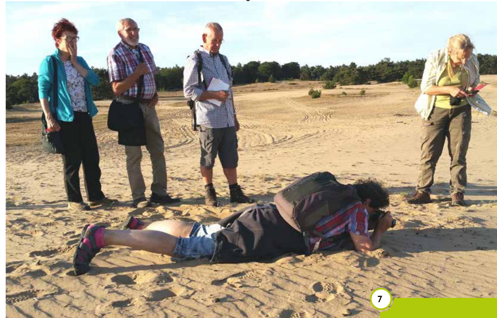
Corlène maakt een foto van zandkevers.