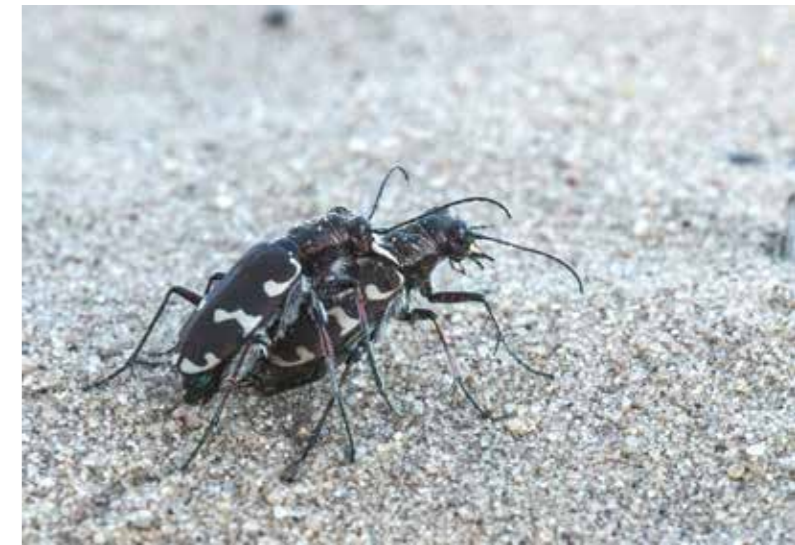
Parende zandkevers ("Ik ben gek op kriebeldiertjes")