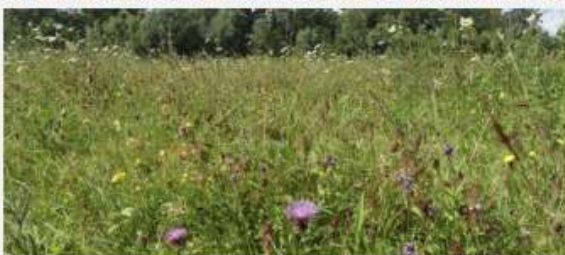
4 - FIJN MOZAIËKPATROON VAN VERSCHILLENDE GRASSEN EN KRUIDEN. HET GEHEEL MAAKT EEN ZEER KLEURIGE, BONTE INDRUK.