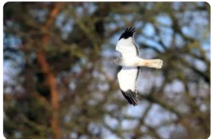
Blauwe kiekendief, Fotograaf Jan Stronks

Nogal opvallend is het kleurverschil tussen mannetje en vrouwtje Blauwe Kiekendief. Het mannetje is, zoals gezegd blauwgrijs, licht van kleur; het vrouwtje is bruin van kleur.