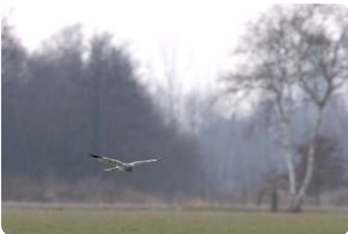
Blauwe kiekendief, Fotograaf Jan Stronks.

In de heden ten dagen saaie, monotone, intensief bewerkte weilanden kun je dan toch een leuke waarneming hebben.