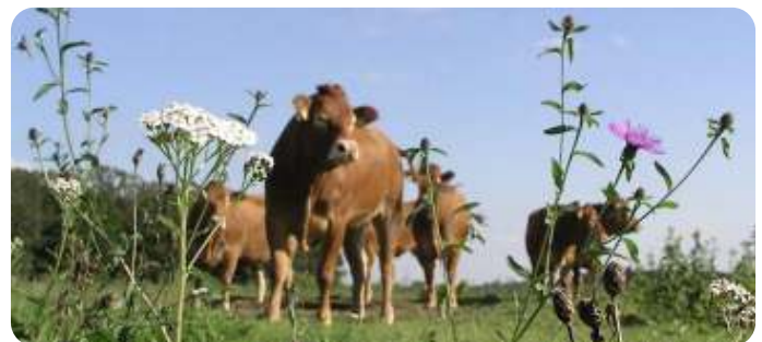
3 - FIJN MOZAIËKPATROON VAN VERSCHILLENDE GRASSEN. OOK DE TALRIJK AANWEZIGE KRUIDEN ZIJN HOMOGEEN VERDEELD OVER HET PERCEEL