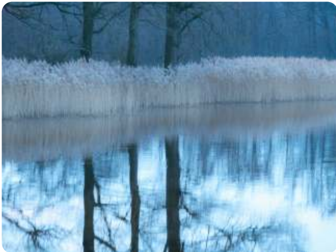
Ria Groot Zevert - Plasje bij Wooldse Veen waar we dodaards hoorden