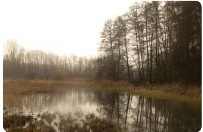
Lisette-Platjouw - Hagenbeek