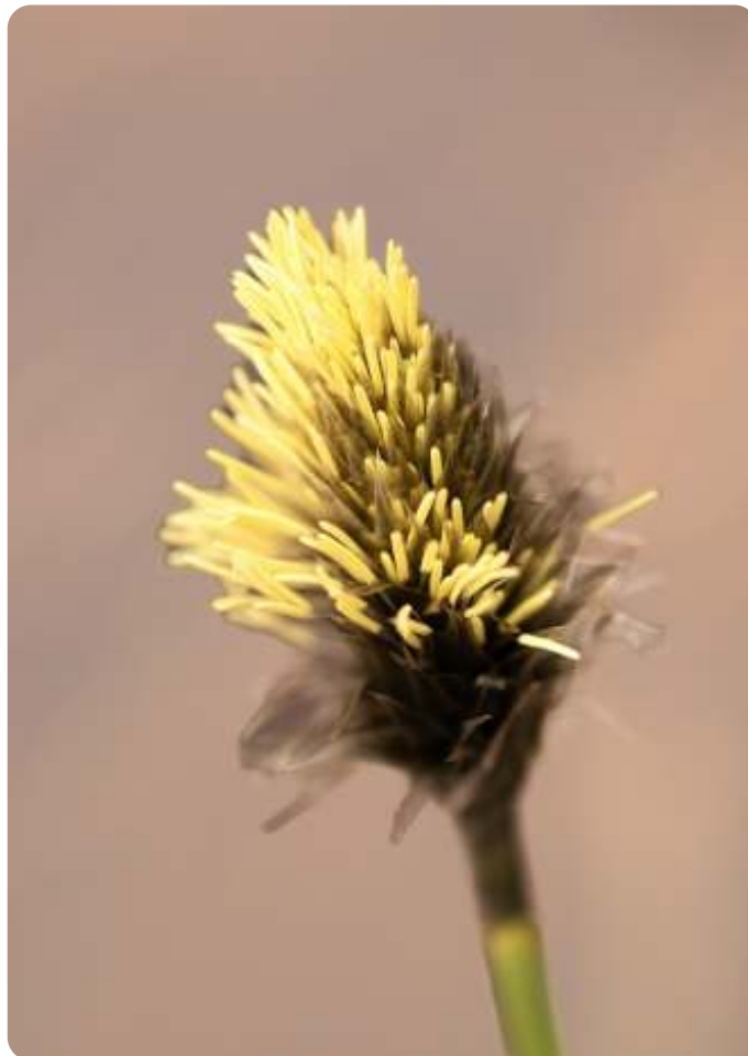
Ellen van den Adel - Wooldse Veen - éénarig wollegras

Bijzondere plantensoorten in dit gebied zijn zonnedauw, veenmos en éénarig wollegras. Tijdens onze fotosafari was het gele stuifmeel van de mannelijke bloem van het wollegras goed te zien. Zeer geschikt voor een macro foto. We zagen ook vogels, waaronder de rode wauw, de geelgors, de klapekster en zilverreiger. We hoorden een groepje dodaars in een plasje iets verderop. In het broekbos met berken en elzen zagen we dat de berken onder invloed van de hoge waterstand het niet wisten te redden.