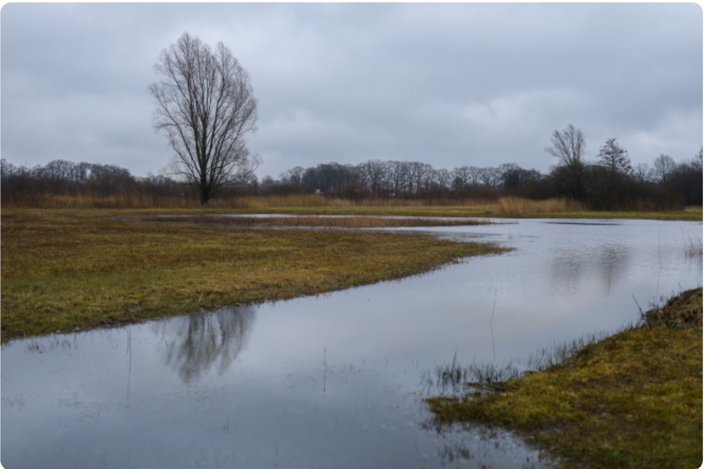
Lisette-Platjouw - Hagenbeek

Wij moesten het in februari echter hebben van het prachtige weidse karakter van het gebied met zijn vele poelen. Hopen op mooie witte wieven troffen we, bij het krieken van de dag, vooral regendruppels. We besloten om ons niet te laten kennen en deze eerste safari toch door te laten gaan. En ondanks de buien hebben we met z'n allen toch genoten van het gebied en mooie plaatjes weten te maken. We richtten ons vooral op symmetrie in het landschap en in de weerspiegeling van het water. Al met al proefde deze eerste fotosafari al snel naar meer, maar dan met iets gunstiger fotografeerweer!