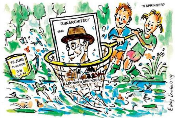
WATERSPEKTAKEL ARBORETUM POORT BULTEN

In het artikel "IVN groeit, bloeit en boeit" kun je lezen wie we zijn en in het redactionele nieuwsbericht "Radical ommezwaai in groenbeleid verontrust IVN" geeft aan waar we voor staan. Deze en nog meer artikelen in 2019 zijn te lezen onder het kopje 'Nieuws' op onze website.