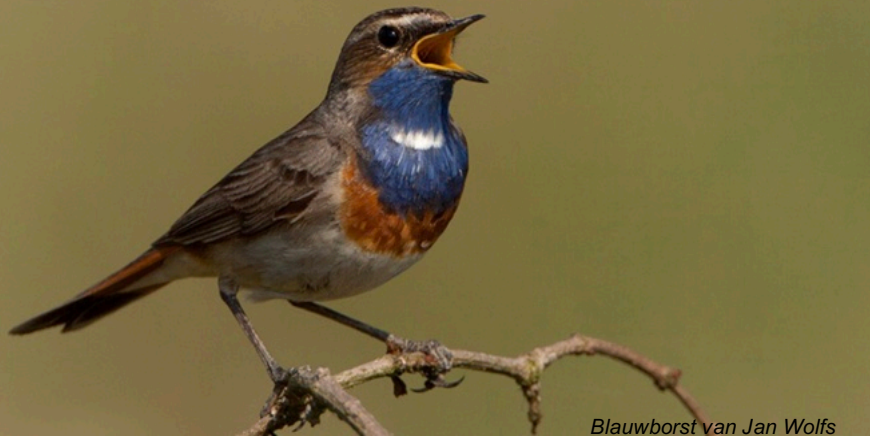
Blauwborst van Jan Wolfs