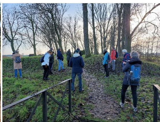
Lunchpauze van de kleine groep, wandeling Beerschoten