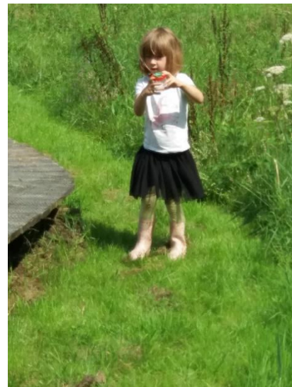
Beestjes bekijken tijdens natuuractiviteit Idylle