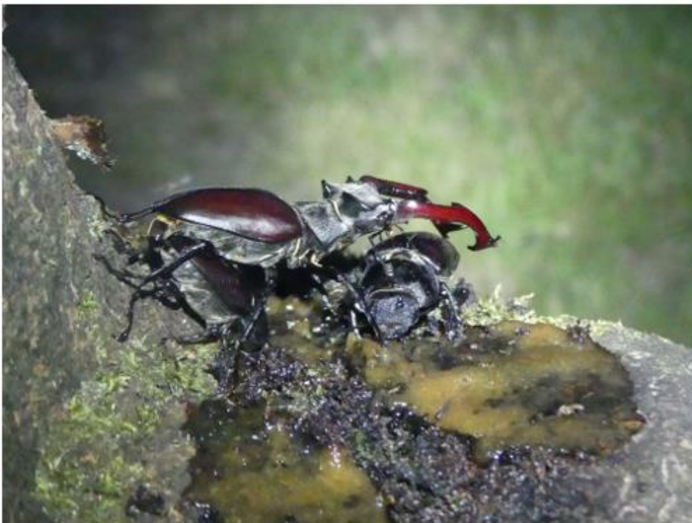
Man en vrouw Vliegend Hert _____