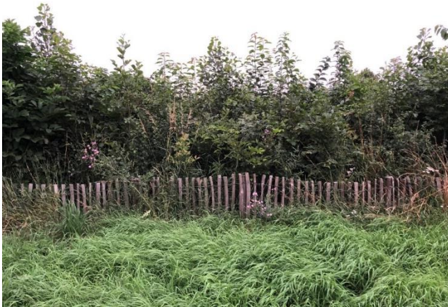
Juli 2021, Tiny Toonladder, 1 ½ jaar na aanplant

De Tiny Toonladder naast de basisschool De Toonladder Galecop is het tweede jaar ingegaan. Helaas zijn door de corona-restricties geen IVN-activiteiten voor de kinderen geweest. Wel is er regelmatig gebruik gemaakt van Tiny Toonladder voor het geven van buitenlessen. 2021 was een groeizaam jaar. De boompjes schieten de lucht in, net als de wilde planten. Het is al een mooi natuurplekje geworden. In juli is met de bosmaaier het hoge gras rondom de Tiny Toonladder weggemaaid. Verder zijn er geen onderhoudsactiviteiten geweest. De bomen nemen het nu over en zullen door hun schaduwwerking de florale ondergroei in toom houden.