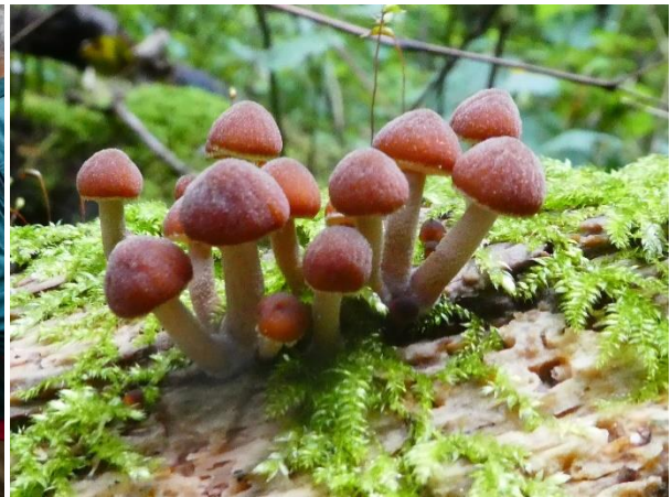
Paddenstoelenexcursie in Oostbroek.