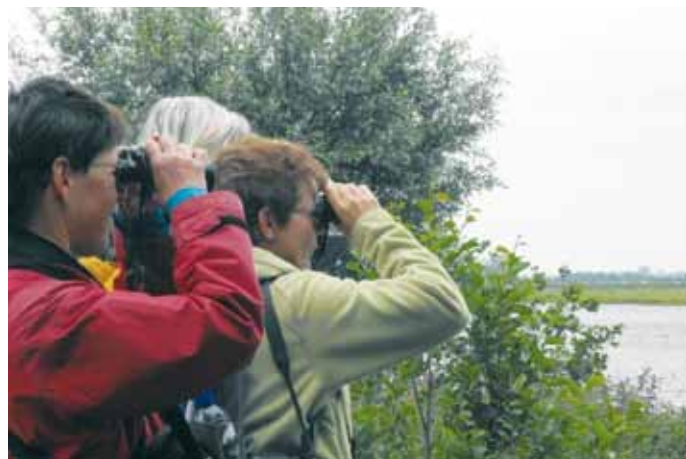
excursie Houtkade Abrona