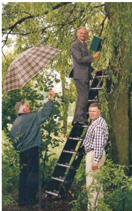
opening tentoonstelling NISED (Natuur in stad en dorp) door ophangen van nestkast

Vergunst. Het MEC maakte er een feestdag van met veel randactiviteiten. Er waren diverse kraampjes bij en ook de rivierpolitie ontbrak niet. Bijzonder aan deze tentoonstelling was, de levensechte vormgeving. De bezoeker kon door een zeven meter lange gang lopen, waar de gevolgen van milieuvervuiling duidelijk zichtbaar waren. In het MEC was een enorme droge sloot nagebouwd. Boven op de sloot waren vanaf een plateau allerlei dieren en planten uit de directe omgeving te zien. Ook de ringslang die in de omgeving voorkomt, ontbrak niet. Om dit te kunnen zien, moest je dus een trap op en kijkend met een verrekijker waande je je in de vrije natuur. De droge sloot bestond uit drie delen: eerst de vervuilde sloot met ratten en muggen, maar verder weinig leven. Wel veel afval. En het stonk! Dan werd de vervuiling minder en het aantal plan-