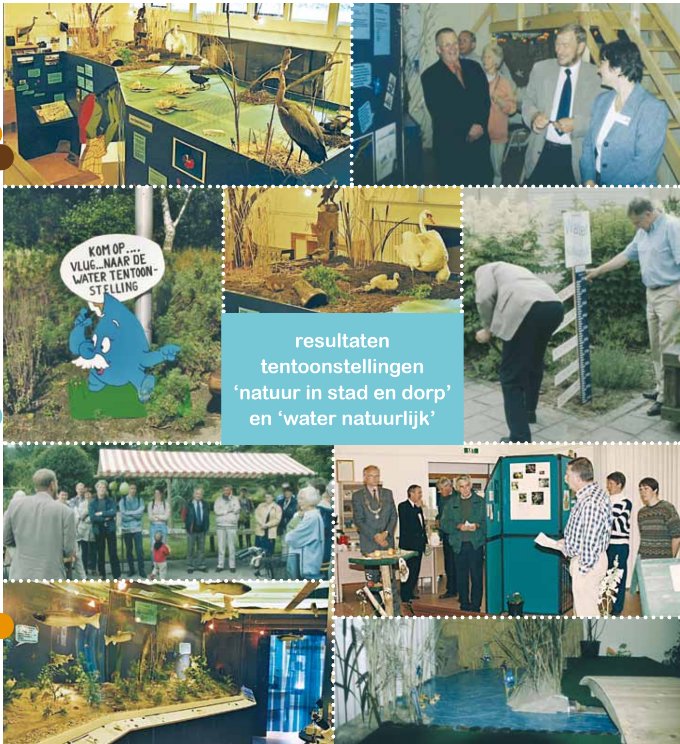
resultaten tentoonstellingen 'natuur in stad en dorp' en 'water natuurlijk'

Ook in de jaren daarna zijn er verschillende tentoonstellingen geweest waaraan de IVN-afdeling heeft meegewerkt. Er waren ook altijd IVN-gastvrouwen en mannen in het MEC tijdens de openstellingen op zondag om bezoekers wegwijs te maken door de tentoonstelling, eventuele vragen te beantwoorden of gewoon een gezellig praatje. Daarbij werden de kinderen natuurlijk niet vergeten.