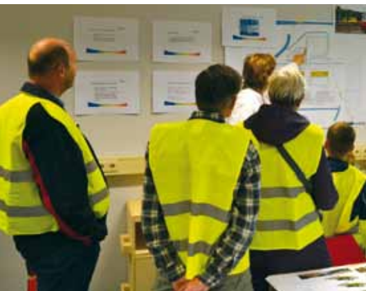
excursie remisseterrein Nieuwegein