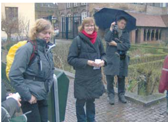
excursie natuurgidsencursus 2007/2008