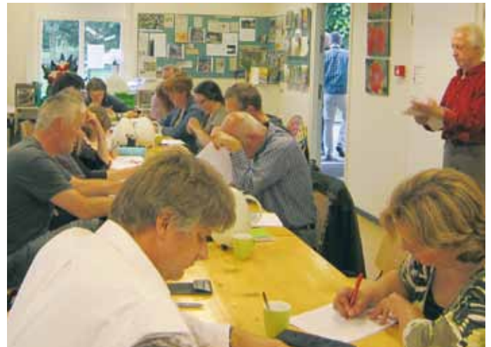
natuurgidsencursus: een toets, hoort er ook bij