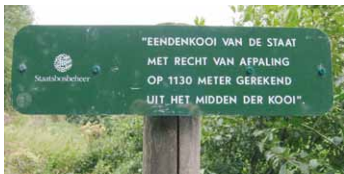
excursie eendenkooi bij Blokland

Degene die het landgoed mochten betreden, voelden zich dan ook zeer bevoorrecht. 'Je weet dat het kasteel er is, maar het is een plek waar je nooit zult komen, dat maakt het mysterieus,' zegt een deelnemer. Vroeger kwam hier blijkbaar de Koninklijke familie op bezoek. Ridderhofstad Oudegein is één van de oudste kastelen van Utrecht. Geschiedenis voert terug tot de 12e eeuw. Tijdens de excursie wordt veel aandacht besteed aan de landschappelijke elementen bewaard gebleven in het openbare deel van het park, die vroeger ook bij het landgoed behoorde zoals de oude griend en het platanenlaantje.