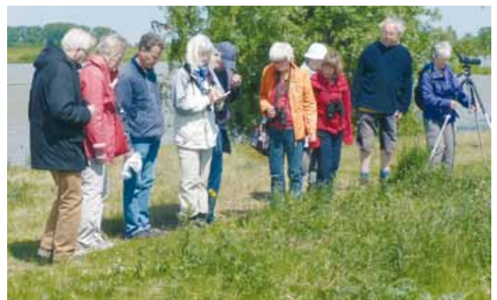
excursie Lek bij Everdingen