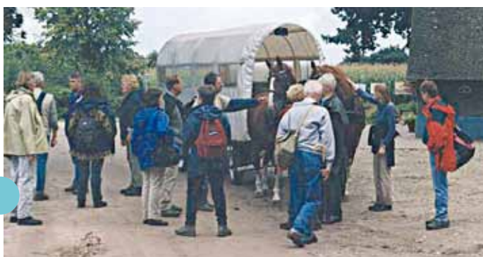
startweekend in Neede 1998/1999