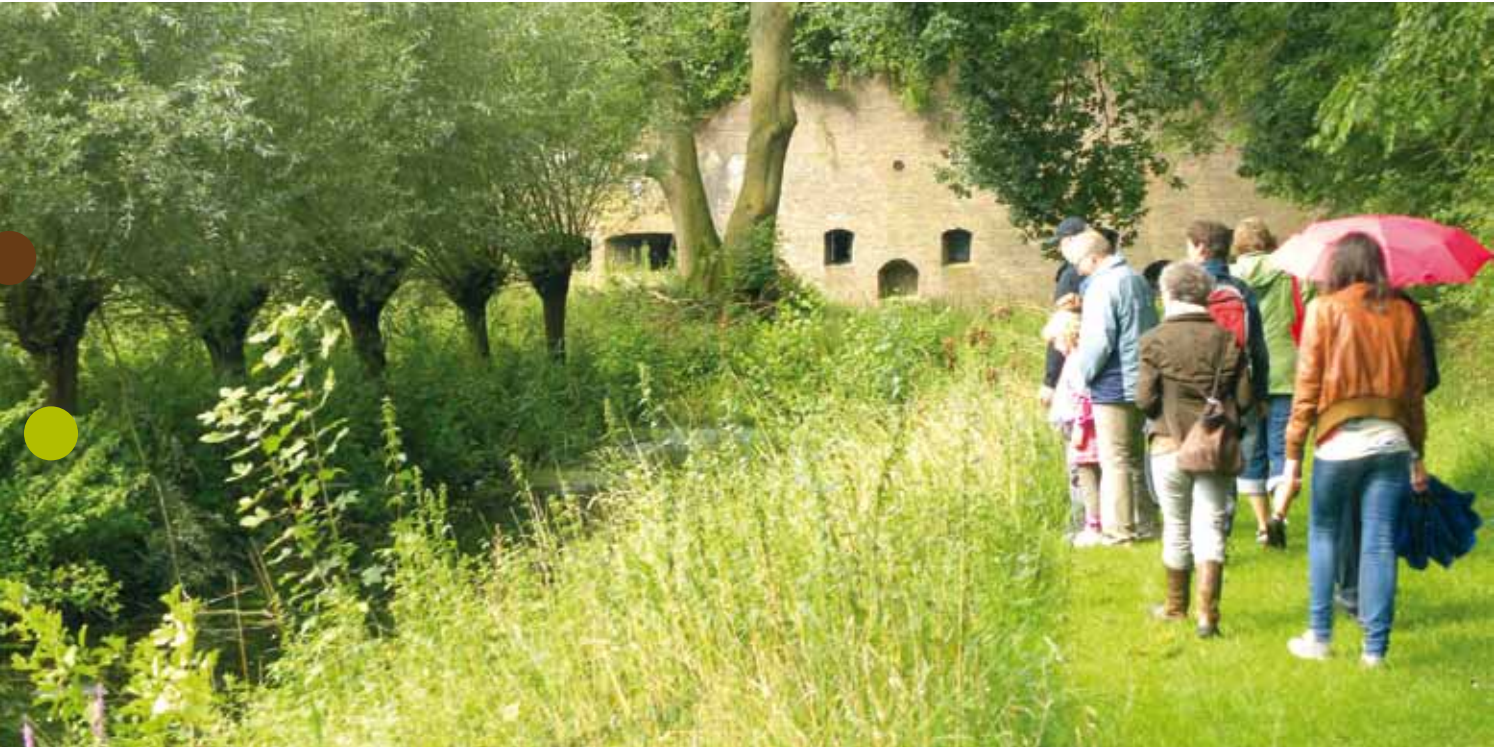
excursie Fort Rhijnauwen

Een andere kernactiviteit van de IVN afdeling is natuurlijk het organiseren van excursies. De afgelopen twintig jaar hebben de IVN-gidsen veel mensen laten genieten van de mooie stukjes natuur in de omgeving. Het is echt helemaal niet nodig om verre reizen te maken om te kunnen genieten van een natuurlijke omgeving.