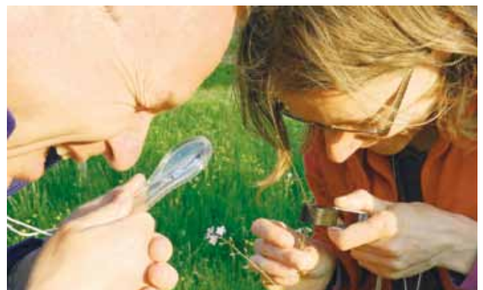
cursus planten determineren

De Cursus determineren van wilde planten was niet nieuw, maar is weer nieuw leven ingeblazen in 2012. Paddenstoelen mogen ook de laatste jaren weer meer op belangstelling rekenen. Vanuit de plantenwerkgroep werd er een sub-werkgroep Paddenstoelen opgericht. Eind 2013 was er de cursus "beter paddenstoelen fotograferen". De dingen die je voor een dergelijke hobby nodig hebt, ja dat is wel heel bijzonder: een vuilniszak en een zakje bonen...? Die vuilniszak is mij intussen wel duidelijk (zie foto), maar dat zakje bonen, kan iemand dat nog eens uitleggen?