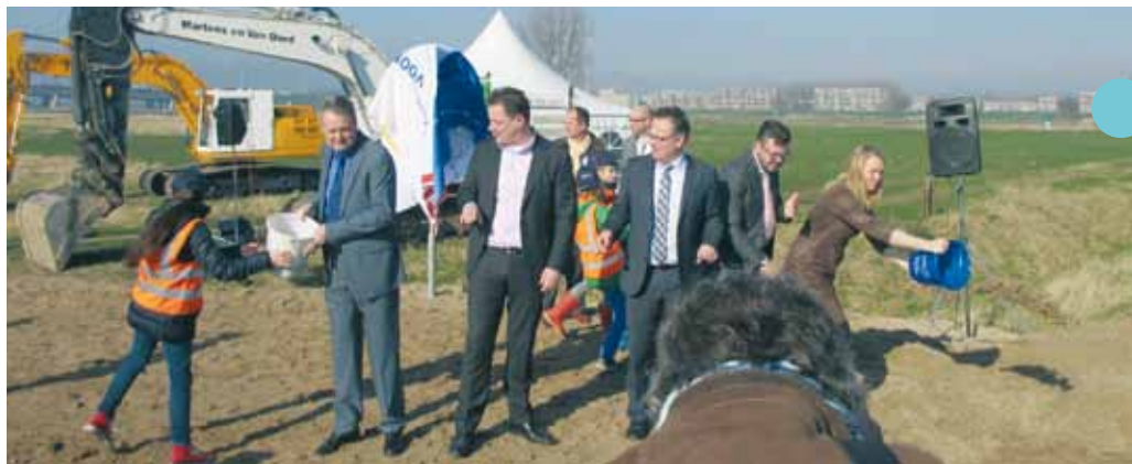
startsein 'Ruimte voor de Lek' door minister Schulz

Bezuinigingen op groen, vooral onderhoud, vonden eerst plaats in Nieuwegein en later ook in IJsselstein. Het project 'NIEUWegein GROEN' in Nieuwegein en 'Andere kijk op groen' in IJsselstein waren duidelijk vergelijkbaar van opzet. Voor de afdeling heeft dit zowel in Nieuwegein, als in IJsselstein heel wat uurtjes vergaderen gekost met wisselend succes. In Nieuwegein heeft het uiteindelijk wel geresulteerd in een bomenverordening, in IJsselstein nog niet. Daar bleven nog veel bomen op de nominatie staan om gekapt te worden. Door samenwerking tussen verschillende groepen zoals 'Stop Bomenkap IJsselstein', de Vogelwacht, de IVN-afdeling Nieuwegein-IJsselstein e.o. en een aantal individuele bewoners uit IJsselstein is het 'Groenplatform IJsselstein' opgericht. De acties die tot nu toe hieruit voort gekomen zijn, hebben zeker geleid tot (beperkte) resultaten. Er zijn veel bomen van de kaplijst