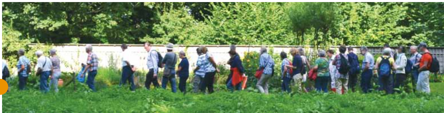
Ledenuitje Landgoed Linschoten