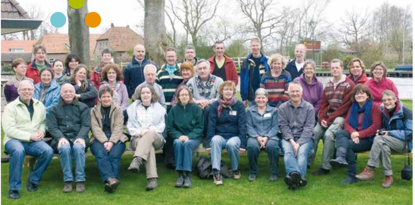
cursusgroep van 2012/2013 - eerste weekend in de Weerribben met 17 deelnemers binnen de afdeling Nieuwegein-IJsselstein e.o.