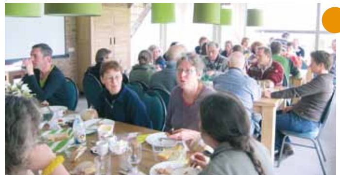
natuurgidsencursus 2012/2013 - eerste weekend in de Weerribben

Wat niet vergeten moet worden is dat - hoewel de cursus zelf 1,5 jaar duurt - ook de voorbereiding door het IVN-cursusteam menig avond in beslag neemt. Alles bij elkaar kost het een cursusteam zo'n 2 tot 2,5 jaar aan voorbereiding en het geven van de cursus.