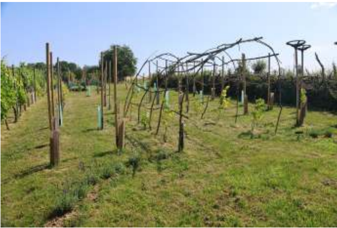
Zicht op de educatieve wijngaard. Rechts wordt dit deel afgesloten door een houtwal, daarachter ligt de Hóddelshaof, genoemd naar de Hóddelsley.