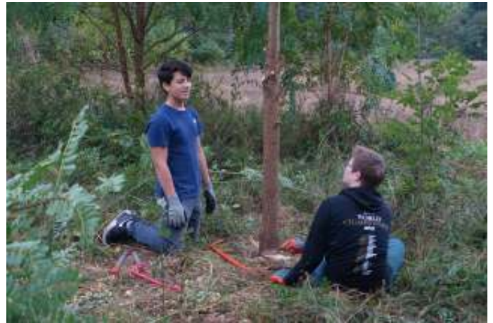
Scholieren van Trevianum tijdens hun maatschappelijke stage op de Wanenberg en in de heemtuin.