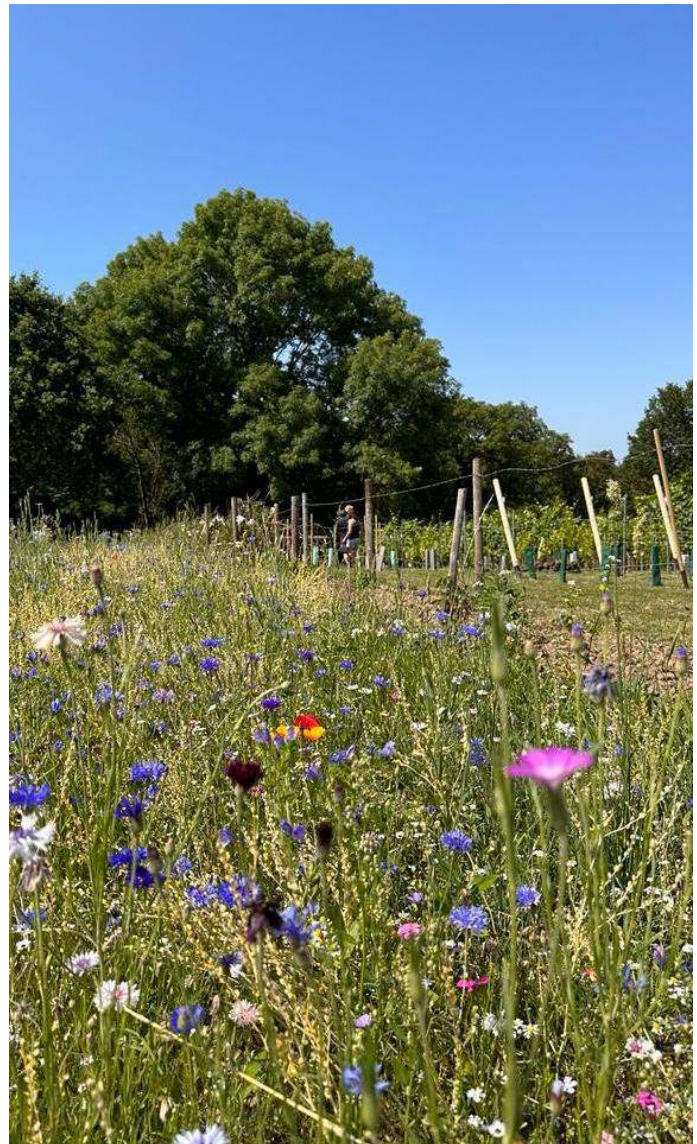
Het bloementapijt Hóddelshaof, dit voorjaar gezaaid, mag zeer geslaagd worden genoemd. Wij zijn heel benieuwd wat er volgend jaar van terugkomt.