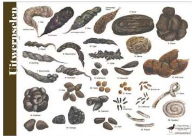
Poep-toekkaart, met sitting op de achterkant. Illustraties Jasper de Ruiter

Hoewel minder sexy is het determineren van de uitwerpselen vaak een van de betere methoden om vast te stellen welke dieren er zich in een gebied