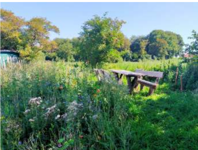
De oostelijke hoek van de Hóddelshaof met picknickset. Voorheen stonden hier jaar na jaar de brandnetels tot schouderhoogte te reiken, ongetwijfeld een paradijs voor vlinders en ander gedierte. Hopelijk zijn die ook tevreden met wat er nu staat.