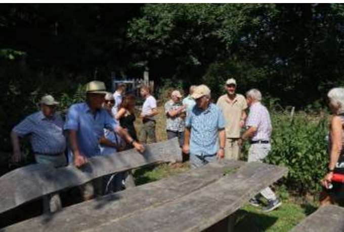
Picknickset BelaefBóngerd, anoniem geschonken aan IVN MunsterGeleenSittard 2021