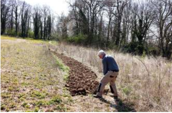
Al 16 m2 gespit!