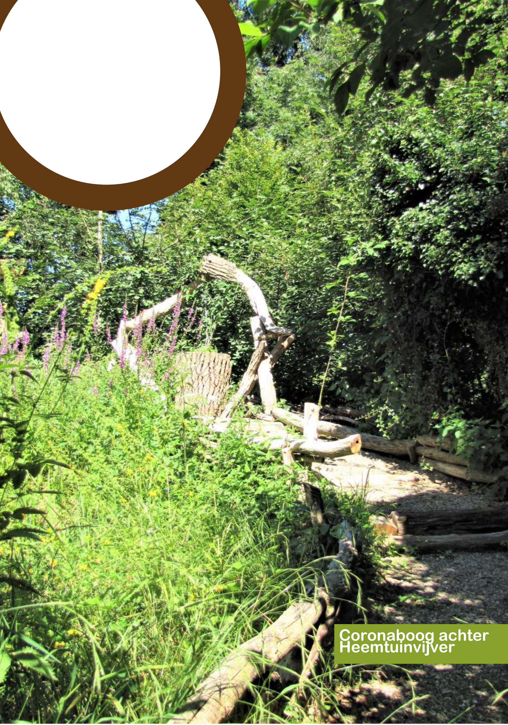
Coronaboog achter Heemtuinvijver