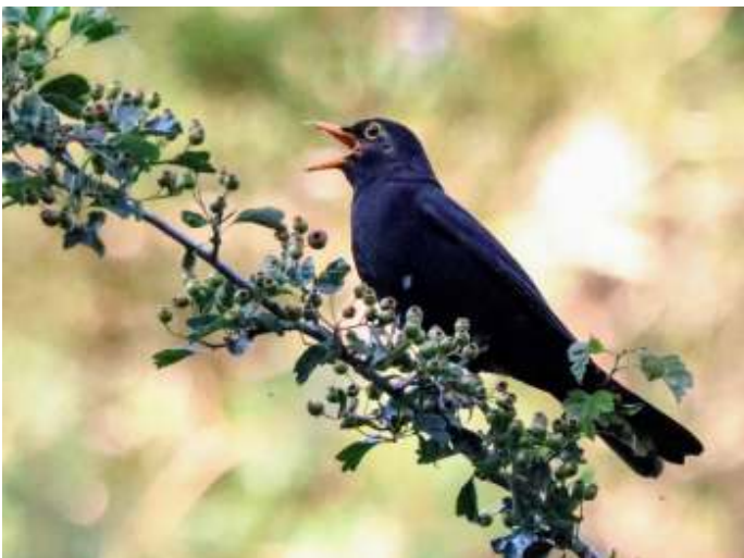
Meels hebben er weer lol in