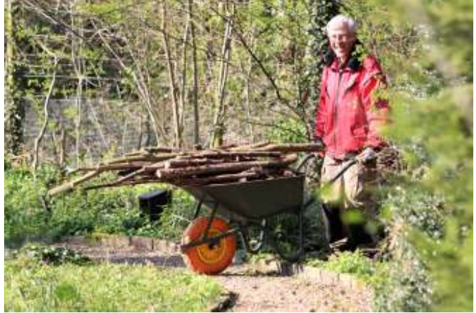
Hout verplaatsen t.b.v. de egeltjes