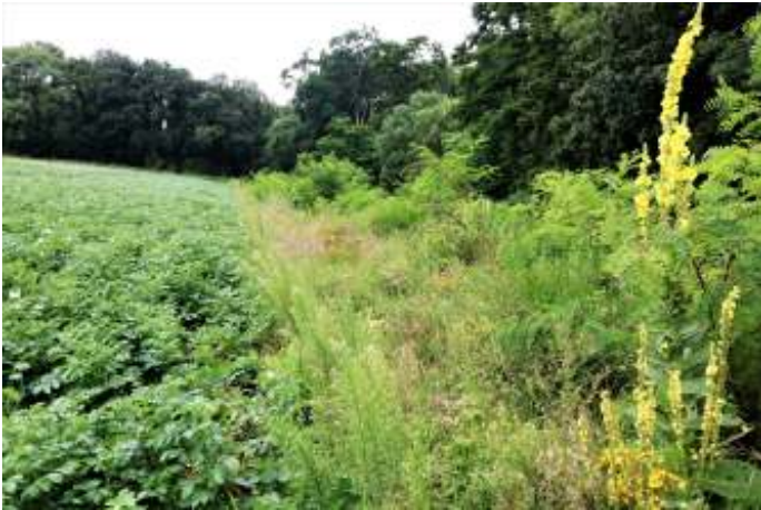
Bloemrijke akkerrand in de zomer