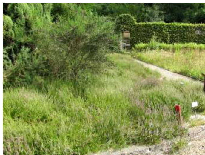
... maar de heide staat vanaf 3 augustus in bloei - komt dat zien!