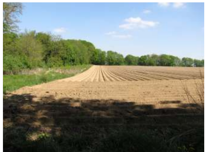
Aardappelveld boven de Heemtuin afgelopen voorjaar.

Kenmerkend voor de Wanenberg is dat de hoogste delen, restanten van de oorspronkelijke laagvlakte waarin de oermaas miljoenen jaren geleden geulen heeft uitgesleten, als landbouwareaal worden gebruikt, de glooiende delen als hellingweide (o.a. langs de weg 'Wanenberg', met een fraaie graft daarin), de steilere delen als hellingbossen.