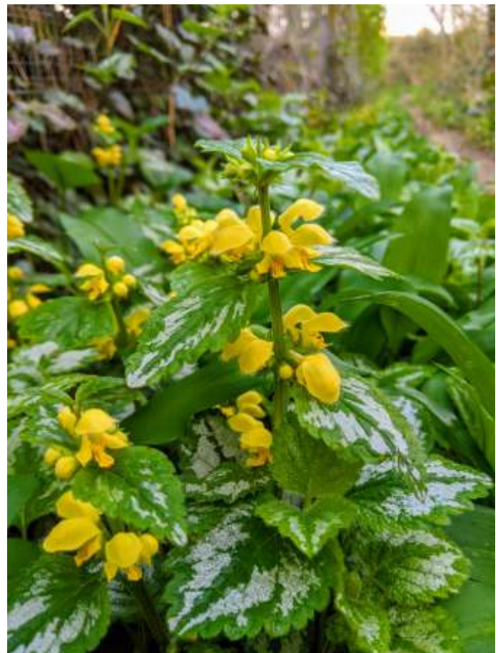
Gele dovenetel (Ank Ronkaars, vroeg in de coronatijd)

Plaats: Parkeerplaats Watersley Tijd: 19.30 uur Informatie: Lex Vlieks 046-4511554