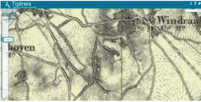
De kaart van het gebied uit 1864