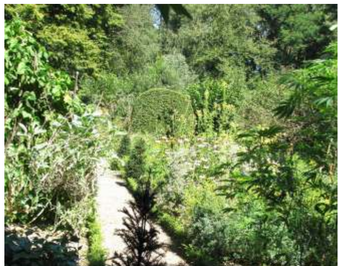
Heemtuin eind juli