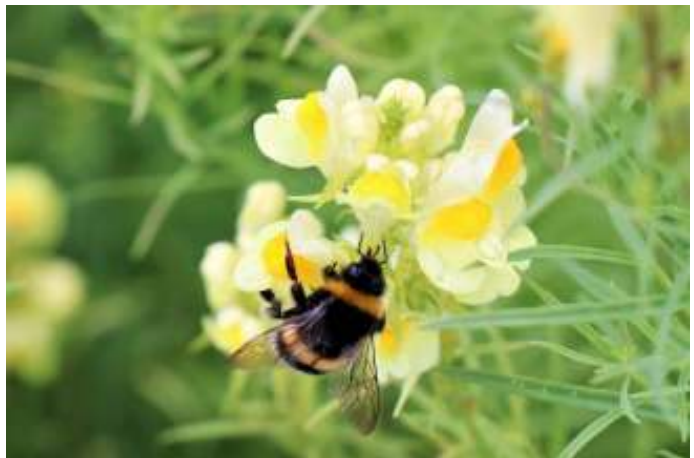
Een dankbare hmmel Het bloemenzaad werd betrokken van de Bijenstichting