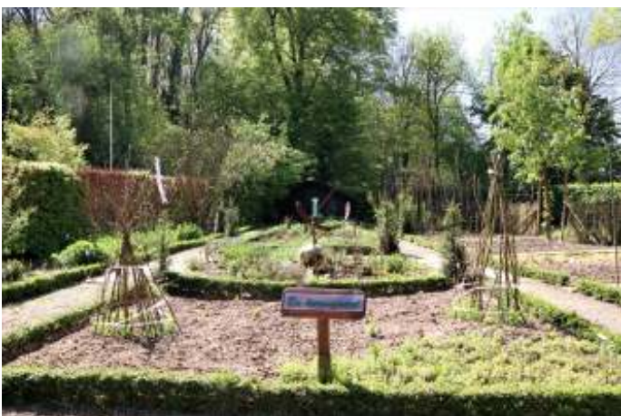
Heemtuin in het vroege voorjaar