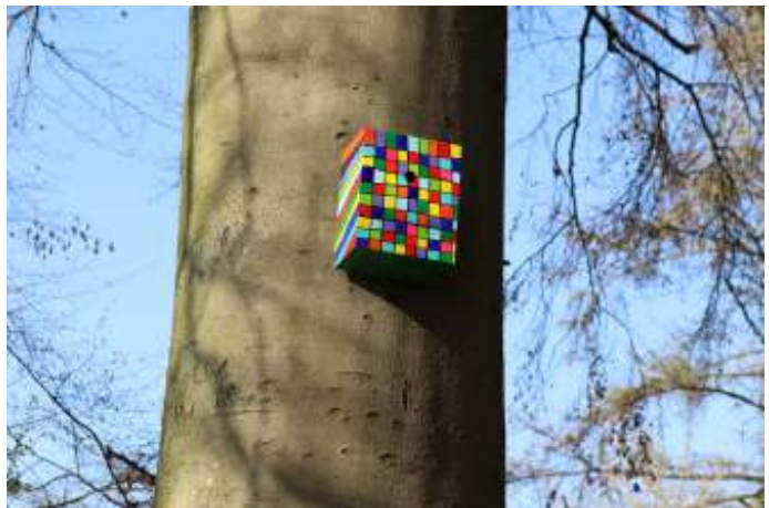
Vogelhuisje Andries Houbenbeuk