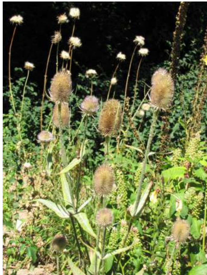
In de Heemtuin is het alweer nazomer getuige de Kaardebollen en het zaadpluis van de Mariadistel ...