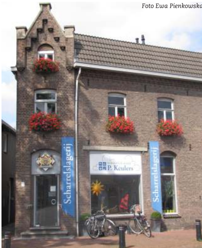
De scharrelslagerij van Munstergeleen, Houbeneindstraat 1