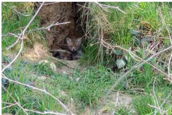
"Nest van 4 jonge vosjes waarvan er twee nieuwsgierig naar me bleven kijken vanuit hun holletje. Foto is aanvang april gemaakt door mij aan de Waneberg" (ingezonden door Sjef Gorissen).