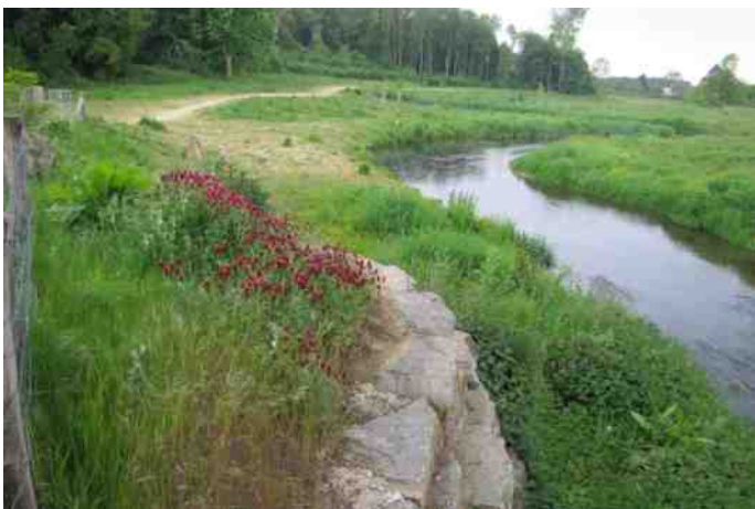
Rode klaver - Geleenbeek