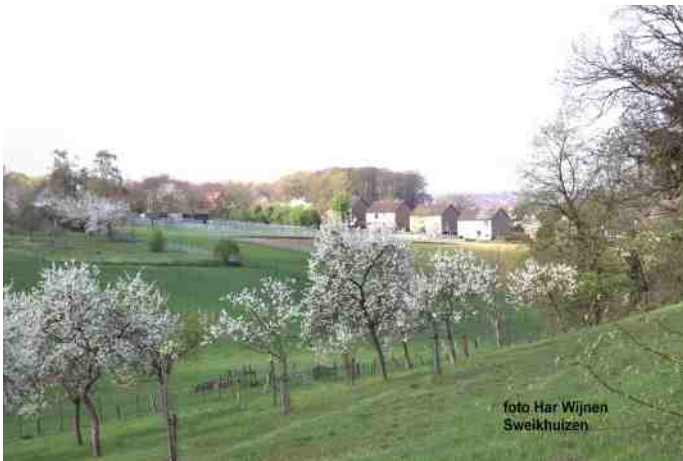
Sweikhuizen

Het landschap bij Sweikhuizen met de bloeiende Rëngelaote op de meest zuidwestelijke uitloper van het Plateau van Doenrade (Stammenderberg - de locatie van de foto staat plaatselijk bekend als Op de Heugte), waar de Geleenbeek een bocht maakt. Vanuit het oosten komend stroomt zij, langs de Stammenderberg, in noordelijke richting verder langs de Danikerberg, ook een uitloper van het Plateau van Doenrade.