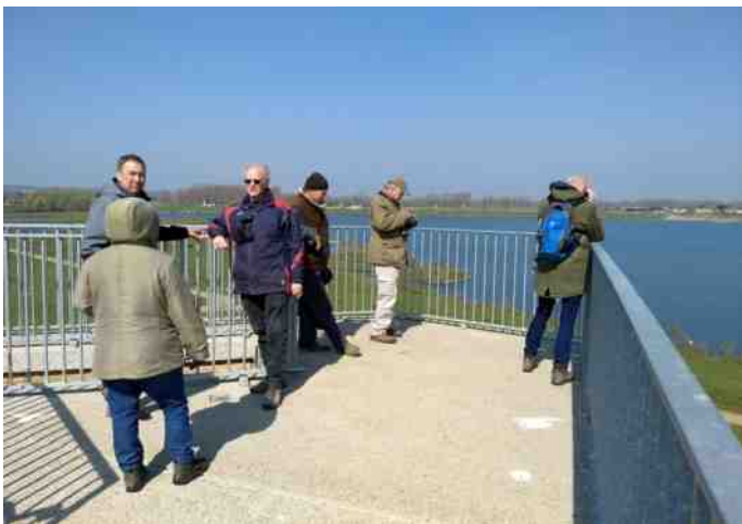
Kijken naar Nederland vanuit België