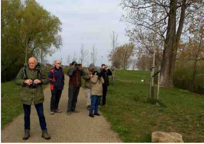
Vogelwandeling De Wissen 15 april