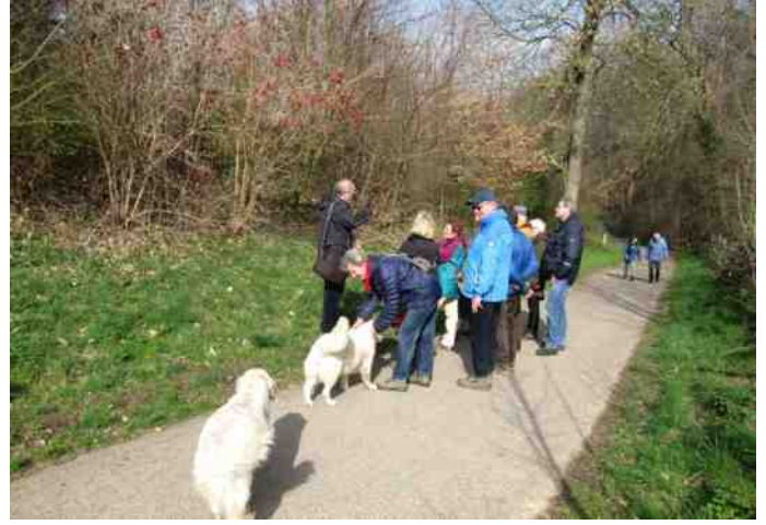
Wandelgroep 24 maart