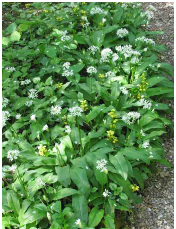
Daslook & gele dovenetel