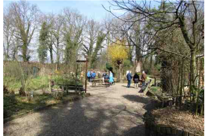
Heemtuin 24 maart