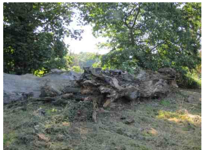
Monumentaal dood hout in het kasteelpark

Aangekomen bij de regenopvangbekkens, die overigens altijd droog staan, brak een fiks onweer los met zware regen en dit betekende het einde van de wandeling.