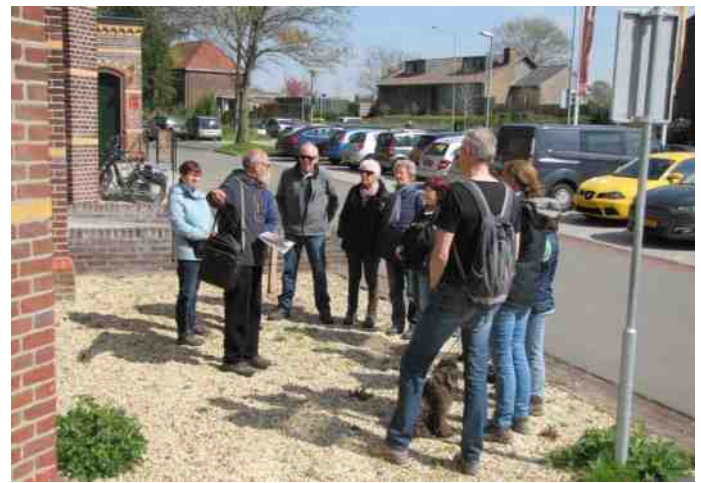
Wandelgroep 10 april