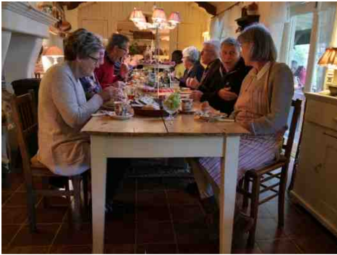
In het vintage tuinhuis ...