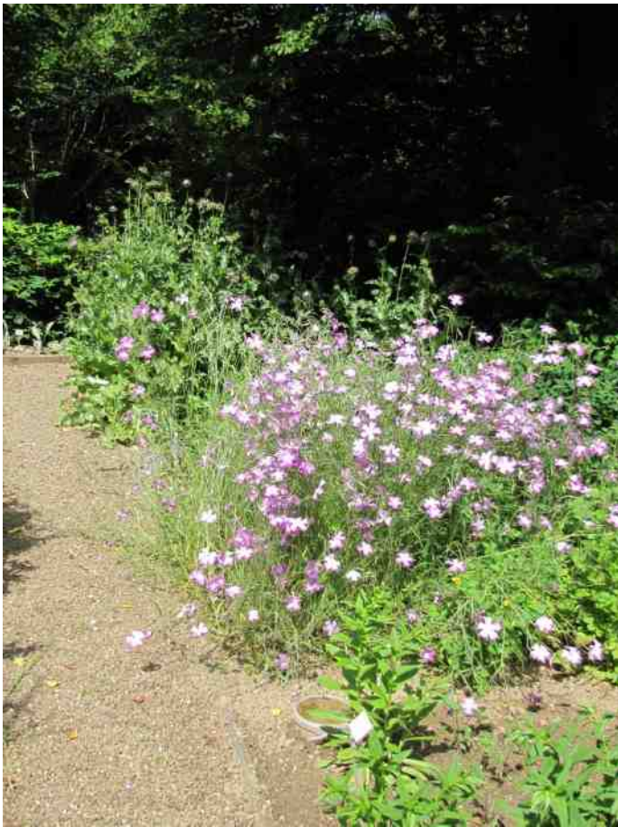
Giftige kruidenhoek in de Heemtuin

De Bolderik, Agrostemma (= akkerkrans) Githago (die tweede naam is misschien afkomstig van de naamgever) wordt van oudsher beschouwd als een van de akkeronkruiden en stond vroeger tussen de rogge, waarmee hij eendrachtig opgroeide en die hem met zijn fraaie bloemen overeind hield. De bloemen zijn eetbaar en geliefd bij vlinders en bijen. Maar de zaden zijn giftig en kwamen vroeger in het meel terecht. Voor het maag- en darmstelsel van mens en dier kon dat rampzalige gevolgen hebben. Dus werd de plant uitgeroeid en blijven onze darmen gespaard maar leggen vlinders en bijen het loodje.