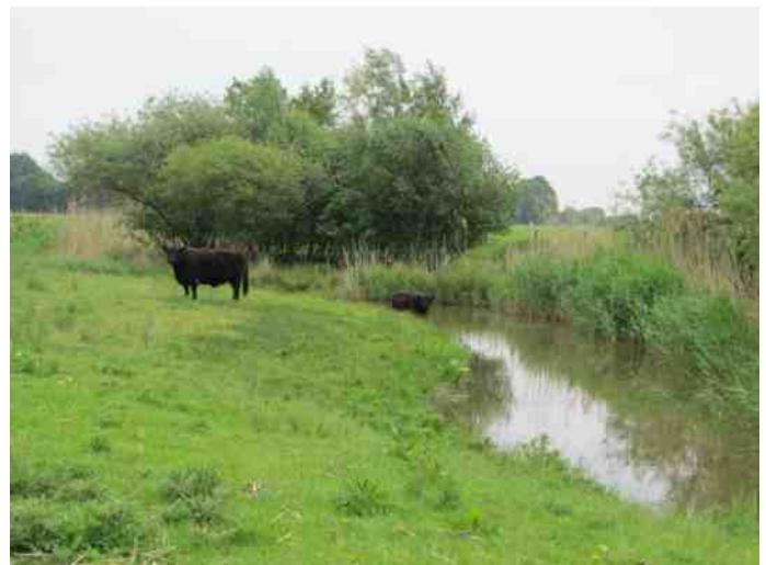
Grote Grazers nemen pauze