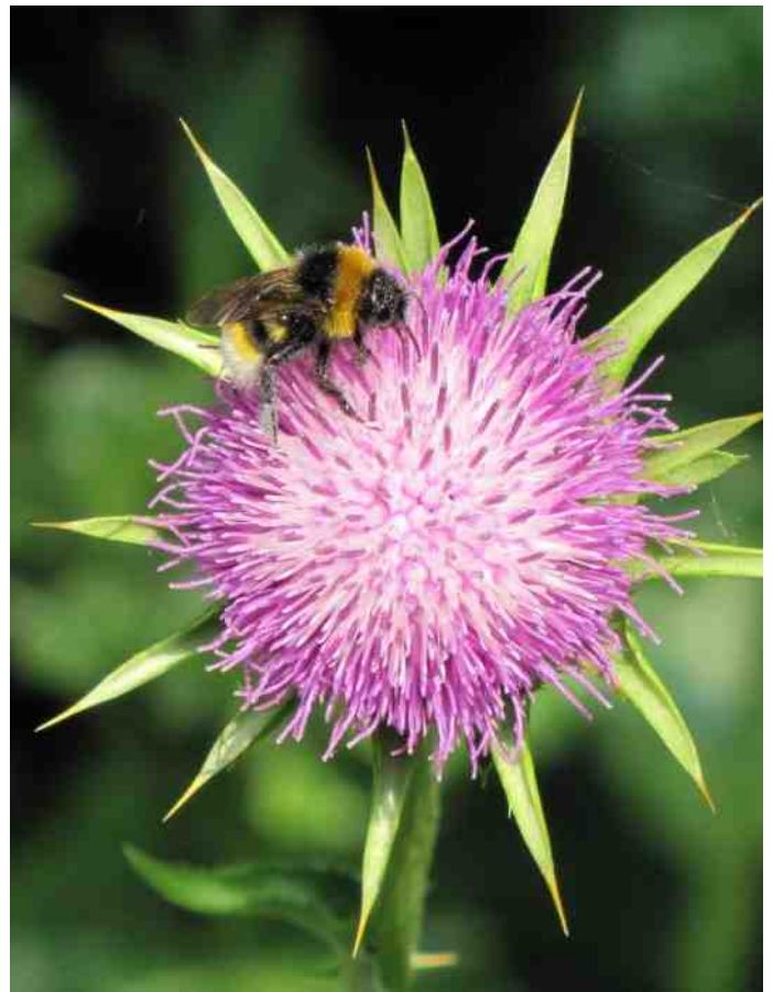
De bloem van de Mariadistel trekt o.a. veel hommels aan

Silybum komt van het Griekse Sillybon = distel. Volgens de legende zijn de witte vlekken op de bladeren veroorzaakt doordat melkdruppels van Maria's borst op de plant vielen, toen ze met de pasgeboren Jezus moest vluchten naar Egypte en zij de baby wilde verstoppen onder de grote bladeren van de plant. De plant komt veel voor, maar in een aantal landen, o.a. Duitsland, is zij beschermd. Ze heeft graag een droge, zonnige plek. Bij veel regen ontwikkelen de bladeren zich enorm, wat gaat ten koste van de vrucht.