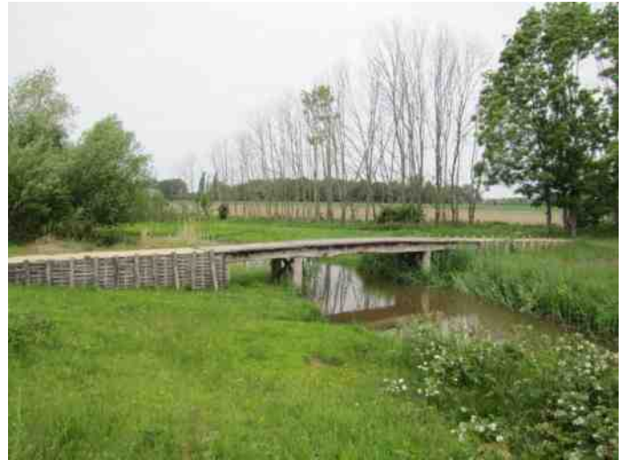
Brug met in Romeinse cijfers het jaartal: MMVIII

Tijdens de herstelwerkzaamheden aan de beek werd een Romeinse brug aangetroffen, althans de palen die deze brug gedragen moeten hebben. Niet ver van deze plaats is een nieuwe brug gelegd die een idee moet