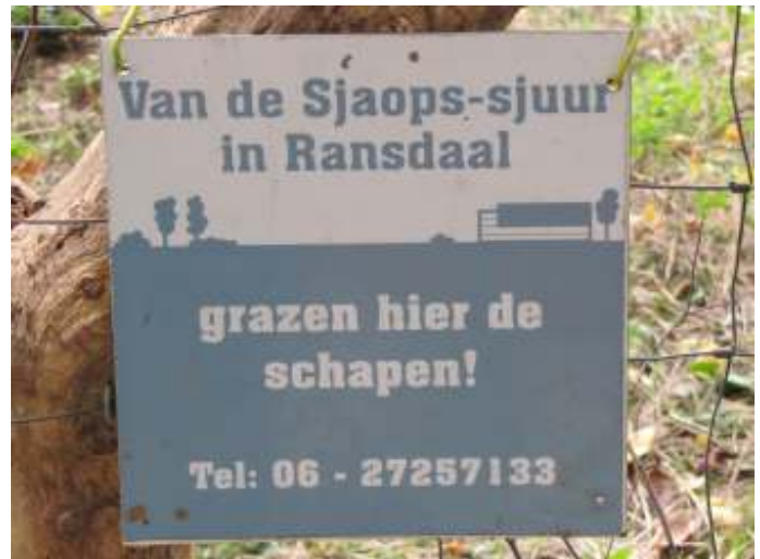
Foto hierboven: 'Shropshire -Sjaops-sjuur' de gelijkenis is te opvallend om toevallig te zijn!