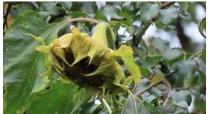
27 september