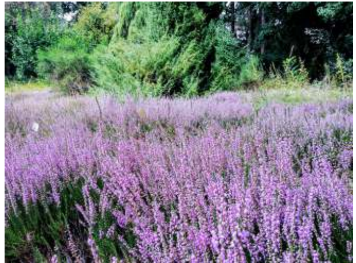
Heide (foto: Ewa Pienkowska, 1 september)