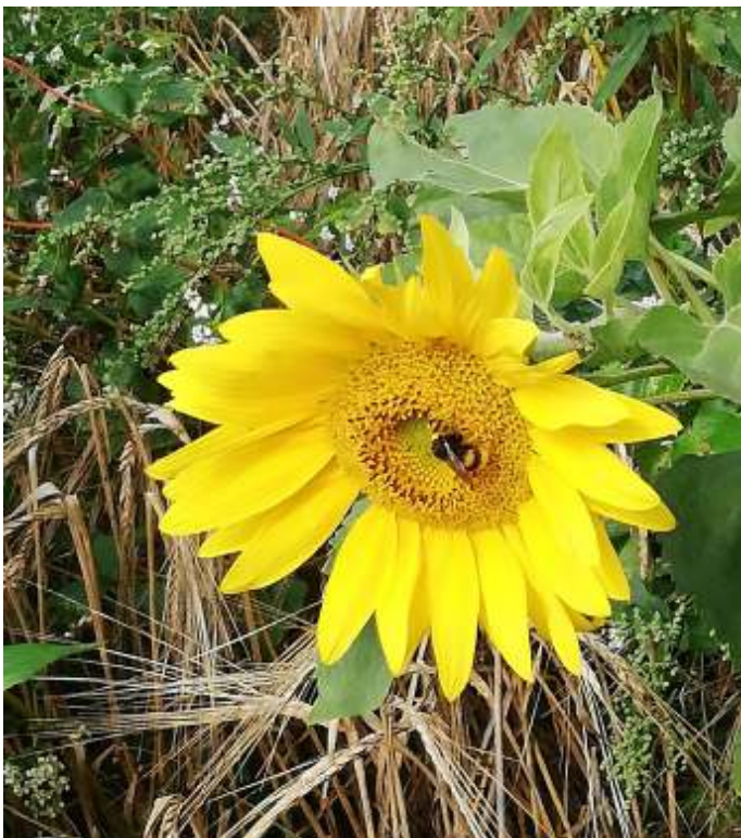
Bloeiende aardpeer (1 september)