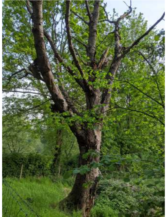
Dode kersenboom door Ank Ronkaars

De foto van de al vele jaren dode kersenboom in de bovenste hoek van de hellingweide die ooit een boomgaard was, werd mij toegestuurd op 14 oktober. Foto en bijschrift laten mooi zien hoe mensen, dieren en bomen samenleven, hoe dood en leven misschien niet zo van elkaar gescheiden zijn als het meestal lijkt en hoe schoonheid kan bestaan in de dood.