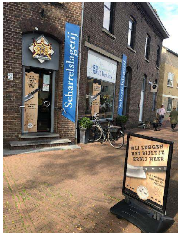
IVN Munstergeleen dankt Scharrekslagerij P. Keulers voor de jarenlange sponsoring.

U en wij mogen tevreden zijn met het resultaat bij de Hondskerk.