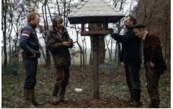
Dit is de 2de voedertafel die in het verleden in de Handskerk is geplaatst