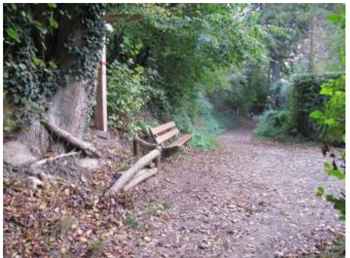
Skelet van de grondkering bij de entree Heemtuin op 17 oktober.