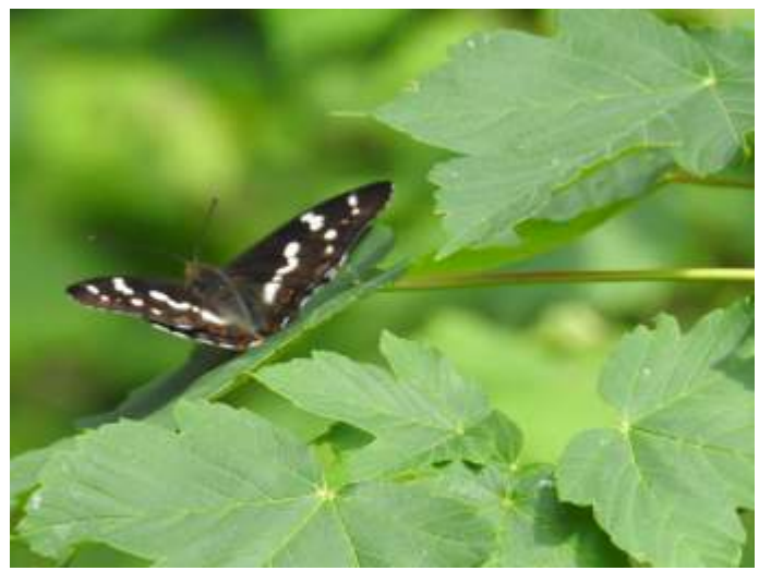
... vleugels geopend