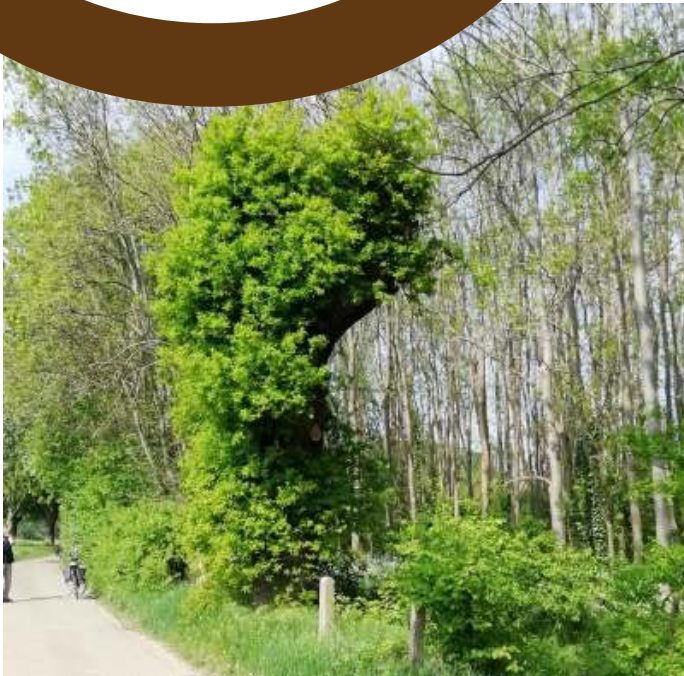
Het vonnis is geveld: de knoteik langs de A2 bij Born wordt gekapt. Hij is zeer vitaal maar niet verplantbaar (foto: Arno Duwel, 24 april).