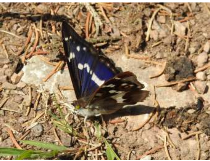
Vleugels gesloten ...