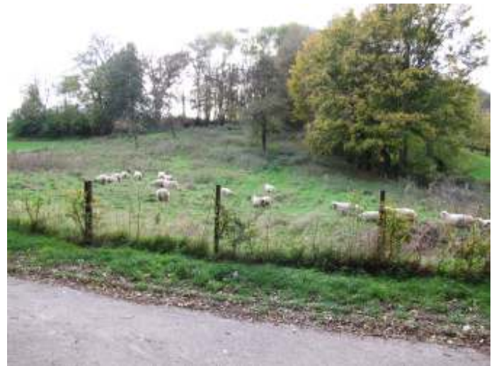
Zaterdag 31 oktober: Shropshire-schape van de Sjaops-sjuur Ransdaal nemen bezit van de wei en vreten ze binnen 14 dagen kaal