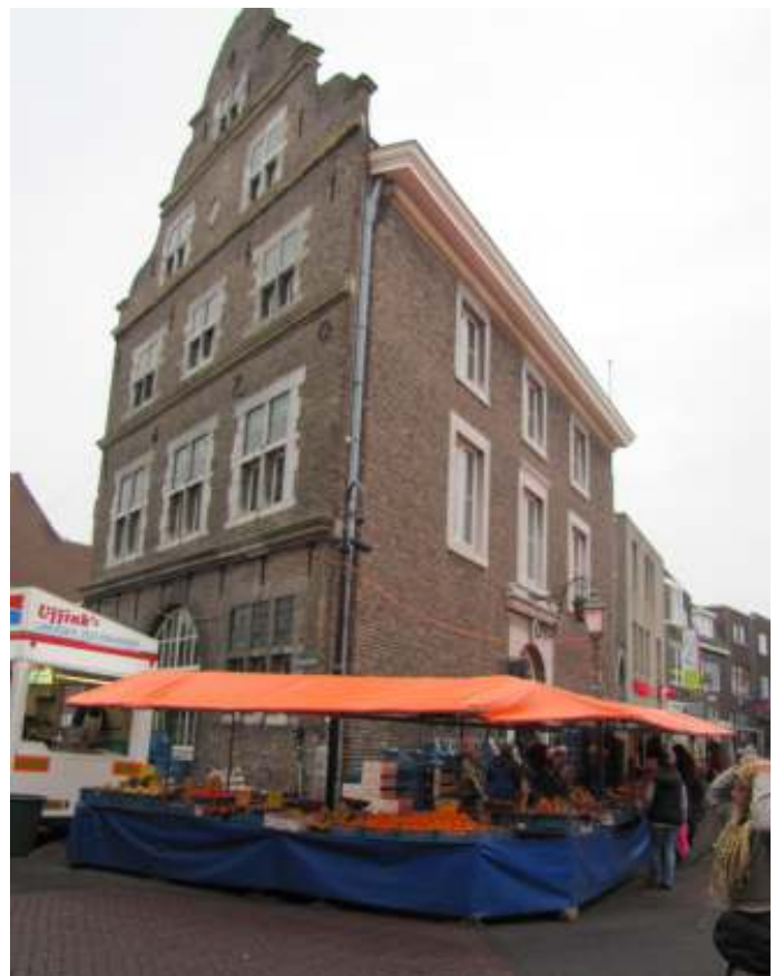
Elly Hermans groente bij het Kritraedthuis op de donderdagmarkt, Sittard. Intussen staat de de groentekraam op de mstrkt.