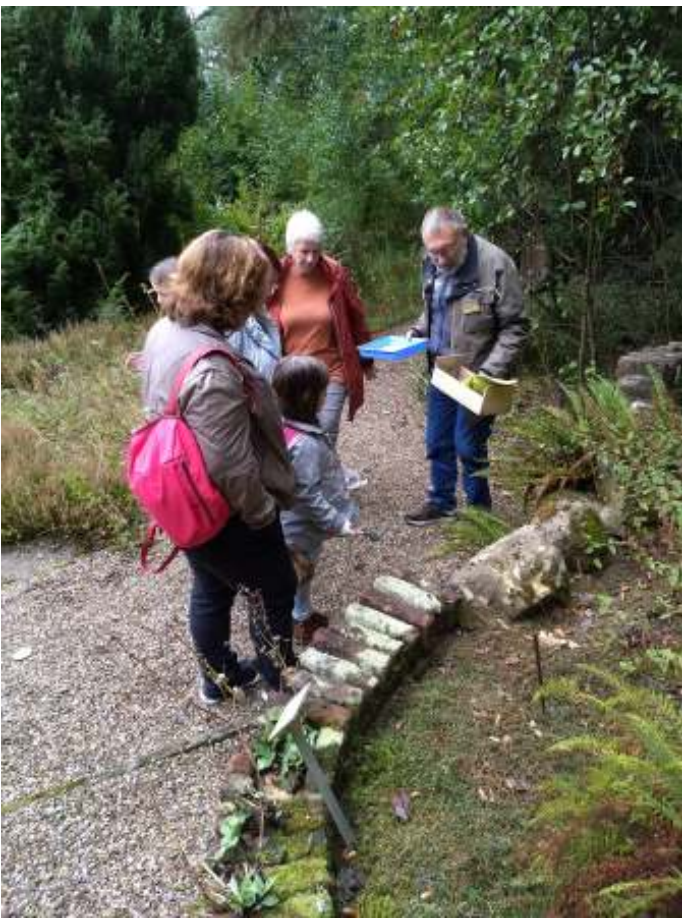
Op zondag 27 september, in de periode van de Bodemdierendagen, leidde