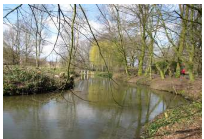
... en op 4 maart 2020