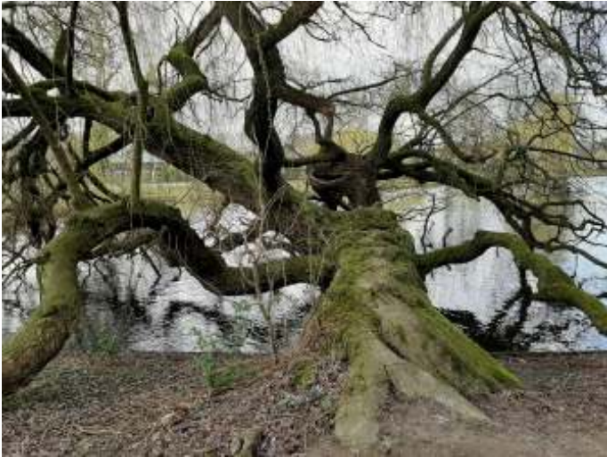
Liggende treurwilg, vooralsnog gespaard (zie De Limburgerr 6 maart)