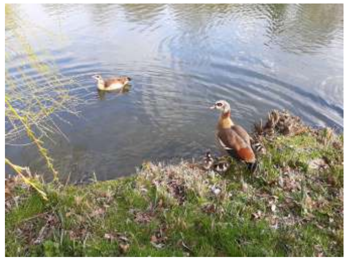
Nijlganzenkoppel met kuikens