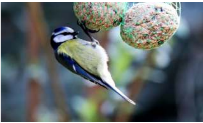
Ewa Pienkowska maakte deze vogelfoto's op 7 maart 2020. Hierboven: Pimpelmees en Boomklever; hieronder: Roodborst en Roodborst van kleur verschoten