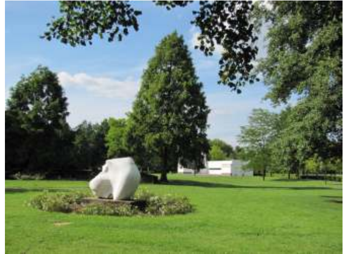
Europa & de stier (Gjus Roebroek)