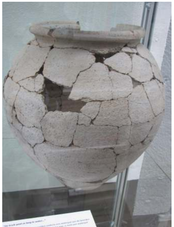
Deze Romeinse kruik werd in stukken aangetroffen in het Geleenbeekdal en in elkaar gepuzzeld door restauratieatelier Restaura in Heerlen

De wandeling zal om 13.30 uur starten vanaf Peterstraat 1 (voormalig raadhuis, nu huisartsenpraktijk), 6151 EA Munstergeleen. Duur van de wandeling: 2,5 uur.