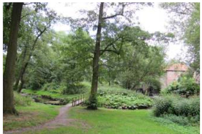
... en voorheen