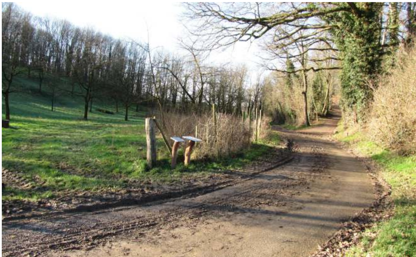
Kersenweide Hoddelsley/Botkuilweg. De gemengde haag is in februari door de gemeente aangevuld.