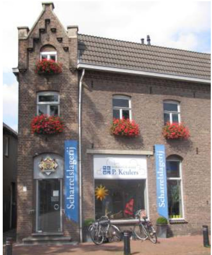
De scharrelslagerij van Munstergeleen, Houbeneindstraat 1

Zaterdag 14 maart om 14.00 uur opening van de expositie "Klimaat en Duurzaamheid" ter gelegenheid van het 50 jarig bestaan van IVN Spau-Beek. De expositie in het Elsmuseum is tot stand gekomen in samenwerking met de kinderen van de basisschool Spaubeek en de OBS De Kring uit Genhout. De opening gebeurt door de burgemeester van Beek, mevrouw C. van Basten-Bodden. Verder zal ook het provinciaal en landelijk IVN bijdragen leveren en tevens zullen jubilarissen gehuldigd worden. Aanmelden voor 8 maart info@ivnspaubeek.nl . De expositie in het Elsmuseum, Wolfeynde 4c, Beek is tot eind juni te bezoeken op elke 2 zondag van de maand tussen 13.00 en 17.00 uur.