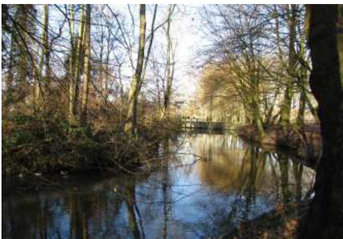
Zicht op Stenen Sluis stroomafwaarts december 2019