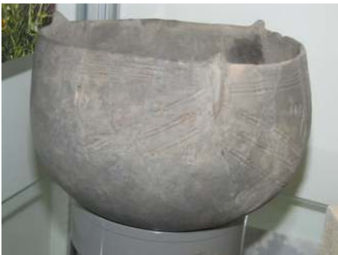
Kom uit de Lineaire Bandkeramische cultuur

In de afgelopen vijf jaar is bij Munstergeleen door het samenwerkingsproject Corio Glana de Geleenbeek en het beekdal op de schop genomen. De beek meandert weer en het beekdal is voor een deel heringericht.