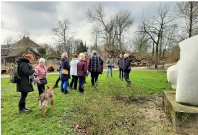
Vanaf Marmersculptuur naar Ophovener Molen - huidige blik ...