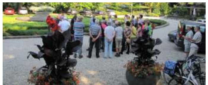
Bij de rotunda voor Kasteel Elsloo in 2015

Zo 31 mei: Feestelijke opening Botanische Tuin, 13.00 - 16.00 uur