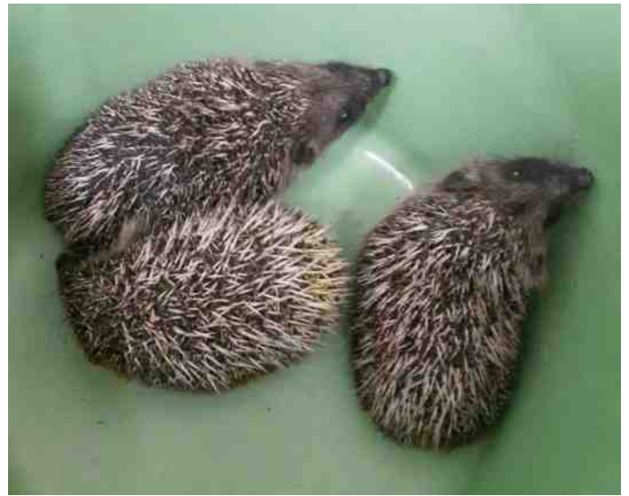
Hieronder een huisvestingsuggestie voor de familie egel