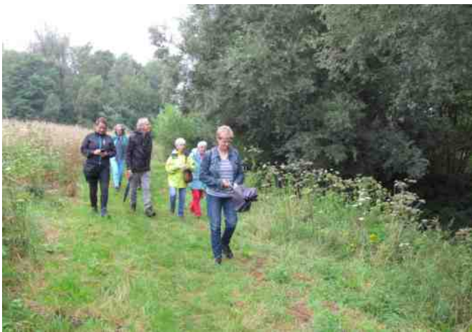
Langs de Rode Beek