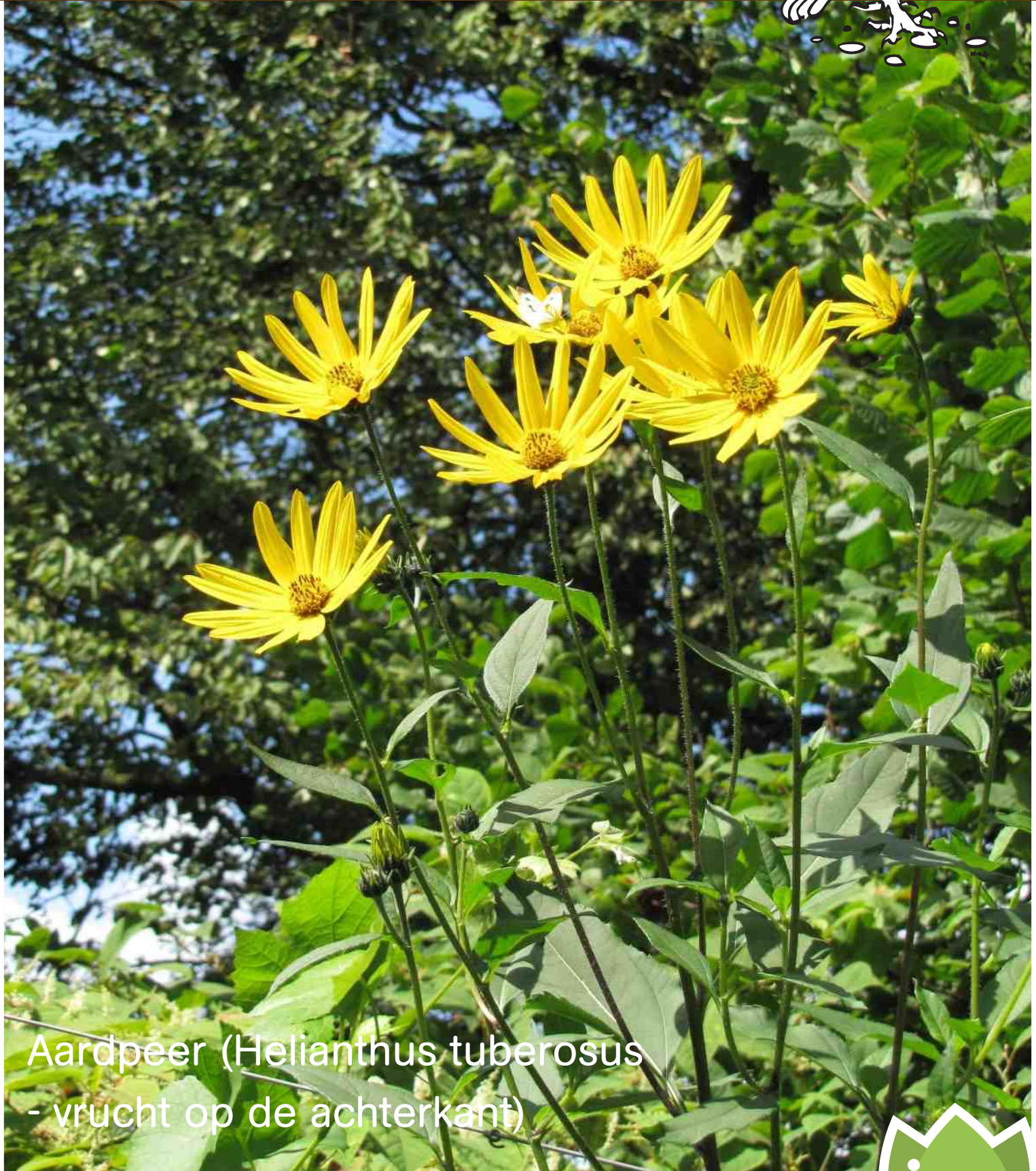
Aardpeer ( Helianthus tuberosus - vrucht op de achterkant)