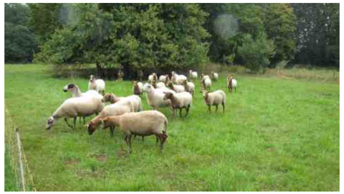
Schape aan het werk