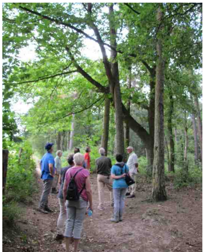
4: bomen in innige omhelzing