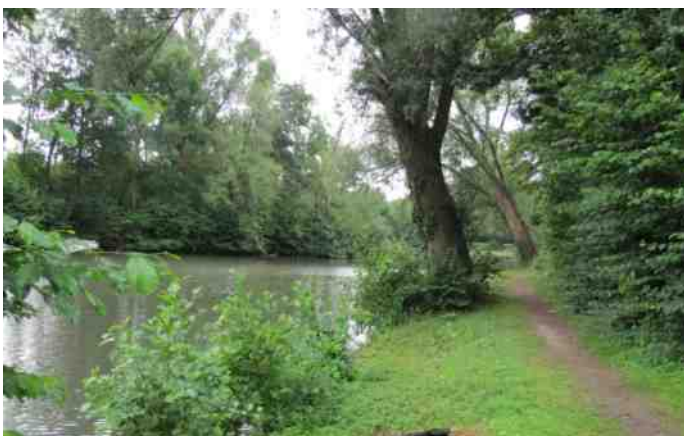
Wilgen aan de vijver; van de achterste wilg is de stam gescheurd >> waar je mooi van wordt, zeiden de mensen vroeger"