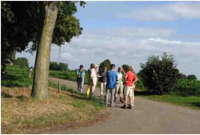
wandeling 1 juli 1-4: rand Stammenderbos