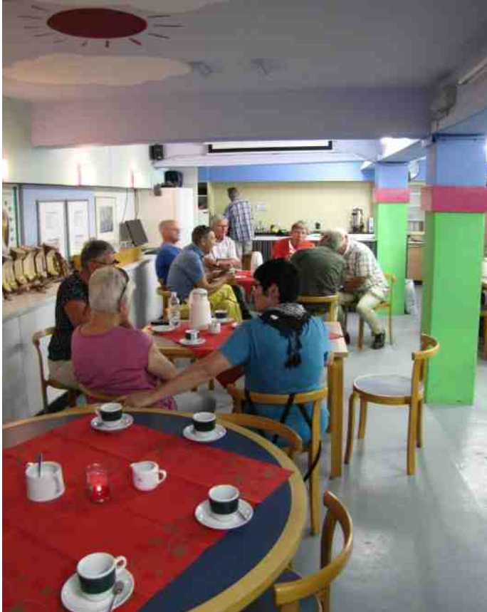
3: Koffie bij de naaste buren