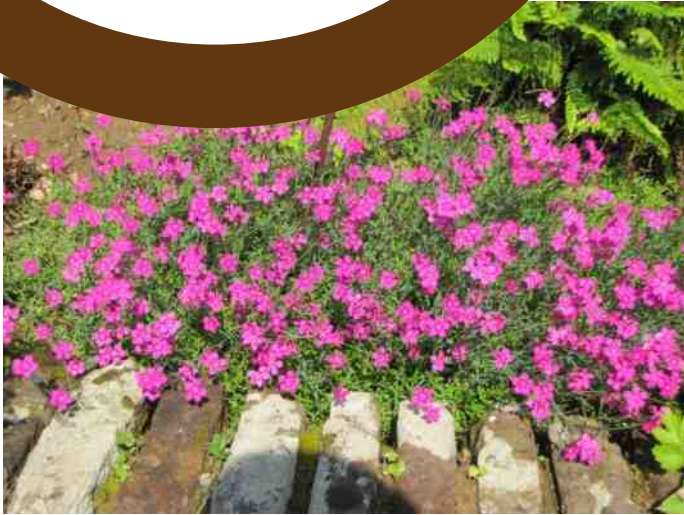
muurvegetatie en druiven (Ewa Pienkowska) in de zomer