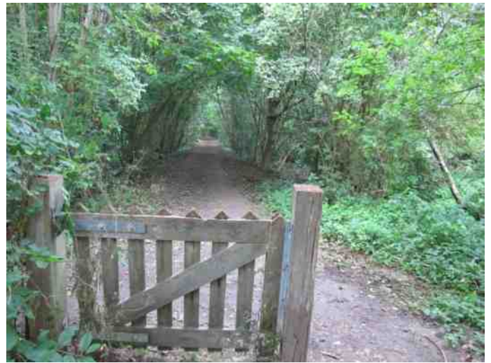
Pad langs een van de grachten