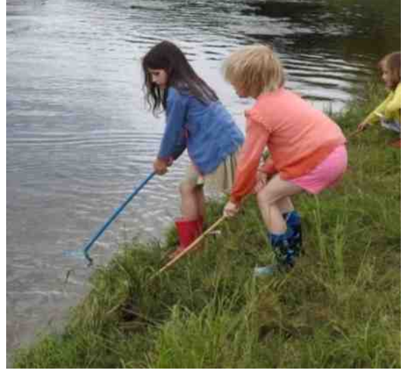
IVN Sittard-Geleen