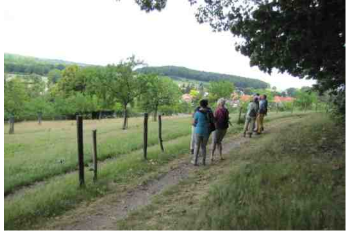
2: Sjweikeser Rëngelaote