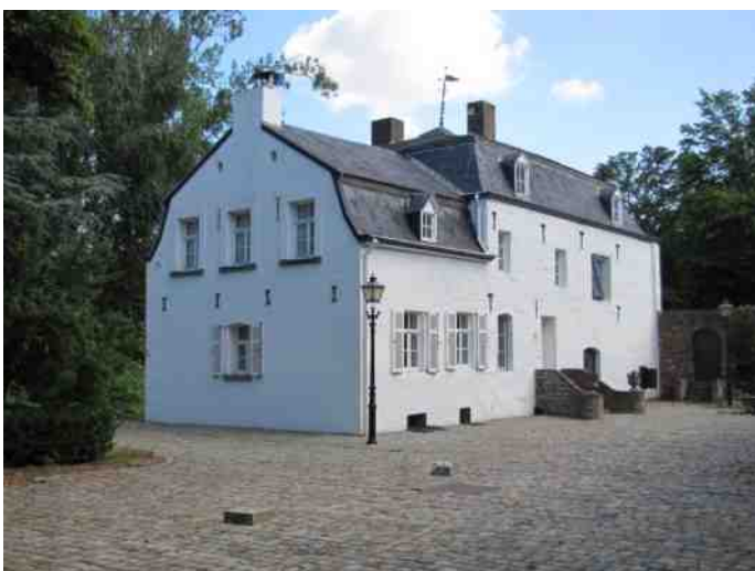
5: St. Jansmolen