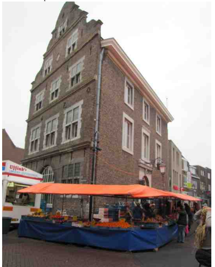
Elly Hermans groente bij het Kritraedthuis op de donderdagmarkt, Sittard