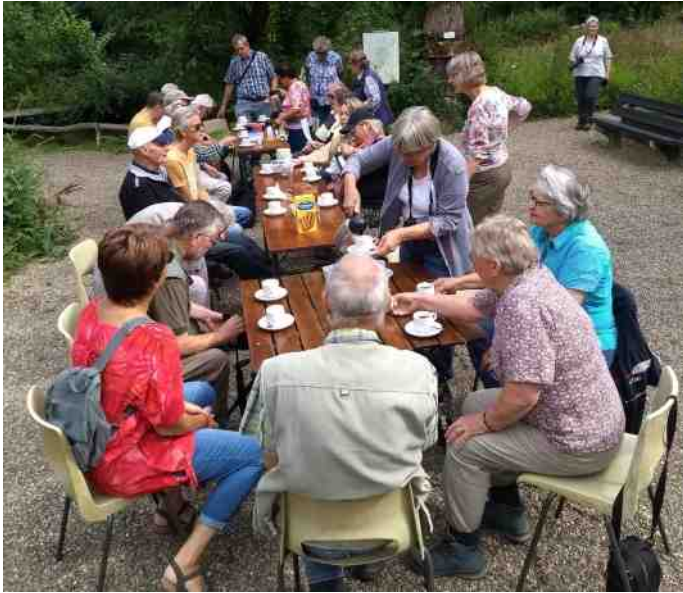
IVN Born / Land van Swentibold op bezoek