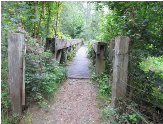
Brug die aan vervanging toe is