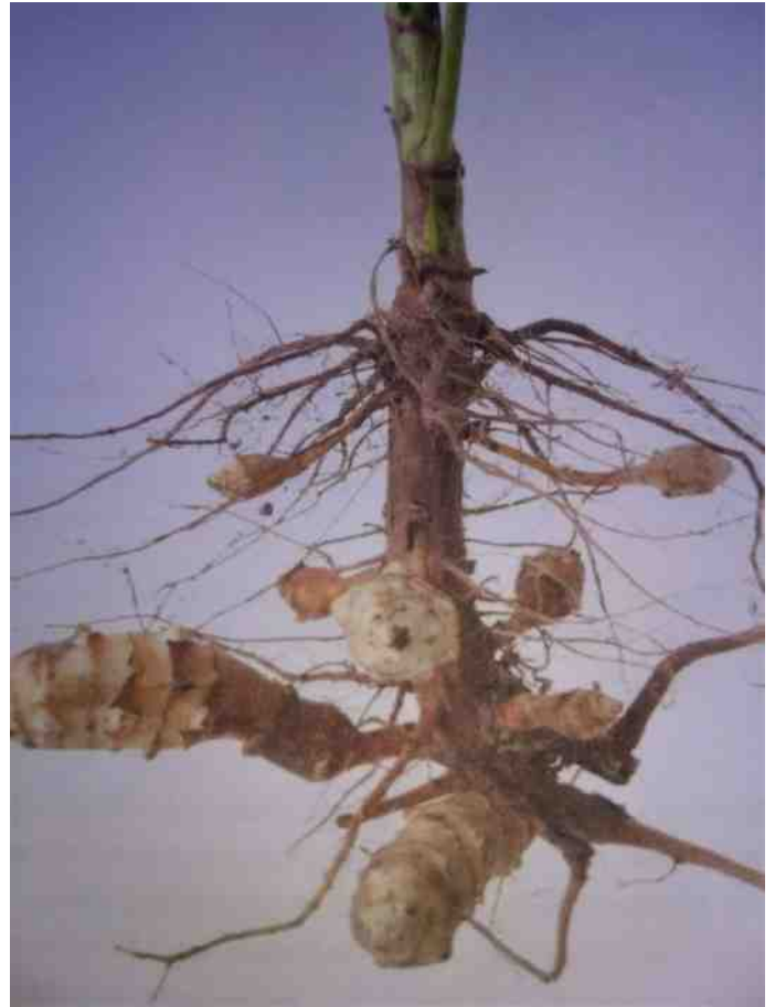
blote helianthus tuberosus (Hub Mulders)