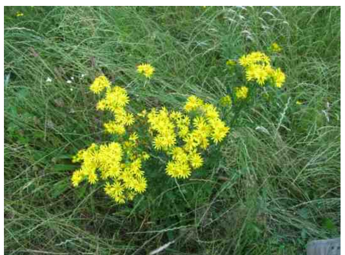
6: zomaar langs de weg