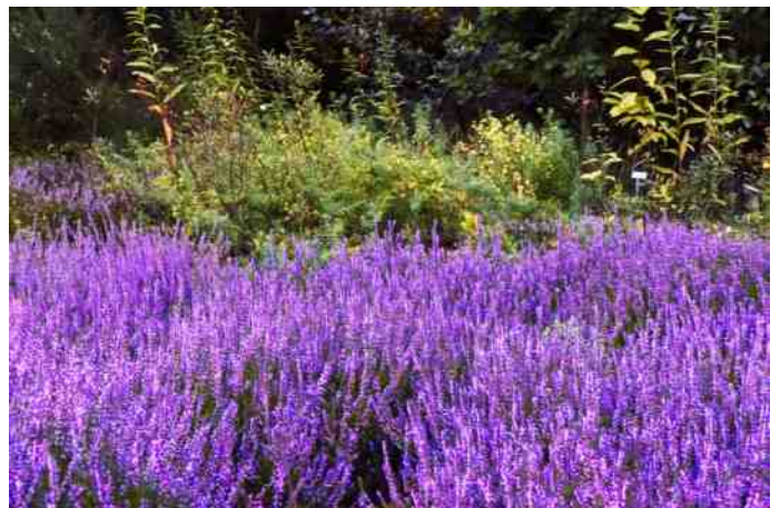
heide eind augustus