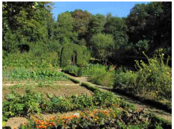
De lonicerahaagjes in de Boerengaard zijn een succes