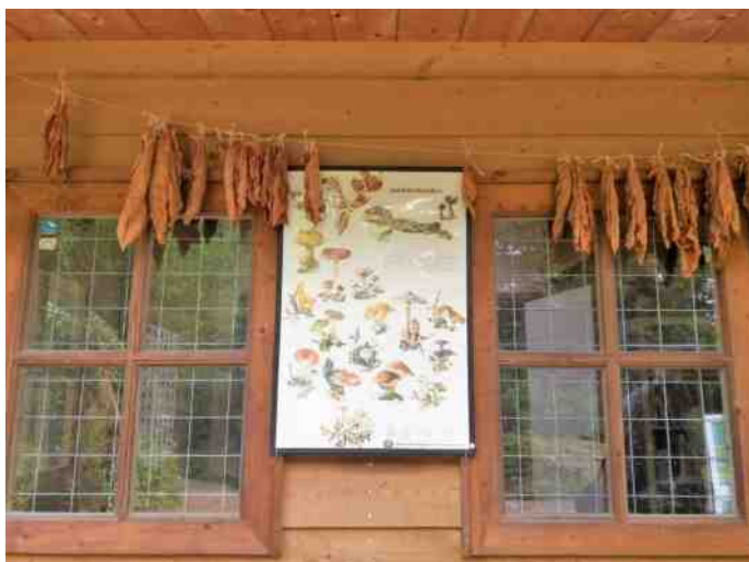
Tabaksbladeren te drogen voor sigaren uit eigen Heemtuin