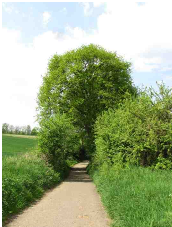
< Mäximaboom; hierboven: beeldbepalende zomereik Eekerweg

Zo stonden er langs het Heijdenpad in 2012 nog minstens 11 knotbomen, waarvan er nu slechts vier over zijn. ‘Boompje groot, plantertje dood,’ zo luidt het gezegde. Maar dat mag ons er niet van weerhouden nu bomen te planten waar onze kinds-kindskinderen in een volgende eeuw blij mee zijn. Als IVN Munstergeleen willen wij aandacht gaan besteden aan het beleid in deze van de gemeente.