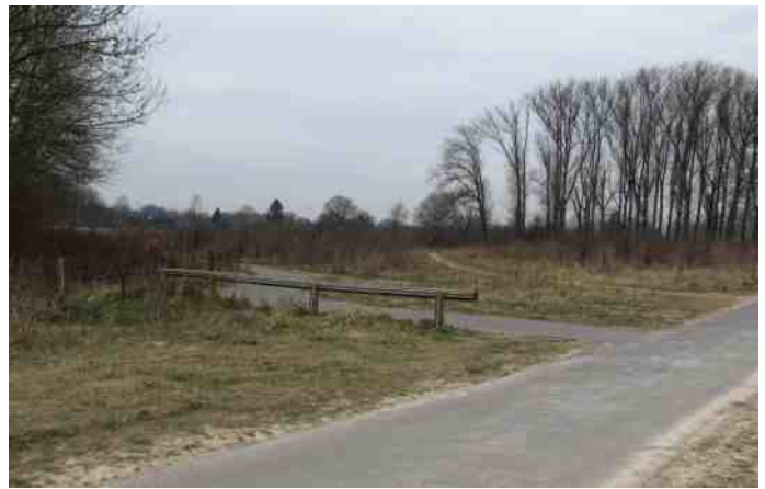
Foto hiernaast: dat de Moljeweg weer begaanbaar is is te danken aan een vroegere maatschappelijke stage

Op panelen zal verwezen worden naar andere vondsten die in en rond Munstergeleen gedaan zijn. En op strategische plaatsen zullen vitrines worden gezet waarin die vondsten naast replica's zullen worden tentoongesteld met uitleg (zie ook blz. 14).