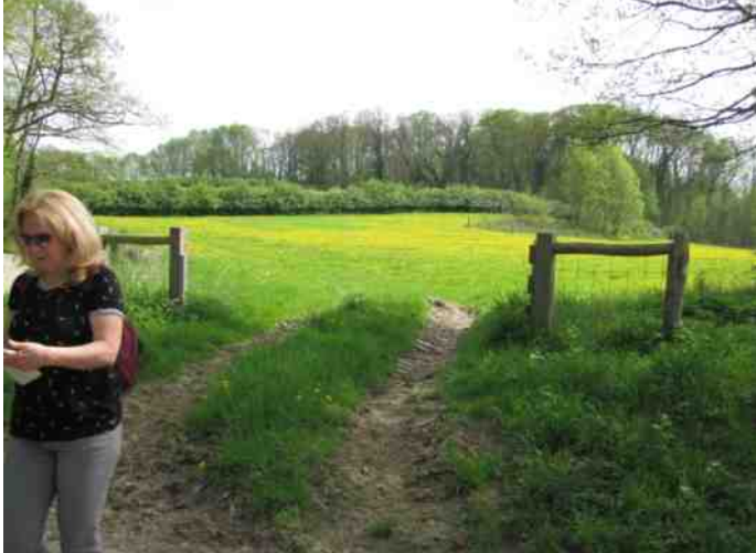
Foto boven: Groot hoefblad (dochteren voor de vader); foto daaronder: bloeiende paardenbloemen, meidoornhaag en graft in de wei op de helling van de Wanenberg