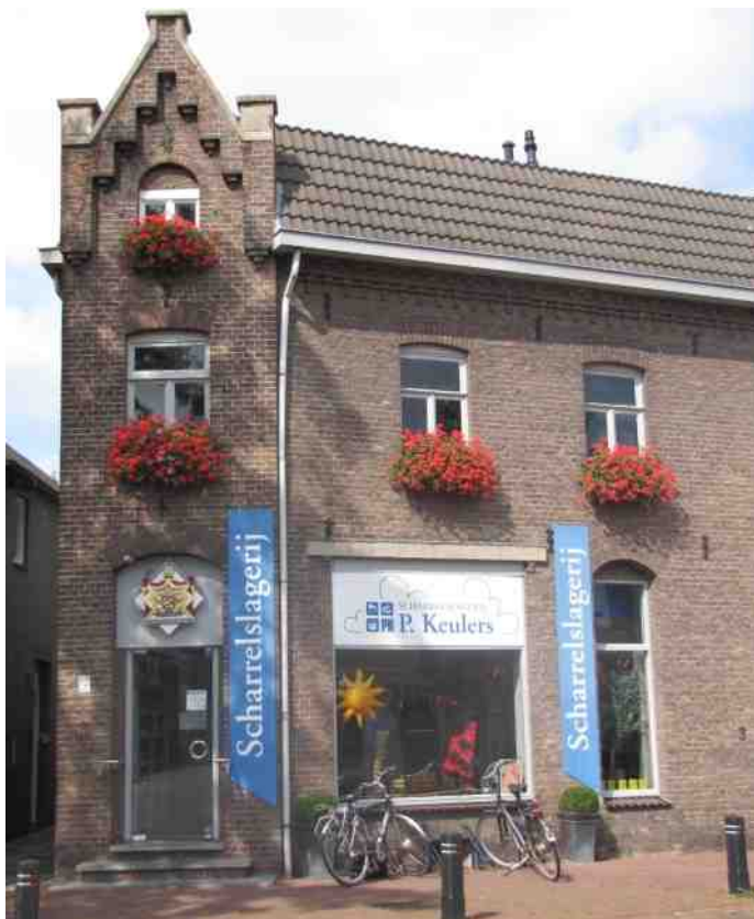
De scharrelslagerij van Munstergeleen, Houbeneindstraat 1

Wist u dat u de Heemtuin, behalve op zondagen in voorjaar en zomer, ook kunt bezoeken op zaterdag en maandagochtenden en dat u daarnaast nog voor groepen afspraken kunt maken? Mail naar Els Rongen, Rongen4@kpnplanet.nl.