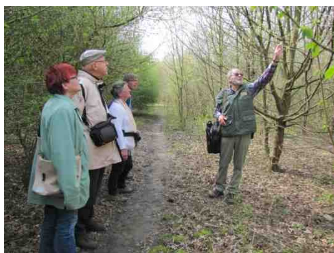
Absbroekbos 10 april