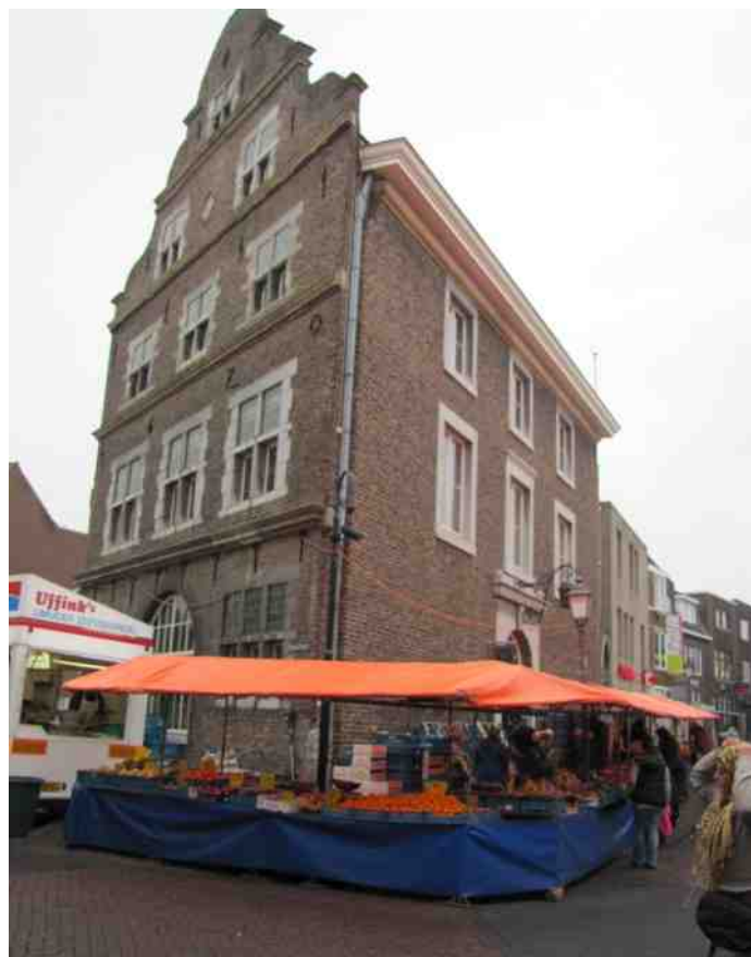
Elly Hermans groente bij het Kritraedhuis op de donderdagmarkt, Sittard