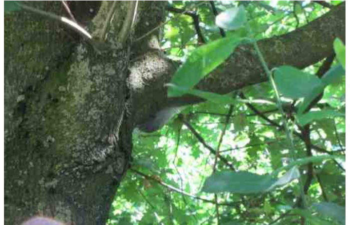
Regiowandeling 1 juli: 1. groep; 2. boomkikker op groot hoefblad; 3. zwanengezin; 4. nest eikenprocessierups