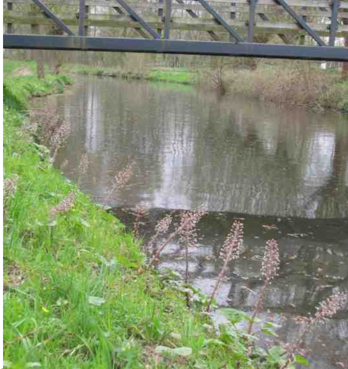
Foto 1: Absbroekbos; foto 2: Geleenbeek, Groot hoefblad (Dochters voor de vaders); foto 3: Heemtuin met bloeiende sering en kweepeer (toen mooi in bloei, nu in de herfst rijk vruchtdragend); foto 4: voorjaarswei-de (helling Wanenberg) met paardenbloemen, bloeiende meidoornhaag en graft.

Van de wandelingen die Harrij Gijsen in voorjaar en zomer heeft verzorgd is die van 10 juli uitgevallen wegens de hitte. "Genieten van de zomerbloeiers in de Heemtuin" was het motto voor die dag, maar de zomerbloeiers stonden al zo vroeg in het seizoen te verpieteren. Daarom komt het goed uit dat we in dit nummer alsnog kunnen terugblikken op de wandelingen in het voorjaar (di. 10, 5 deelnemers, & zo. 22 april, 7 personen) die niet meer in het vorige nummer konden.