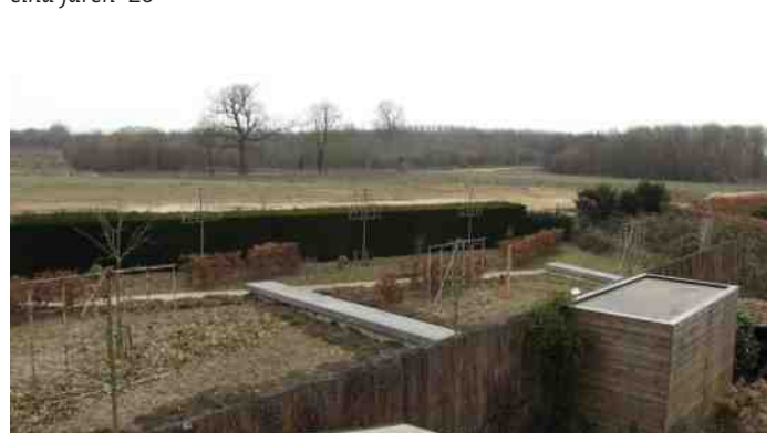
Gezicht op stiltetuin p. Karel, Veedarsweg & Lintjesweg