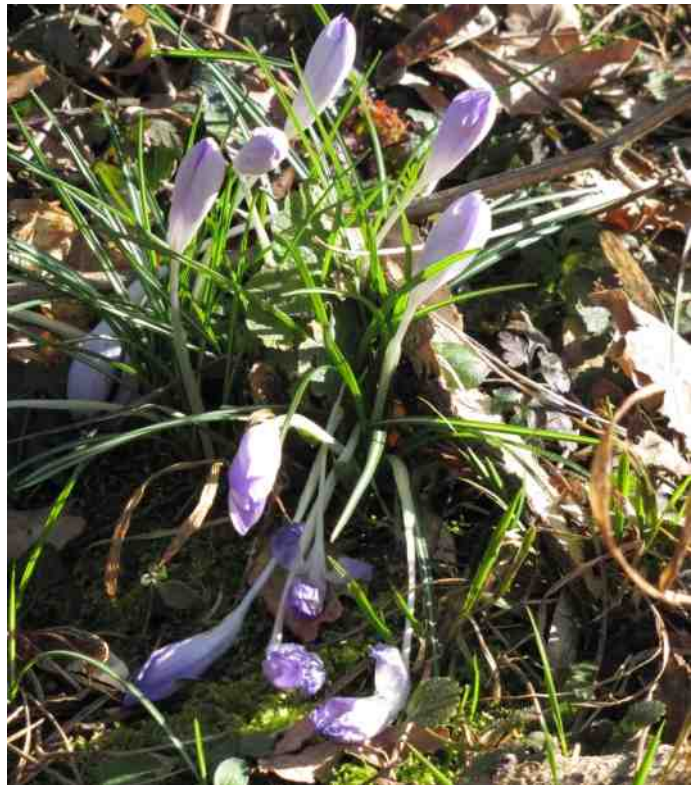
Krokussen gefopt door de winter