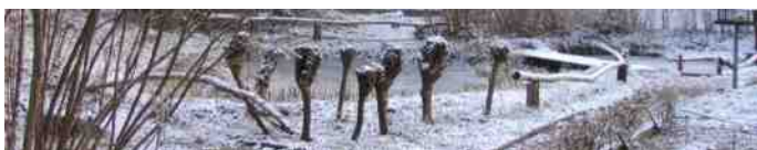
Dwergwilgjes bij de vijver

De wilgen-schors bevat salicylzuurglycosiden. Dit is een niet narcotische pijnstillert, die koortswerend, zweetbevorderend en vochtafdrijvend werkt. Tevens hebben salicylzuurglycosiden een ontstekingsremmende werking doordat zij het bacteriëevenwicht herstellen. Wilgen-schors wordt dan ook gebruikt als natuurlijk antibiotica. Het wordt in de volksgeneeskunde gebruikt tegen reuma, jicht, griep, neuralgische pijnen, bij maag-darmklachten en als ontsmettend middel bij blaasontsteking.