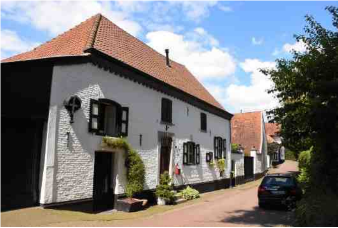
Woonhuis P.C. Houbenstraat. Midden: voordeur; links ingang oliemolen; helemaal links: (ged.) zaagmolen.