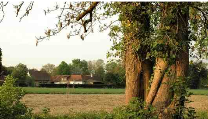
Gezicht op de molengebouwen vanaf de westoever