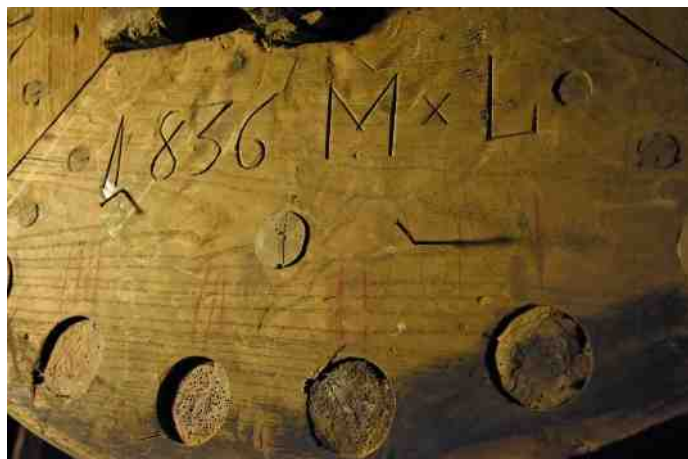
Kollergang: jaartal op wiel