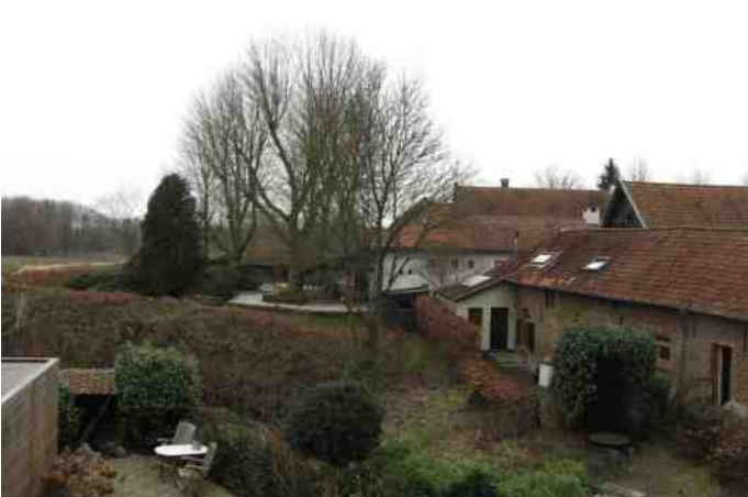
Uitkijk vanuit vakantiehuis op Pater Karelhoeve