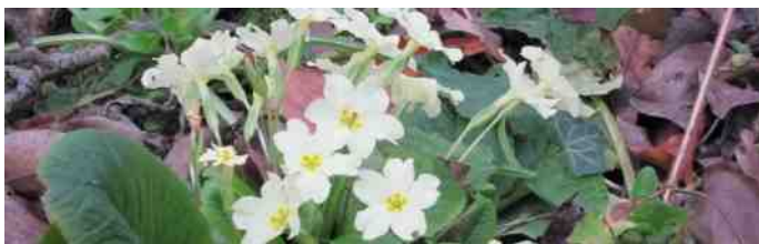
Primula vulgaris - stengelloze sleutelbloem