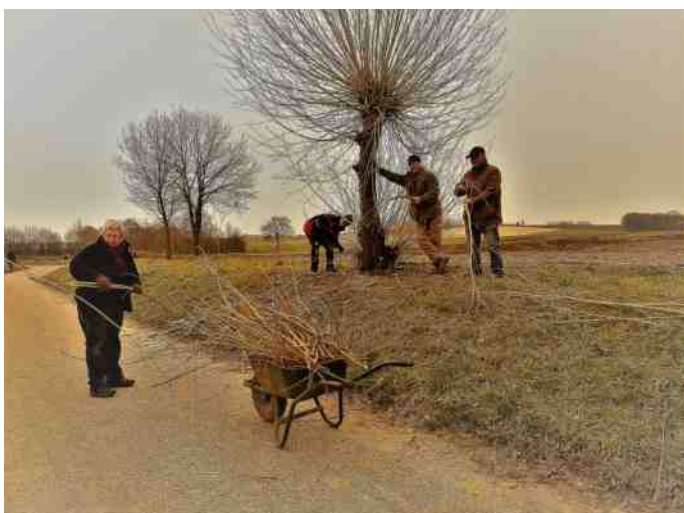
Wilgen Eekerweg, stamschot verwijderen 19 februari