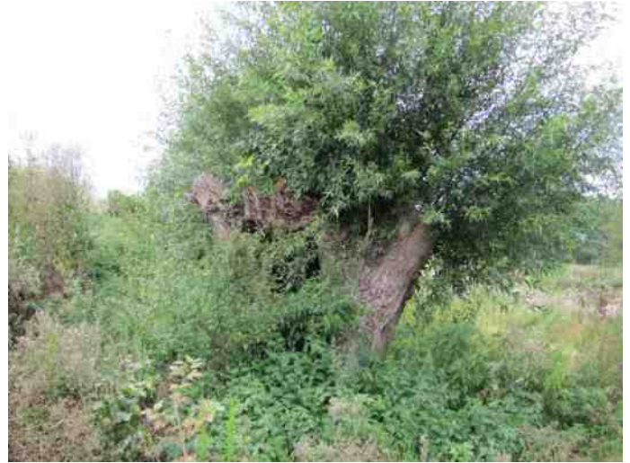
Wilgen langs het Glanapad