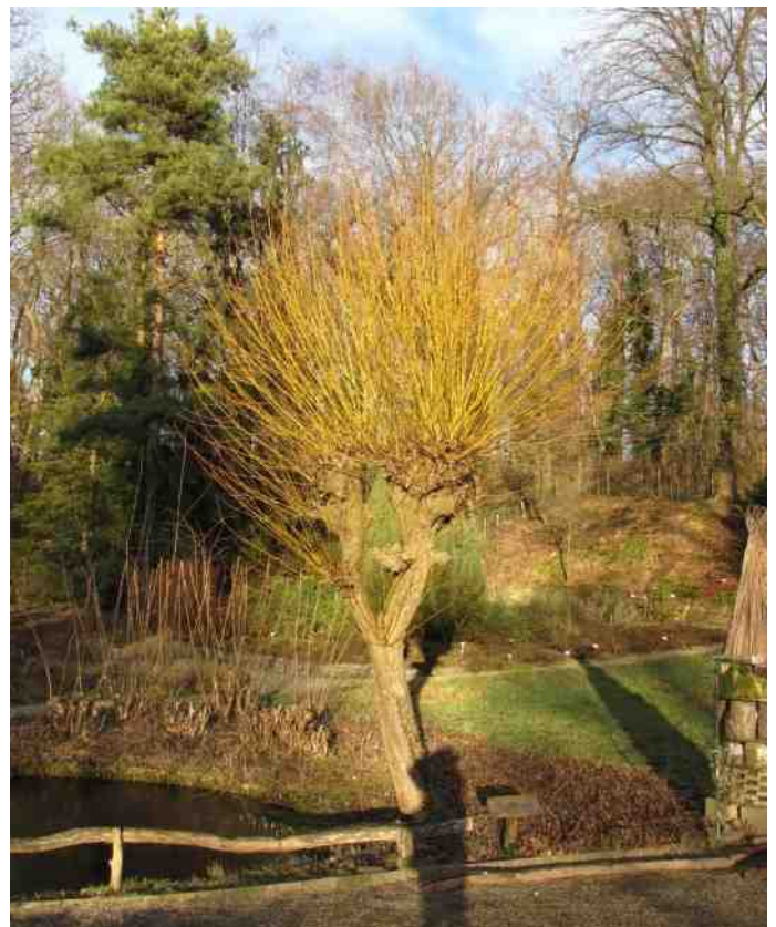
wilg bij de vijver - winterbeeld (niet de afgelopen maar een vorige winter)

In de oudheid plantte men Wilgen bij voorkeur in de nabijheid van wijngaarden. De buigzame takken gebruikte men dan voor het opbinden van de Wijnranken.