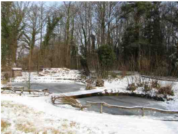
3 maart 2018