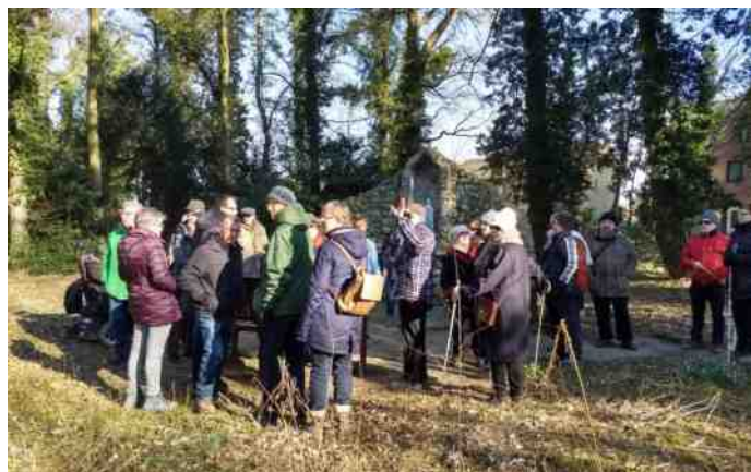
Bij de Mariagrot, tuin Abshoven