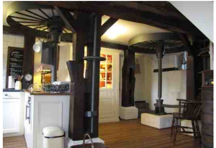
Keuken met gietijzeren molenwielen aangedreven door de turbine van eind jaren '20