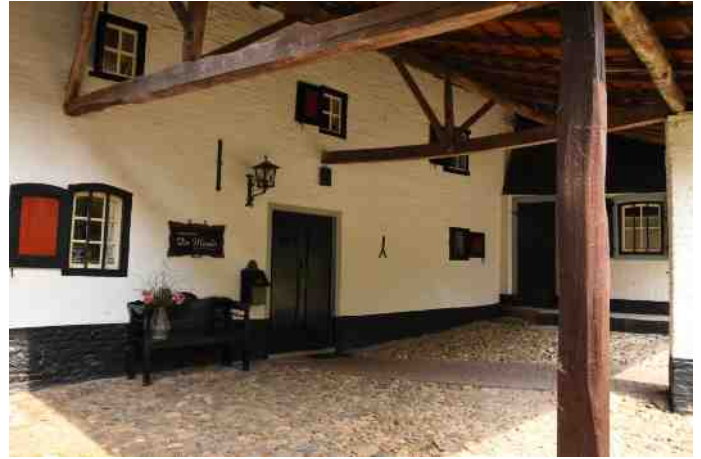
De Meule, entree (via bruggetje pater Karel)