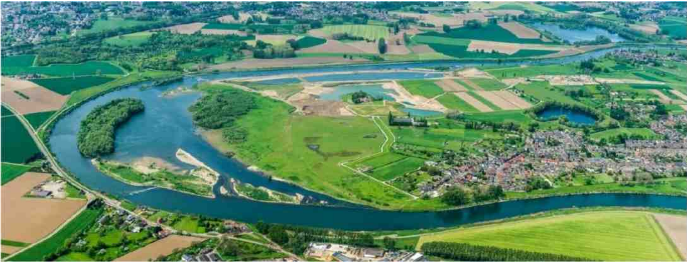
Werk in uitvoering