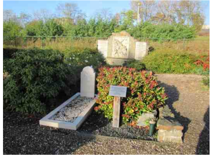
75 jaar geleden ...