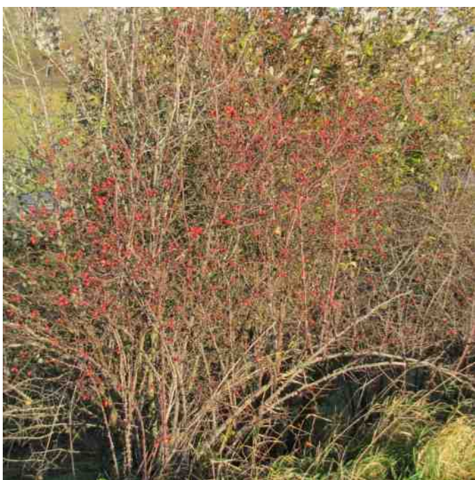
Rozebottels bij de vleet!

Van de boomsoort waren tot 1944 alleen fossielen bekend. In dat jaar werden zaden gevonden in China die in Amerika tot ontkieming werden gebracht. Als we in aanmerking nemen dat een jonge boom twintig jaar oud moeten zijn om nieuwe zaden voort te brengen, zouden deze bomen wel eens kunnen zijn voortgekomen uit de eerste zaden van die in Amerika gekweekte metasequoia 's.