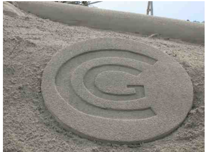
zandsculptuur 9 september, open dag consortium Grensmaas