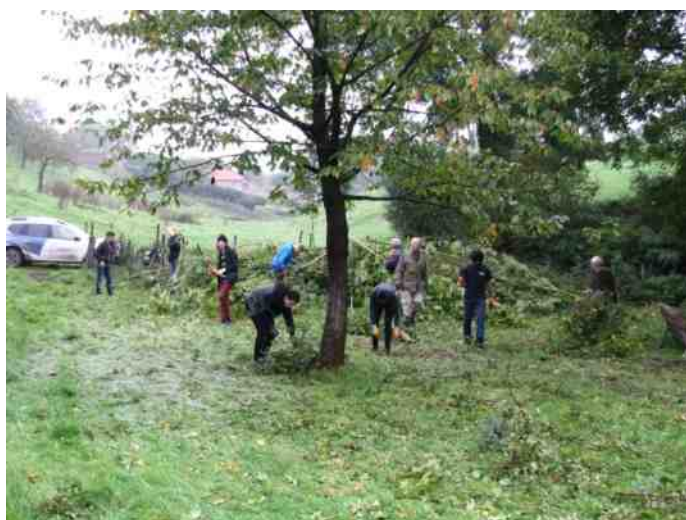
Werk in uitvoering

De vijfde dag gingen we naar school om het boekje