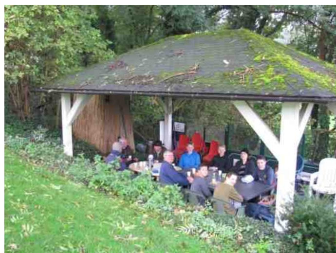
Koffie Wijngoed Wanenberg