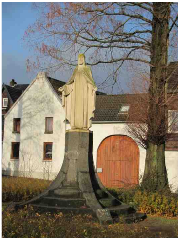
Heilig Hartbeeld Spoorstraat.