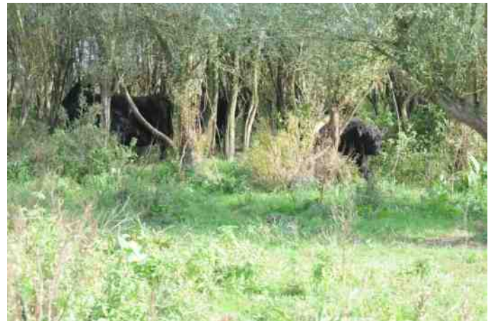
Lopen daar olifanten bij Meers?

Vervolgens een lekkere wandeling door het gebied (dat bij extreem hoog water als buffer dient) tot aan de plek waar nog volop gewerkt wordt aan de uitvoering van de plannen. Hier werd duidelijk hoeveel grond en grind er verplaatst was en hoeveel er nog verplaatst moet worden. Via verschillende weilanden kwamen we bij een monument bestaande uit cirkelvormig geplaatste dode bomen. Hier werd de excursie afgesloten. Maar aansluitend werd er op het terras van het nabij gelegen café nog lekker nagenoten.