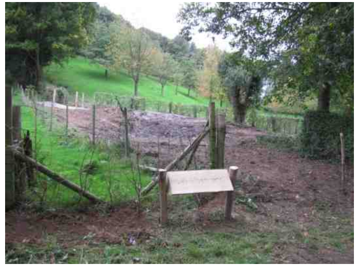
Resultaat: een opgeschoonde poel

en het verslag te maken maar helaas was er geen lokaal of plek voor ons gereserveerd dus liep het een beetje scheef.