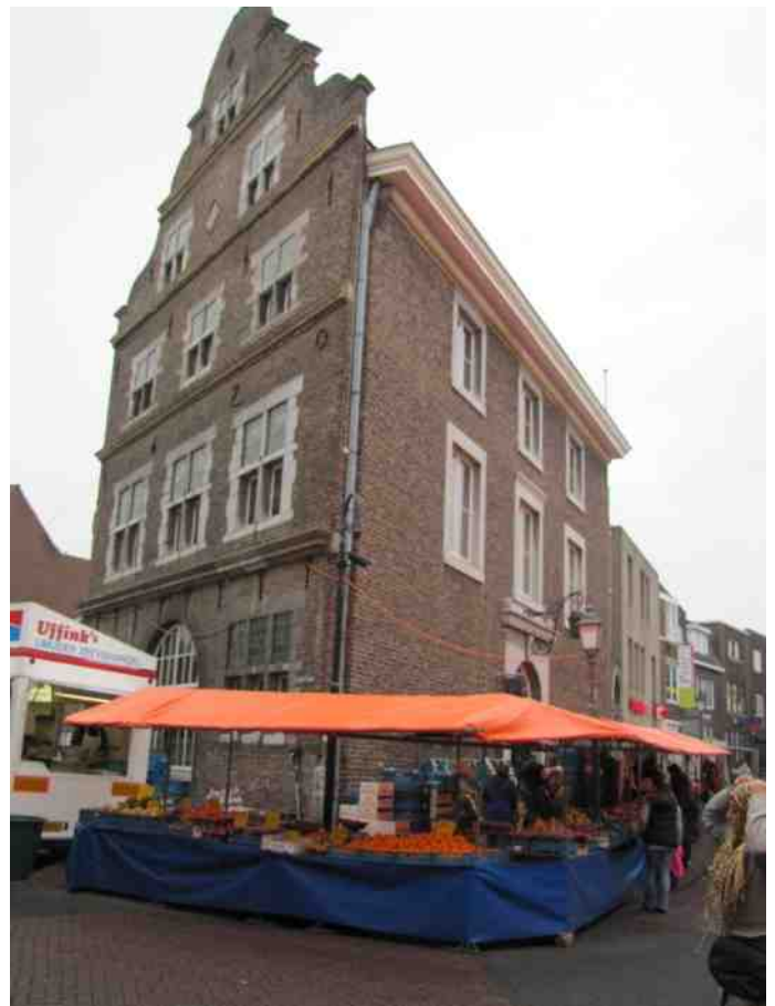
Elly Hermans groente bij het Kritraedhuis op de donderdagmarkt, Sittard