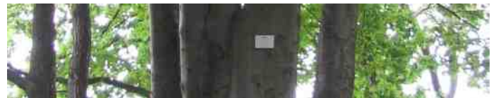
Soms zie je een plaatje met boomsoort en plantjaar erop