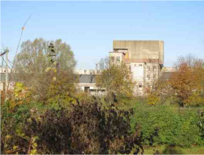
Vermoedelijke overwinteringsplaats vleermuizen