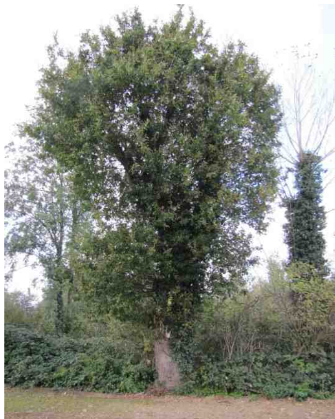
Monumentale boom met lintje Beekdalstraat

Tweemaal per jaar houdt IVN-District Limburg een districtsledenvergadering, eenmaal, in de lente, in Roermond, andermaal bij een van de afdelingen, deze keer dus in Munstergeleen. In de middag was er een excursie langs de aanpalende vernieuwde Geleenbeek.