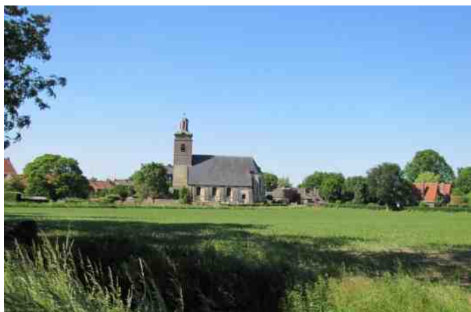
De Paererbös vanuit België