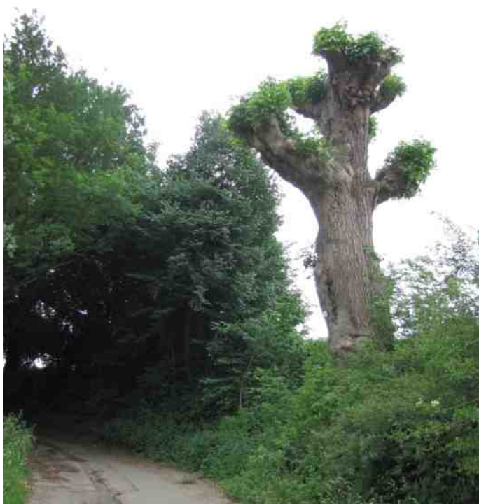
Monumentale Knot-es Steingraafpad

Indien dit jaar de nesten niet worden bezet ben ik voornemens volgend voorjaar de zwaluwen middels lokgeluiden in de zwaluwtil te lokken.