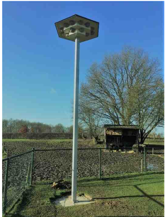
De zwaluwtil in de tuin van de familie Habets aan de Oppevennerweg in Oirsbeek

Paul Habets laat (per mail 7 juni 2017) aantekenen: Helaas zijn de nesten deze zomer nog niet bezet. Het valt ons op dat we dit jaar sowieso bijzonder weinig zwaluwen zien.