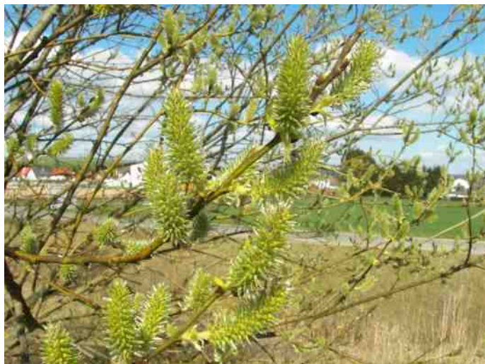
Boswilg, vrouwelijk - Willow - Attribution ShareAlike 2.5

Sommige planten rekenen voor hun bestuiving op de hulp van de wind. Zij laten veel aan het toeval over en er moeten enorme hoeveelheden stuifmeel beschikbaar zijn. Dit is een belastende periode voor mensen die last hebben van allergieën. Windbestuivers zijn doorgaans ook niet erg aantrekkelijk voor de bijen. De bij vliegt op warme dagen in februari - maart naar de katjes van de hazelaar en boswilg, maar het feit dat ze stuifmeel meeneemt levert die planten geen enkel voordeel op. De hazelaar en boswilg combineren namelijk geen mannelijke en vrouwelijke elementen in één bloem. De vrouwelijke bloemen groeien afzonderlijk van de mannelijke katjes. De vrouwelijke bloemen slaan de bijen over omdat ze niets te bieden hebben.