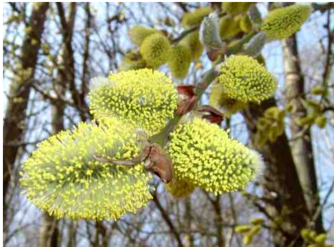
Boswilg, mannelijk

Windbestuivers hebben doorgaans geen aantrekkelijke bloemen. Maar toch, wat is schoonheid? De bloeiwijze van een brandnetel en de onaantrekkelijke bloeiaren van de gewone weegbree hebben hun charme. Niet iedereen begrijpt, dat de vorm, kleur en reuk van bloemen geen geschenk van de natuur voor mensen is. De listige tekeningen en bedwelmende geuren lokken insecten. Ze vliegen van plant tot plant en verspreiden de stuifmeelkorrels waardoor ze, zonder het te beseffen, de kruisbestuiving hebben volbracht die voor die planten van belang is. Planten die afhankelijk zijn van insecten voor een geslaagde vereniging van hun geslachtscellen, produceren niet zo overvloedig stuifmeel als de soorten die op de wind vertrouwen. Hun stuifmeelkorrels zijn vaak een beetje kleverig of hebben een ruw oppervlak, zodat ze aan de poten van bezoekende insecten blijven hangen of zich als klitten hechten aan de haren, waarmee hun gasten bekleed zijn. Insecten eten graag stuifmeelkorrels. Ze zijn rijk aan eiwit. De planten leveren veel meer dan ze werkelijk nodig hebben.