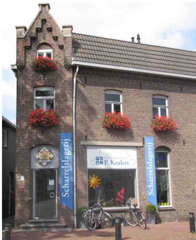
De scharreislagerij van Munstergeleen, Houbeneindstraat 1