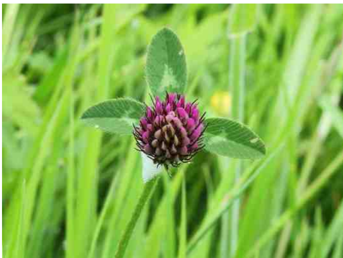
Rode klaver

Het harde werk van de vrijwilligers in de heemtuin is te prijzen. Blijf echter bedenken dat de duizenden nietige bijtjes er elke dag werken. Ze hebben geen beheerders en bestuurders, ze vergaderen niet, hebben geen schema's, werken zelfs 's nachts en staan niet te wachten op een bedankje. Voorzichtig doen we dat toch: dank jullie wel!