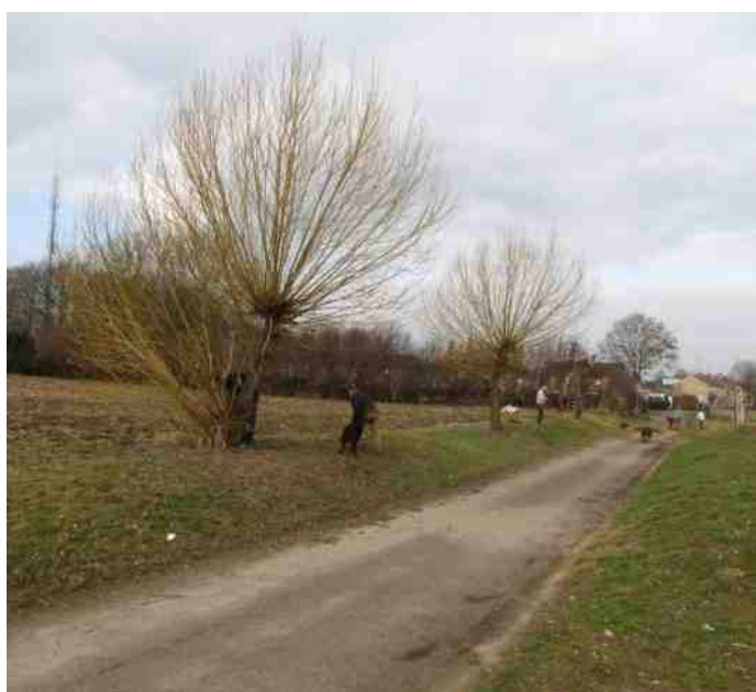
Eekerweg vóór het knotten

Halverwege februari hebben wij de wilgen aan de Eekerweg geknot. Het mes sneed aan twee (als dat mogelijk zou zijn zelfs aan drie) kanten: de wilgen zien er weer geknipt uit, een extra vrijwilliger, docent op de Parkschool, kon een wilgentunnel gaan bouwen voor zijn nog niet jarig geweest zijnde dochter en wij konden de stevigere houtdelen gebruiken voor het knuppelraster in de Boerengaard zoals u hierboven kunt zien.