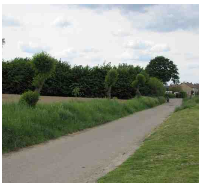
Eekerweg in het voorjaar