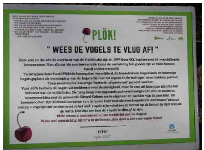
Onthuld bij de kersenwei 26 - 03 - 2017