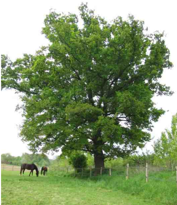
Deze zomereik, zichtbaar vanaf het Glanapad heeft op 1.20 hoogte (vanaf de draad) een omtrek van 356 cm. Waarschijnlijk heeft hij de grootste stamomvang van de zomereiken in de gemeente.