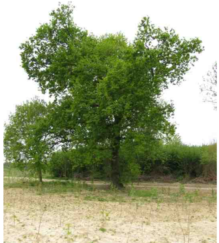
Zomereik aan de (gereconstrueerde) Veedarsweg (meer foto's onderaan volgende bladzijde)