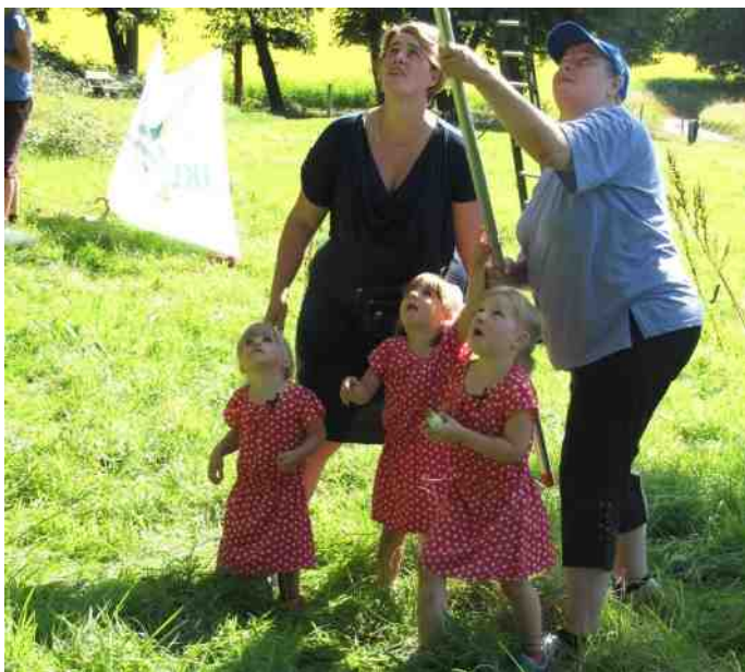
Plök!: Peren plukken 10-09-2016