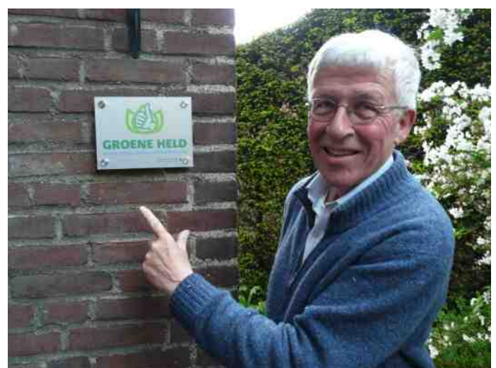
Enkelvoud = meervoud!