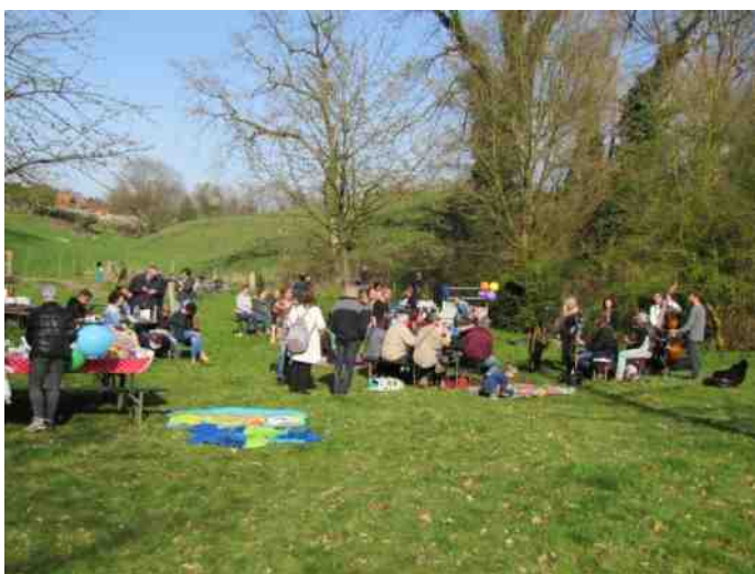
Gezellige drukte in de kersenwei 26-03-2017