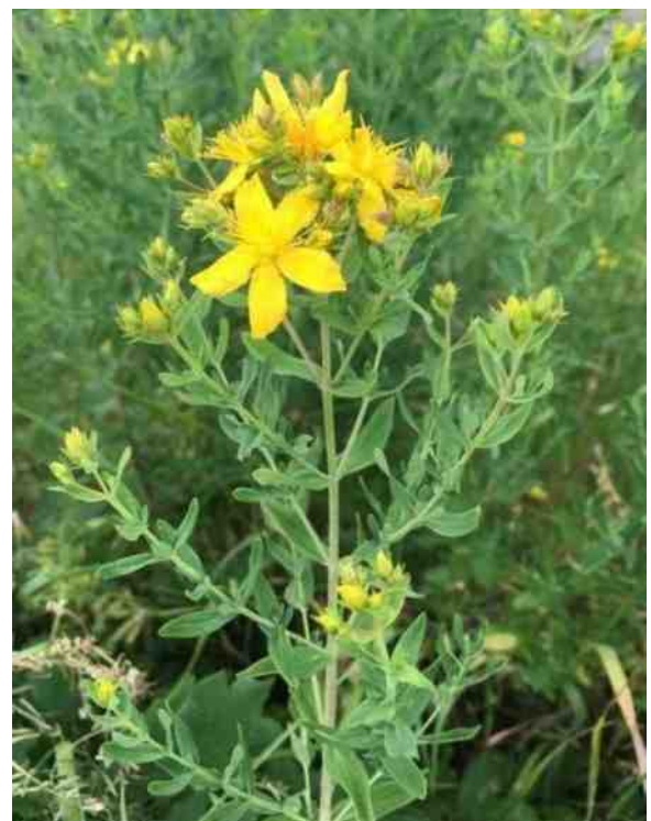
Bloeiend St. Janskruid

Mocht u rond Midzomer een wandeling maken om te genieten van de uitbundige vegetatie, kijk dan eens of u het Sint-Janskruid kunt ontdekken. U bent uiteraard zeer welkom om op zondagen de Heemtuin te bezoeken. Hier kunt u naast het Sint-Janskruid nog vele andere bijzondere planten zien.