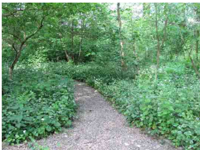
Daslook op zijn hoogtepunt in april/mei