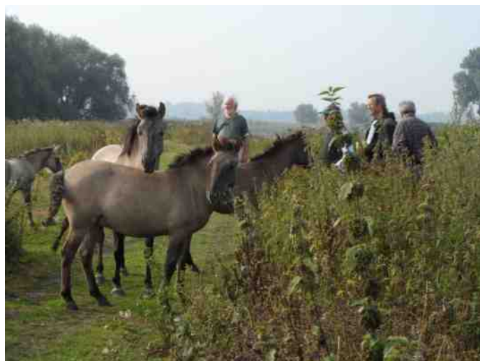
Ontmoeting met konikspaarden in de Elba

Begeleiding: Birgitta Warps-van Geel, Lex Vlieks (046-4511554)