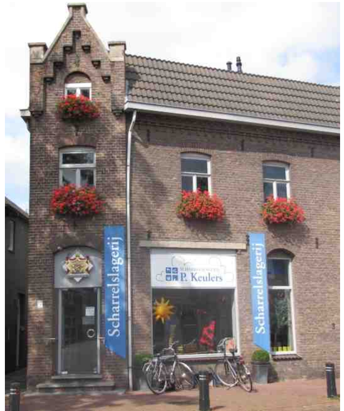
De scharrelslagerij van Munstergeleen, Houbeneindstraat 1

Later werden ook triomferende veldheren en dichters (die eveneens onder de hoede van Apollo staan) ‘gelauwerd’.