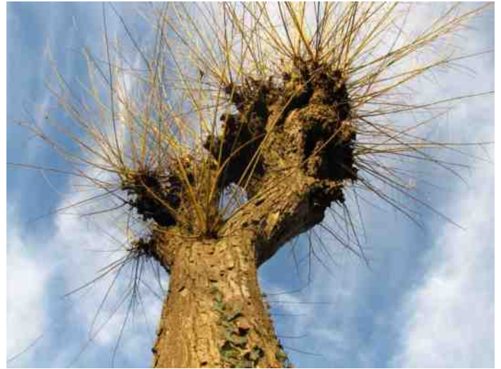
Hiernaast: Acacia 2 valt op za. 25 februari 2017 Hieronder: Jo Douven splitst een acaciastam