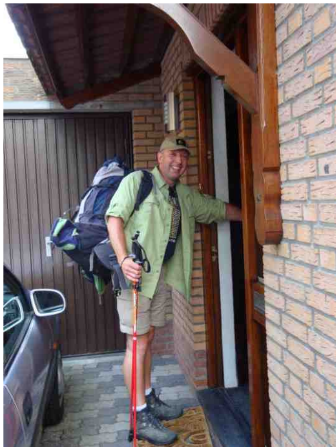
Wat denkt u, vertrekt hij of komt hij aan?