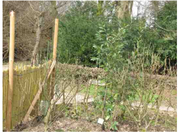
De laurierstruik in de Boerengaard - Inks het knuppelraaster