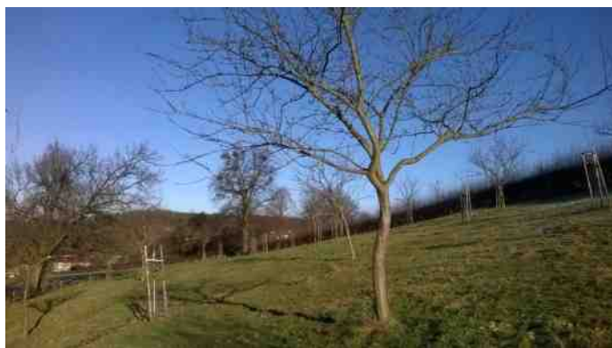
Sjweikeser Rèngelaot

In de regio zijn een aantal verenigingen actief die zich inzetten voor het behoud van oude fruitrassen. Zeer bijzonder in dit verband is de Stichting Sjweikeser Rèngelaot (SSR) omdat zij zich inzet voor slechts één soort: nl. de gelijknamige pruimensoort die zo goed als verdwenen was. In verband met de herinrichting en het herstel van het Geleenbeekdal heeft Natuurmonumenten aangrenzende gronden aangekocht. De hellingen rondom Sweikhuizen behoren hiertoe. In de afgelopen jaren zijn de weilanden vanaf Sint Jans Geleen tot aan de dorpskern beplant met enkele honderden authentieke bomen. De stichting en haar vrijwilligers beheren de boomgaarden. De beplanting zal toenemen naargelanger nieuwe gronden beschikbaar komen waarmee uiteindelijk een aantal van ongeveer 800 bomen van de Sjweikeser Rèngelaot zal worden bereikt.