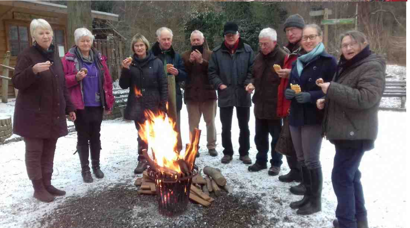
Nieuwjaarsborrel zaterdag 7 januari