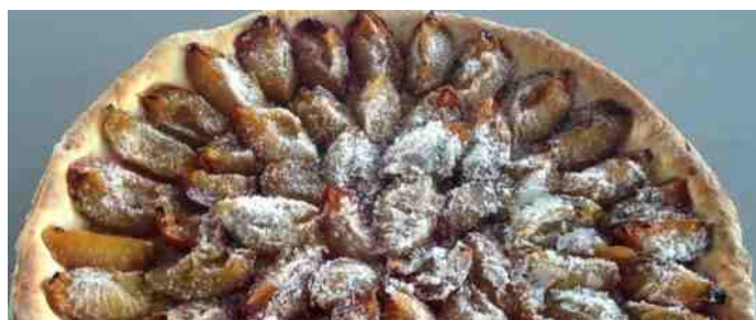
Een halve proemevlaai

Sweikhuizen ligt midden in Landschapspark de Graven: een natuurgebied van circa 5.700 ha groot, dat zich uitstrekt van Sittard tot Schinnen. Uniek is de grote diversiteit van landschapstypen: plateaus, hellingen, graften, struwelen, beekdalen en lössgronden.. Het 'Ommetje Sweikhuizen' is een uitgelezen mogelijkheid om het idyllische dorp en zijn boomgaarden te verkennen.