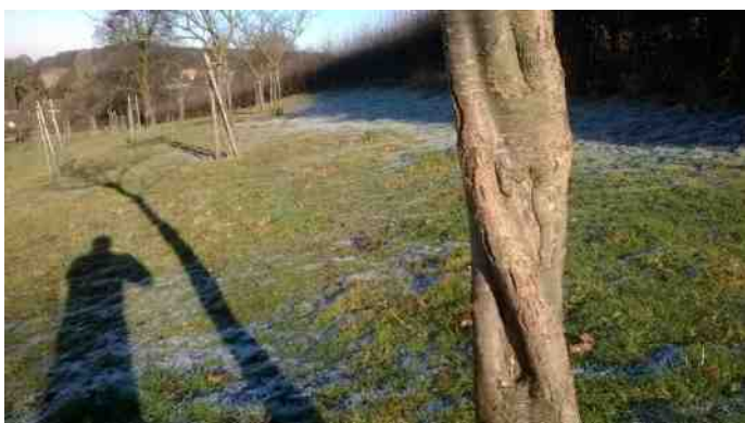
Gedraaide stam

Deze vorm van vermeerdering (vegetatief) is voor de boomkwekerij van groot belang omdat de eigenschappen van de moederboom behouden blijven en een uniforme nateelt verkregen wordt. De nakomelingen zijn genetisch voor 100% gelijk aan de moederplant. De moderne kwekerij gebruikt de wortelstek bv. voor de vermeerdering van o.a. bessen en kiwi's.