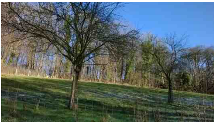
Pruimenbomen met wortelopslag