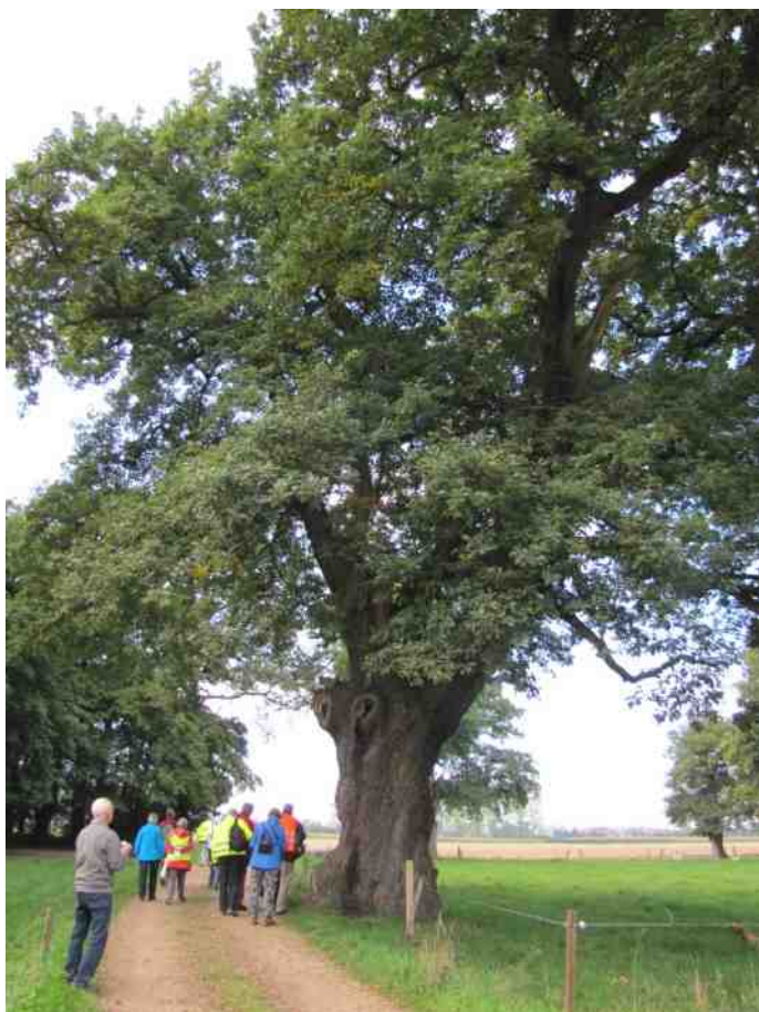
Zeldzame bastaardeik (zomer- + wintereik in één)