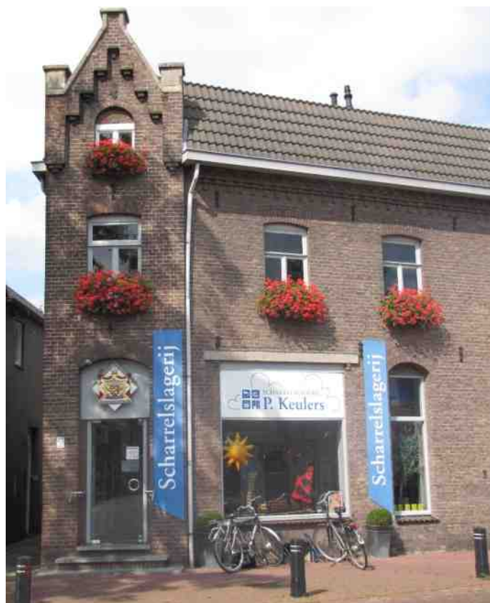
De scharrelslagerij van Munstergeleen, Houbeneindstraat 1