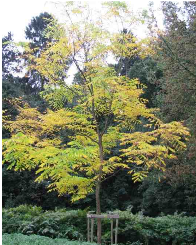
De doodsbeenderenboom dankt zijn naam aan de valse lijkkleur van zijn twijgen in de winter en de stelen van de bladeren met knekelvormige voet. Maar hier vertoont hij zich in zijn fraaie herfstkleuren

de steenkoolmijn van Eisden, in het begin van de twintigste eeuw het kasteel kon overnemen en inrichten als ziekenhuis (sinds de jaren '80 is het ook alweer bejaardenhuis geweest).