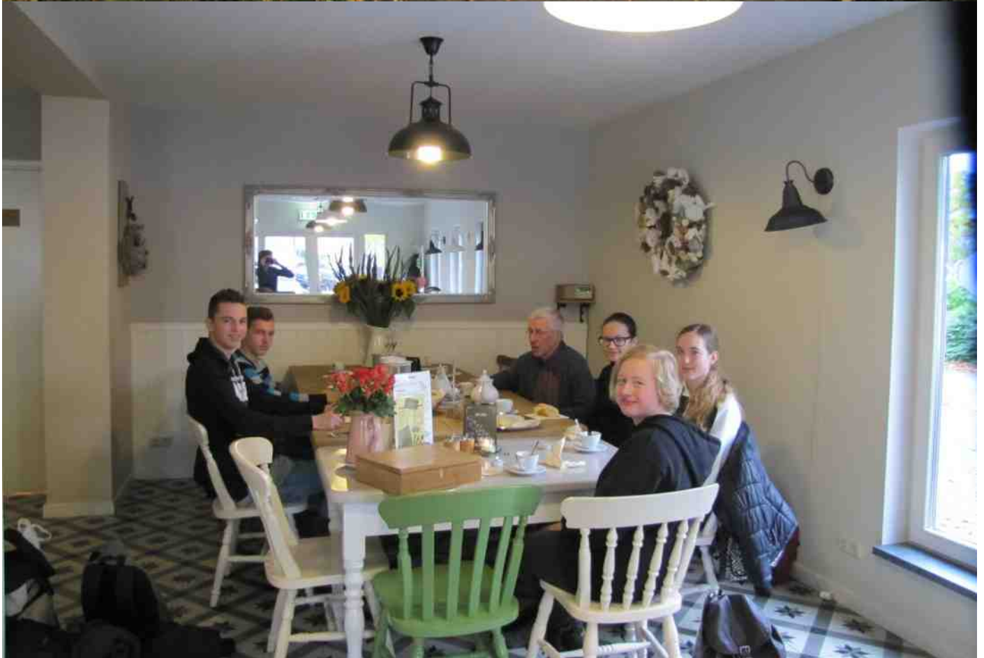
Lunch bij Jots ter afsluiting van vier dagen maatschappelijke stage in het Absbroekbos