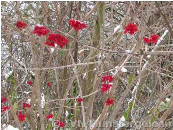
Spoedig na de eerste sneeuw in december 2010 waren de bessen van de Gelderse roos in de Heemtuin door de vogels opgegeten

- Mooie kerstversiering kun je gewoon in je eigen tuin vinden. Denk aan klimop, conifeer of rozenbottel. Haal mooie besdragende takken naar binnen voordat de vogels zich aan de bessen tegoed doen.