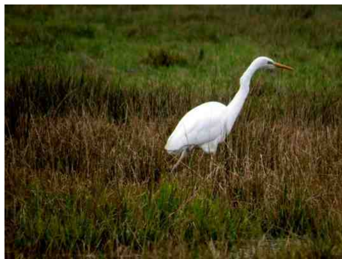
De zilverreiger: een vaste wintergast?

De ganzen jagen door het lopen in het weiland de muizen op dus is er voor de reiger volop voedsel. Al zijn het moerasvogels, ze zullen net als de blauwe reiger gaan wennen aan de mens en zullen zich meer gaan aanpassen en oprukken naar het stedelijk gebied.