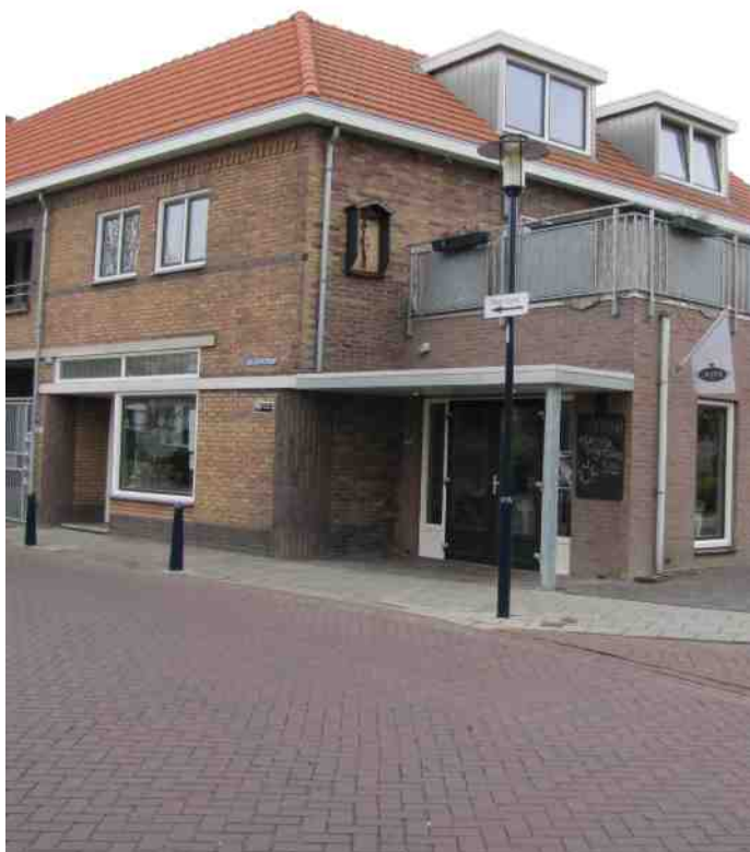
Lunchcafé Jots ook voor broodjes en koffie; Geleenstraat 2

De volgende IVN Ledendag is op zaterdag 16 april. Met 's ochtends een mooi programma in de Stadsgehoorzaal. En 's middags workshops en excursies in Leiden, onder andere naar de Hortus en Museum Naturalis.