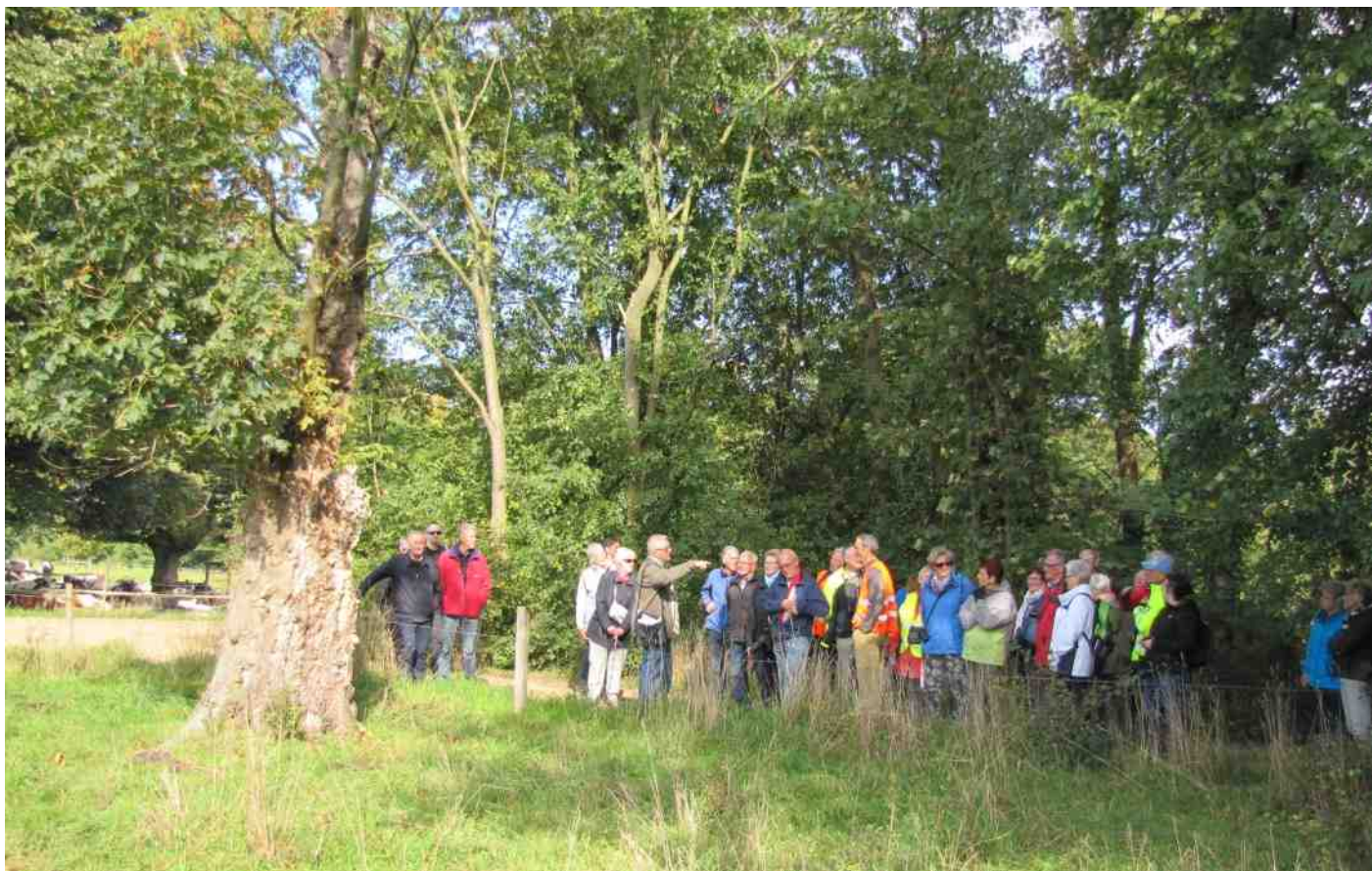
Bij het restant van een rode paardekastanje