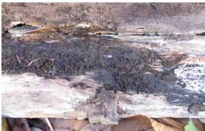
Pissebedden huizen graag onder de schors van dood hout

Voor verdere ontwikkelingen in deze kunt u de website www.ivn.nl/afdeling/munstergeleen raadplegen. U kunt zich opgeven voor de klus via www.nl doet.nl .