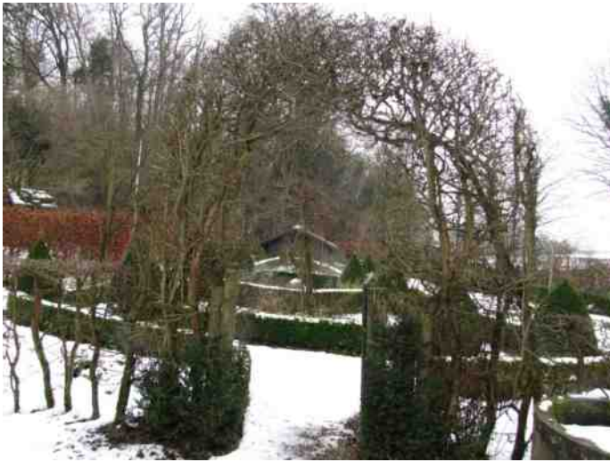
Ook in de winter loont een bezoek aan de Heemtuin de moeite (altijd open op zaterdagochtend - maak op andere dagen een afspraak)