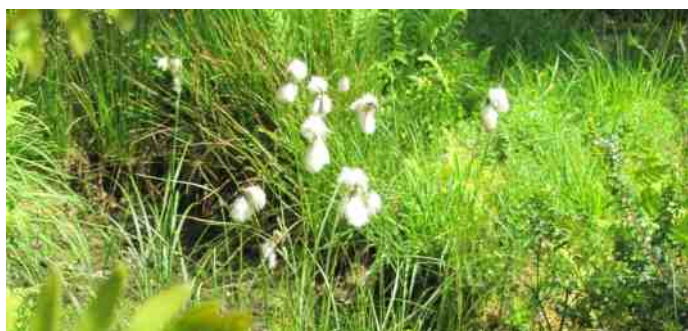
Veenpluis in de Heemtuin

Wo 17 juni: Natuur-cultuurwandeling, IVN Stein Vr 19 juni: Vuurvliegjes excursie, IVN Spau-Beek Di 23 juni: Natuurvriendelijk tuinieren les 4, IVN Stein Di 23 Juni: Avondwandeling Wolfhagen/Oirsbeek, IVN Schinnen Zo 28 juni: Regiowandeling Monumentale bomen in het Kasteelpark Amstenrade, IVN Schinnen en IVN Spau-Beek Wo 1 juli: Avondwandeling, IVN Stein Vr 3 juli: Het Vliegend hert rond Jabeek, IVN Land van Swentibold Zo 5 juli: Inloopzondag, IVN Stein Zo 12 juli: Dag wandeling in de Eifel, IVN Schinnen Zo 12 juli: "Bomen over bomen", IVN Land van Swentibold Wo 15 juli: Natuur-cultuurwandeling, IVN Stein Zo 19 juli: Wandeling Ohé en Laak, IVN Land van Swentibold Wo 22 juli: Campingwandeling, IVN Schinnen Wo 29 juli: Campingwandeling, IVN Schinnen Zo 2 augustus: Inloopzondag, IVN Stein Wo 5 augustus: Campingwandeling, IVN Schinnen Wo 5 augustus: Avondwandeling, IVN Stein Zo 9 augustus: Kroetwösj maken, IVN Schinnen Wo 12 augustus: Campingwandeling, IVN Schinnen Zo 16 augustus: Inloopdag Bron 6, IVN Land van Swentibold Wo 19 augustus: Natuur-cultuurwandeling, IVN Stein Ma Di Wo Do 24-27 augustus: Avondwandelingen, IVN Spau-Beek Vr 28 augustus: Avondwandeling Nacht van de vleermuis, IVN Stein Vr 28 augustus: Vleermuizen excursie Zo 30 augustus: Regiowandeling Landgoed Elsloo, IVN Elsloo en IVN Stein Wo 2 september: Avondwandeling, IVN Stein Zo 6 september: Inloopzondag, IVN Stein Zo 6 september: Mechelse Heide België, IVN Schinnen Wo 9 september: Scharrelkids, IVN Stein