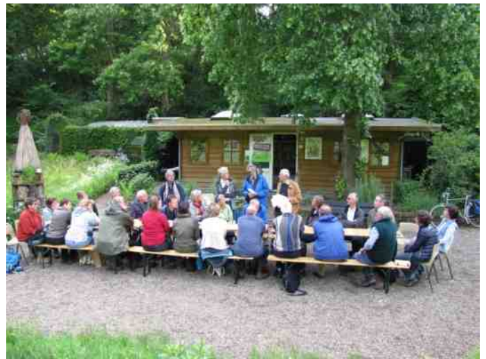
Natuurgidsencursus 30 mei