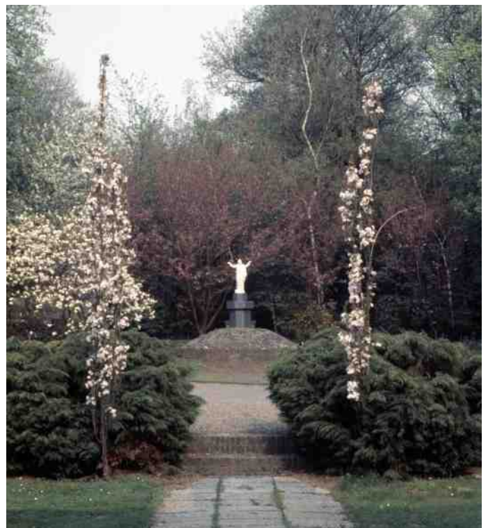
Blik in de vroegere kloostertuin