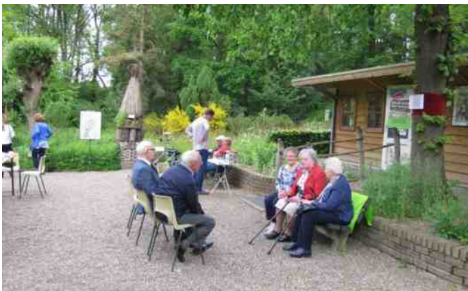
17 mei: Reünie bij de 40-jarige lindeboom