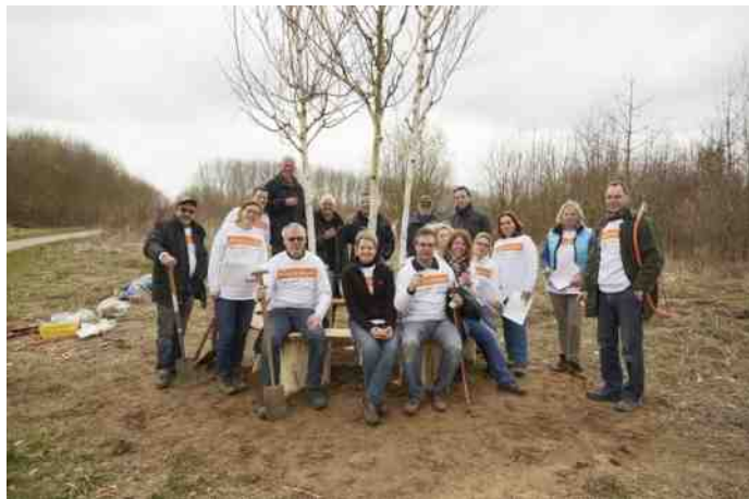
Hierboven: de Rabobankvrijwilligers

Inmiddels is wel de laan weer vol gegroeid met brandnetels - opnieuw werk aan de winkel!