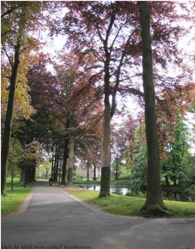
Met de klok mee vanaf hierboven: