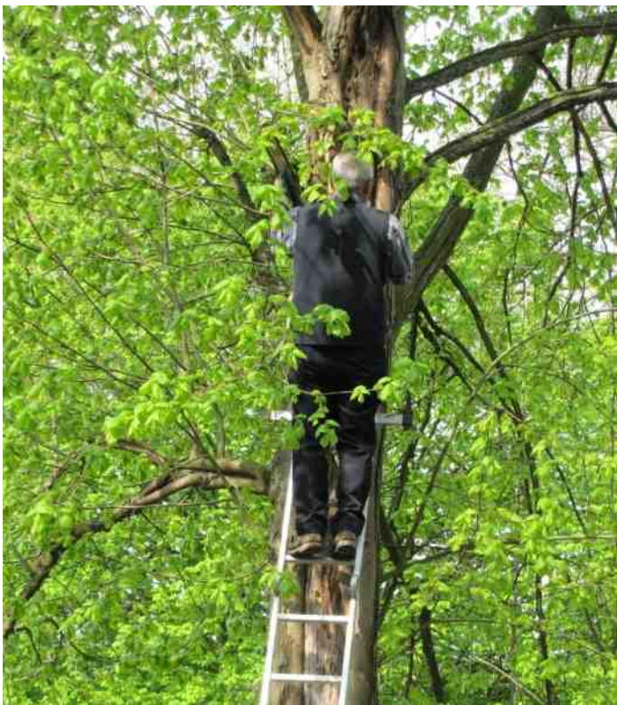
Lindeboom beschermen tegen specht