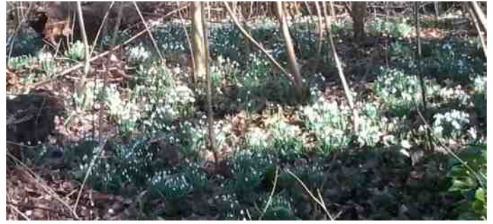
De sneeuwklokjes bloeien nog jaarlijks