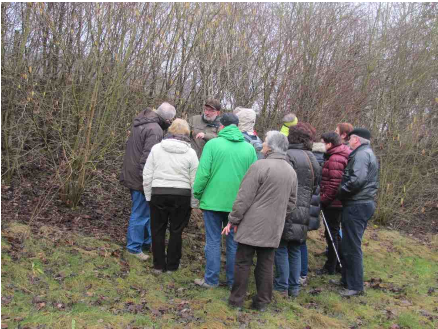
Lex over de bloei van de hazelaar

in de Engelse landschapsstijl. Het park is echter nooit geheel voltooid. De zichtassen en de mooie boomgroeperingen zijn er wel. Het kasteelpark is dan misschien niet zo groot, maar de variëteit in aanbod van bomen is er niet minder om.