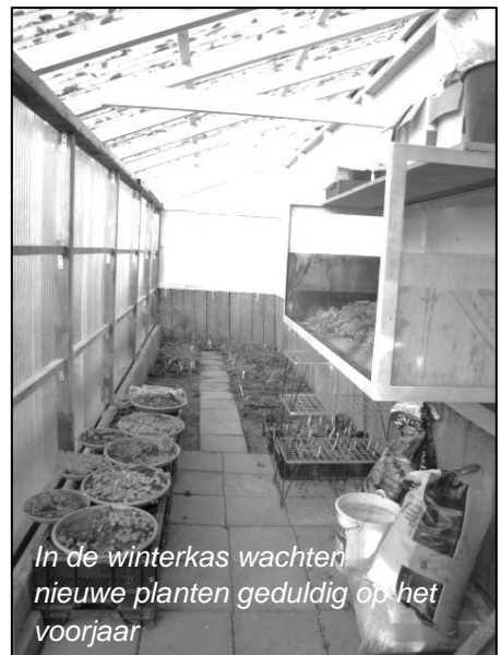
In de winterkas wachten nieuwe planten geduldig op het voorjaar

Het gebruik is dat de Heemtuin voor het eerst weer open gaat op de een na