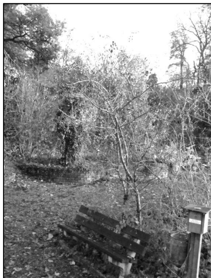
Deze mispel hangt begint december vol rijpe vruchten (inderdaad: 'zo rot als een ...')

Karrevrachten snoeihout zijn verwerkt – het stamhout is deels gebruikt voor een wigwam die in een volgend seizoen aanleiding zal geven tot veel gescharrel van kids – variant op de doelgroep Scharrelkids van IVN, vereniging voor natuureducatie en