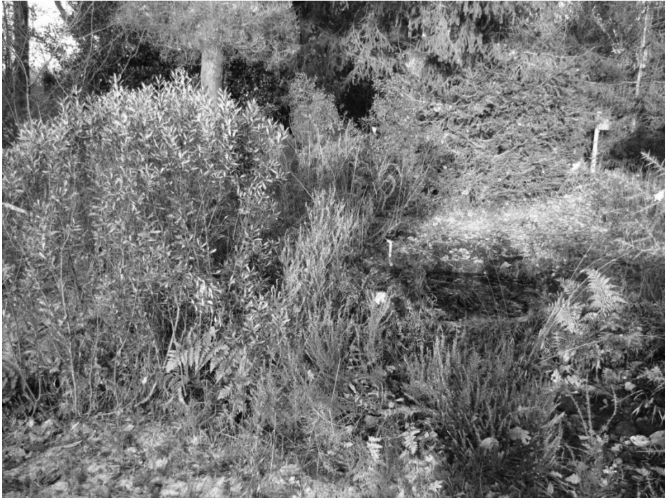
Links een verzameling gagelstruiken, rechts het vennetje

Tot zover Wikipedia. Elders op het internet vind ik dat de stoffen in de plant ook goed zijn voor de huid, maar dat zwangere vrouwen er beter van af kunnen blijven. Als je de katjes kookt in water kun je van de was die overblijft lekker ruikende kaarsen maken. Leg je de blaadjes in de linnenkast dan gaat je goed er lekker van ruiken. Gagelolie wordt gebruikt in de aromatherapie.