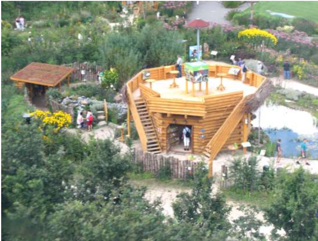
Through animal eyes vanuit vogelperspectief (dankzij de kabelbaan)