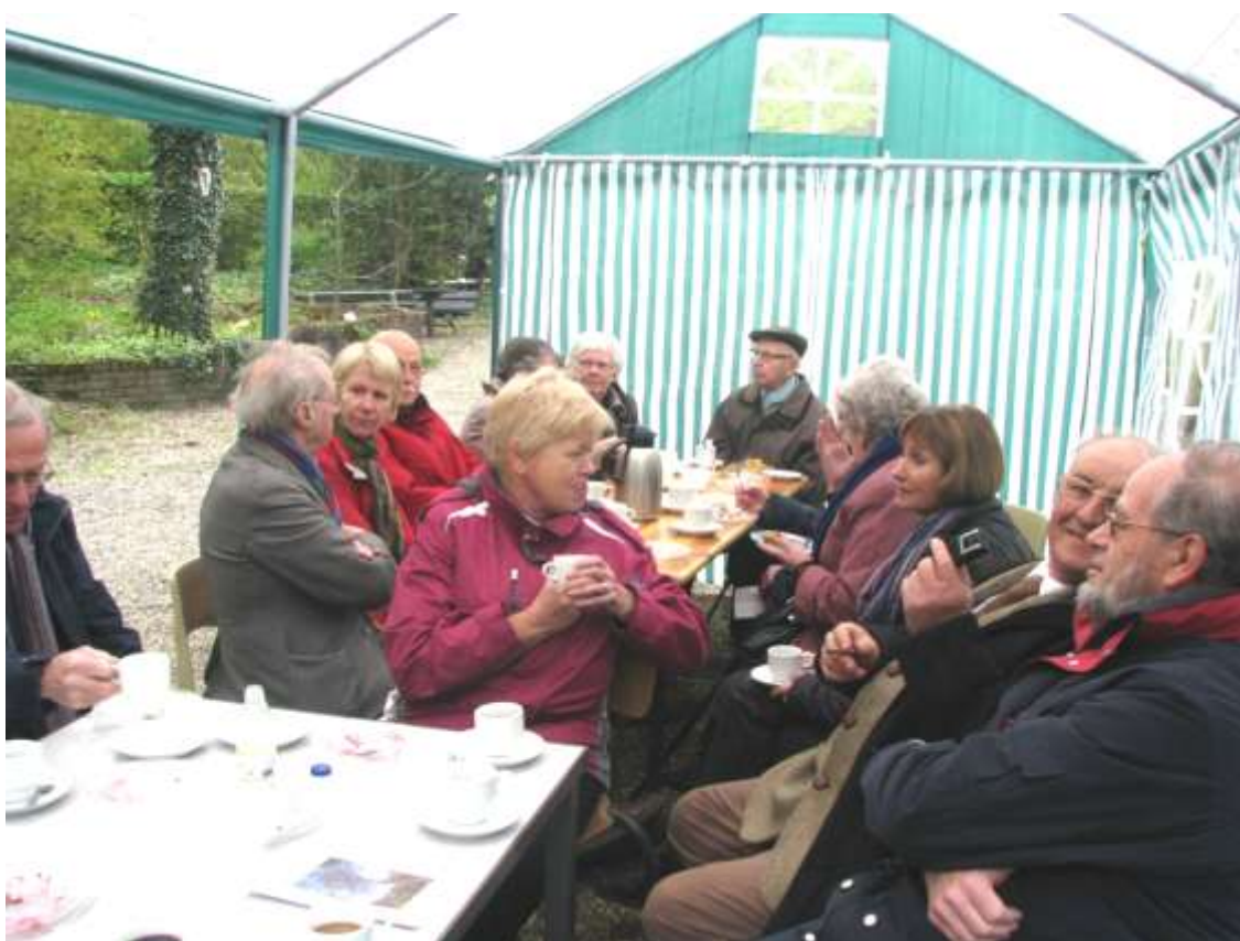
En na de mis de koffie met vlaai