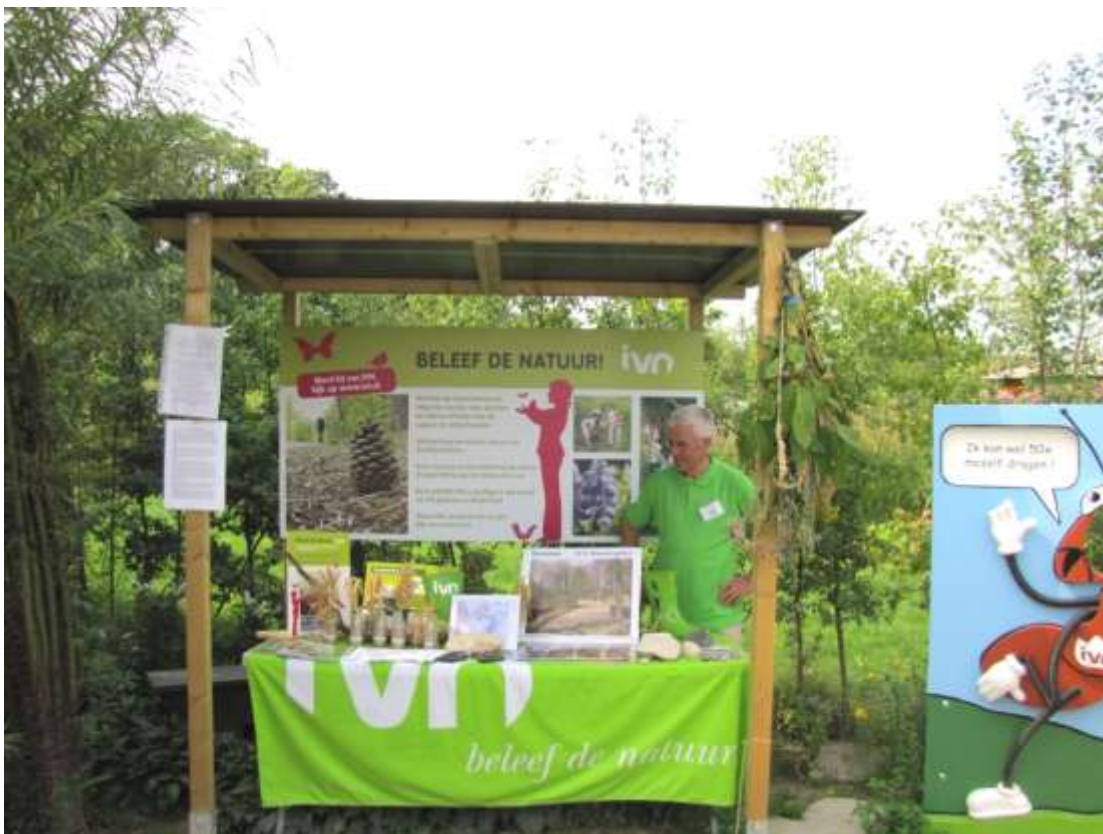
Deze stand van IVN valt op de foto boven weg achter het struikgewas (midden boven). De mier rechts laat weten dat zij wel 50 x haar eigen gewicht kan dragen. Kinderen (en volwassenen) lieten zich als mier vereeuwigen door hun hoofd door het gat te steken