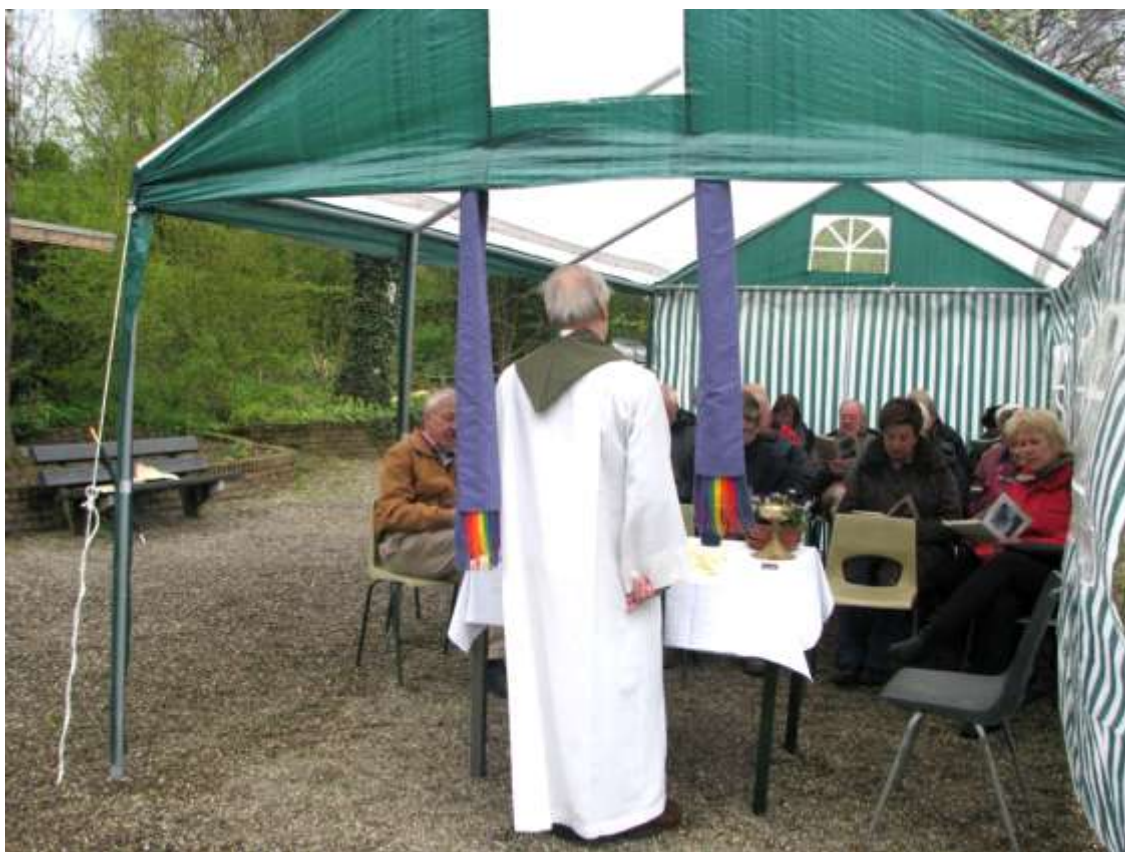
De tent van het verbond