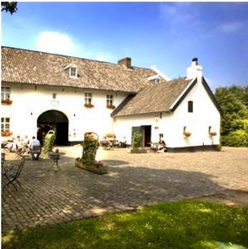
Op deze nok zaten de baltsende nijlganzen