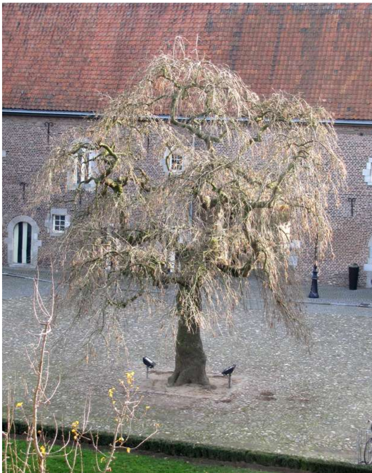
De treures van Kasteel Limbricht: misschien de oudste herdenkingsboom van het land