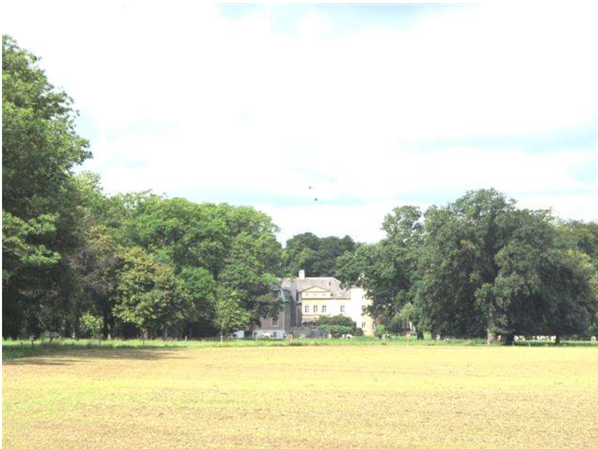
Kasteel Leut: niet alleen het kasteel, maar ook de bomen zijn monumentaal

Steek de Maas over van Berg naar Meeswijk en bezoek de plaats waar de Heren van Leut al sinds de Middeleeuwen vanaf hun burcht de scepter zwaaiden. Dichterbij in tijd is de laatste Heer van Leut, Charles Vilain XIII die in 1822 door huwelijk het kasteel met aanhorigheden verwierf en een rol speelde bij de onafhankelijkheid van België in 1830. Zijn voorvaderen voerden al de wapenspreuk ‘Vilain sans Reproche’ wat zoveel betekent als ‘ik ben wel een schurk (vilain = schurk), maar mij valt niets te verwijten’.