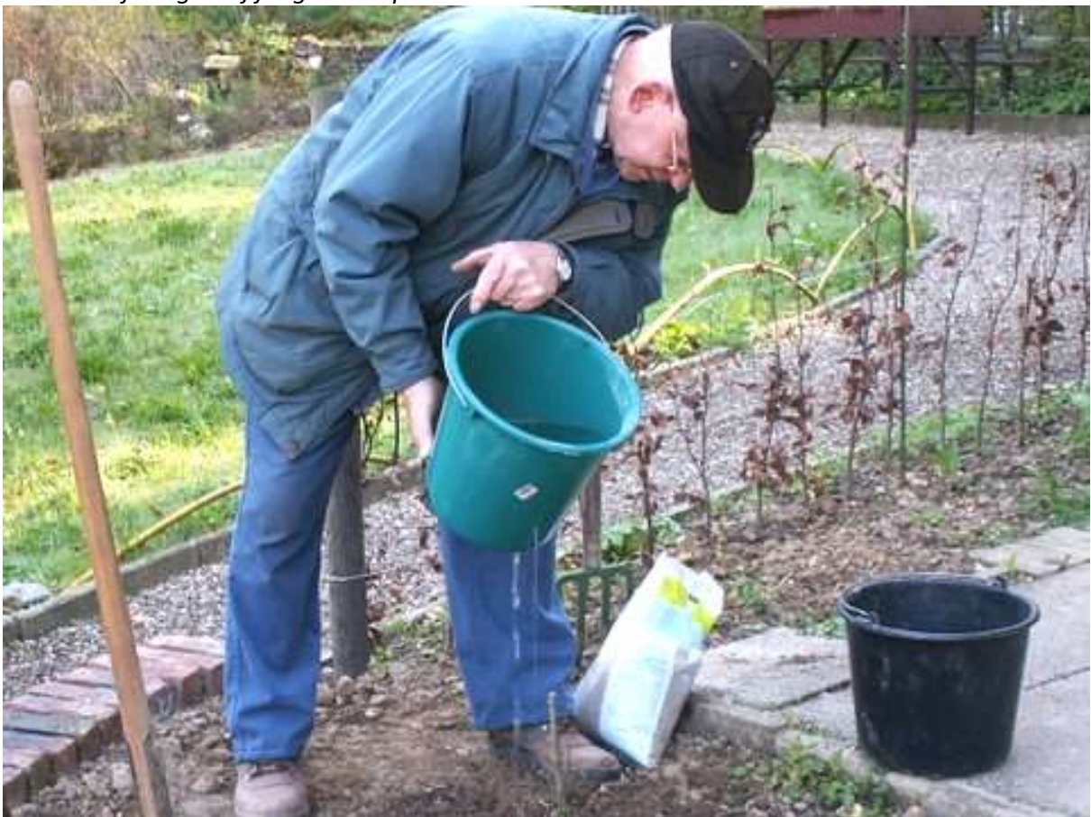
Oudste vrijwilliger bij jongste aanplant