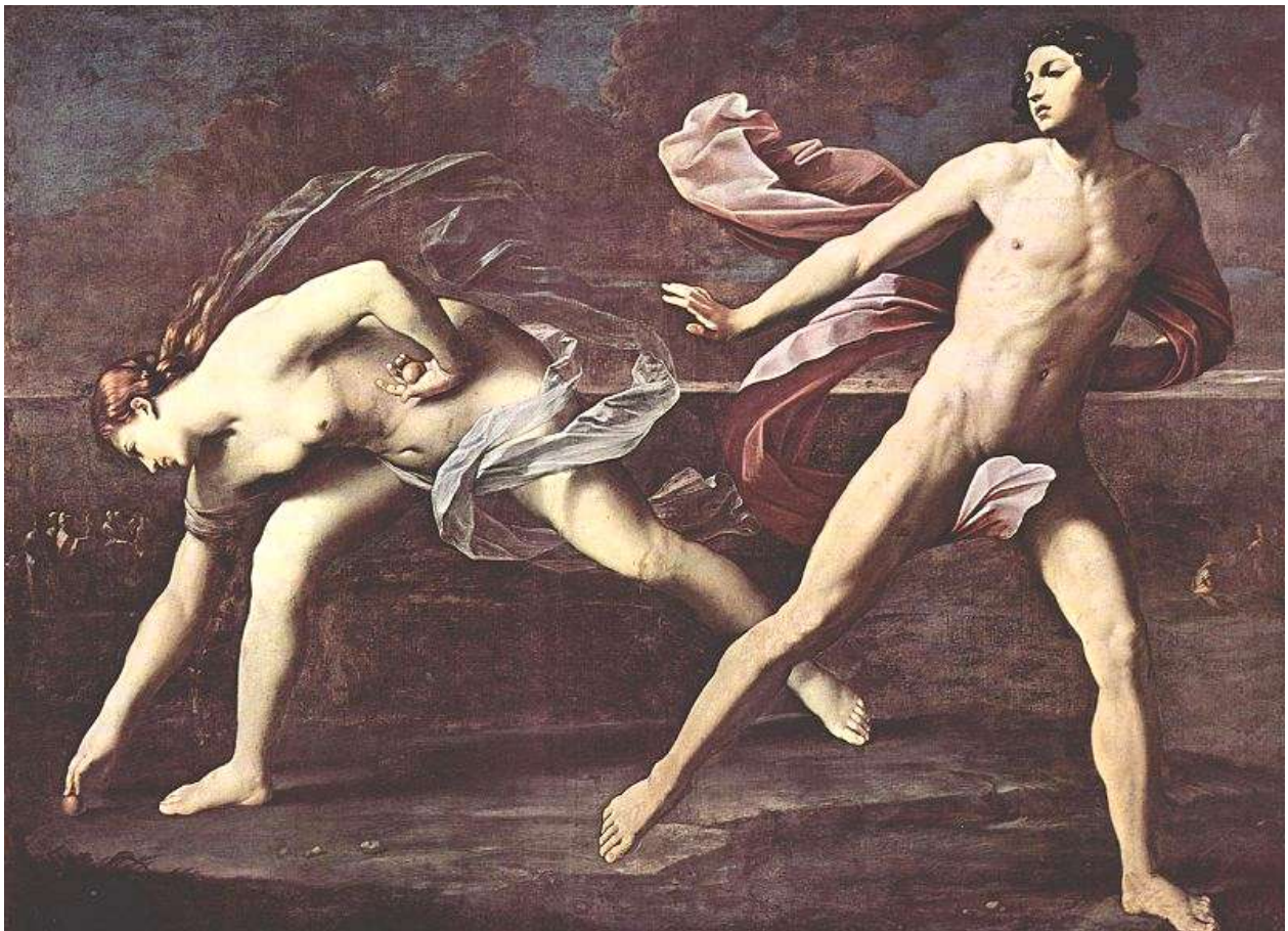
Atalante & Hippomenes, geschilderd door de Italiaanse schilder Guido Reni 1622-25

Tijdens die jacht werd Hippomenes zo gek van verlangen dat hij haar op een gegeven moment een aan Zeus gewijde tempel in trok en heel de nacht de liefde met haar bedreef, totdat, bij het ochtendgloren, Zeus het in de gaten kreeg, het koppel de tempel uit joeg en veranderde in een leeuw & een leeuwin.