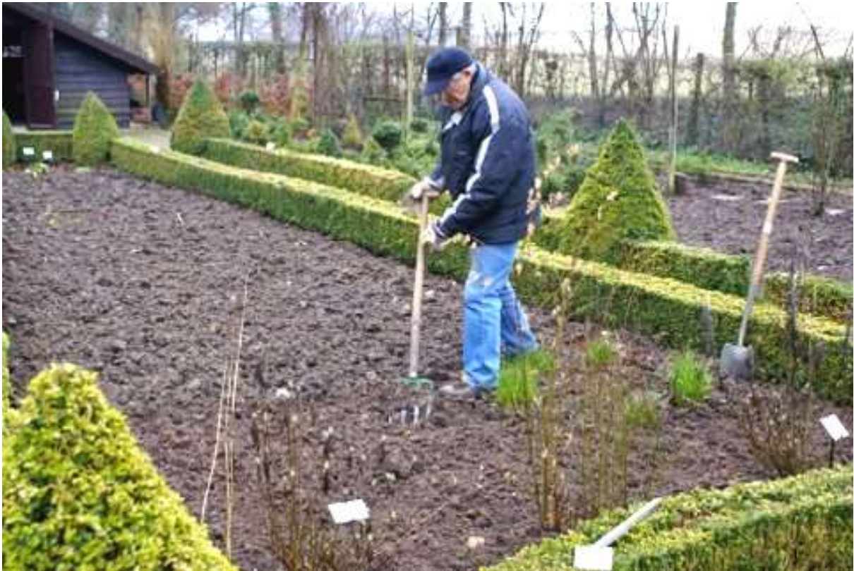
Noeste werker, pardon, vrijwilliger, in de Gaard – werkt altijd toet 't duuster weurd