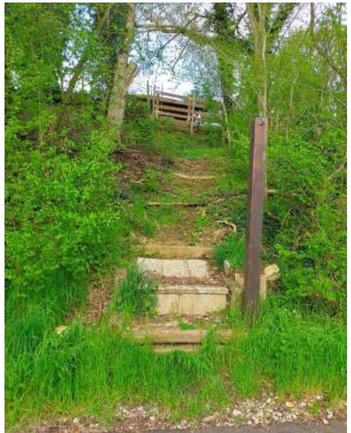
Transporthelling druivenoogst met laadperron.

Het is ook goed toeven op de picknickset bovenaan op de helling van de belendende BelaefBóngerd (bereikbaar via twee klaphekken ter weerszijden van het opgaande pad). Een particulier heeft de set gesponsord voor toen nog IVN Munstergeleen en nu IVN MunsterGeleemSittard. Zodoende heeft hij aan inmiddels veel gebruikers een grote dienst bewezen vanwege het formidabele uitzicht.