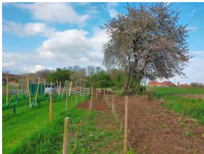
Hóddelshaof met bloeiende kersenboom

Aan de Moezel tref je bij en in de wijngaarden vaak de "Roter Moselweinbergpfirsich" aan. Deze bijzondere perziksoort groeit onder dezelfde condities als wijnranken en wordt vooral in de omgeving van Cochem in groten getale bij wijngaarden aangetroffen. De Weinbergpfirsich wordt vaak ook als alternatief voor de druivenstokken op de steile hellingen aangeplant. De vruchten worden gebruikt om er verschillende lekkernijen van te maken zoals jams, likeur enz. De Weinbergpfirsich heeft zijn oorsprong in China en is door migratie in het Middellandse Zeegebied terechtgekomen. De Romeinen hebben de plant naar de Moezel gebracht. Vanaf dit jaar dus nu ook te zien bij de wijngaard. Vroeg in april, als de wijnstokken de eerste groene blaadjes krijgen, staan deze boompjes al vol in bloei.