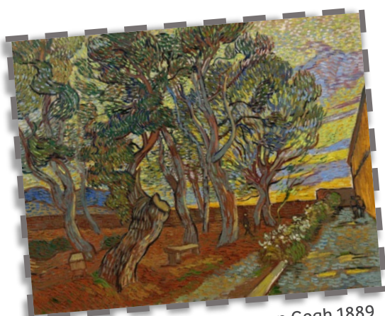
De tuin van de inrichting, van Gogh 1889