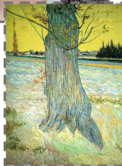
Stam van een oude taxusboom Van Gogh 1888