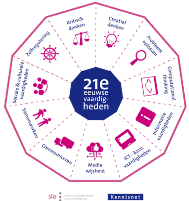
Afbeelding 1: 21 e -eeuwse vaardigheden.

In het Van Gogh Mysterie komen de vaardigheden kritisch denken, creatief denken, samenwerken en zelfregulering naar voren. In de voorbereidende les wordt indirect aandacht besteed aan ICT-basisvaardigheden wanneer er gewerkt wordt met de digitale lesbrief.