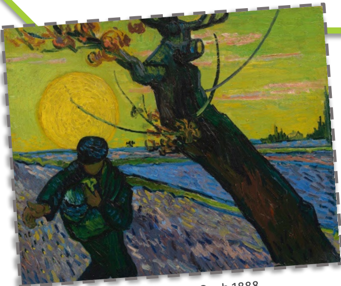
De Zaaier, Van Gogh 1888 Zie je het contrast?