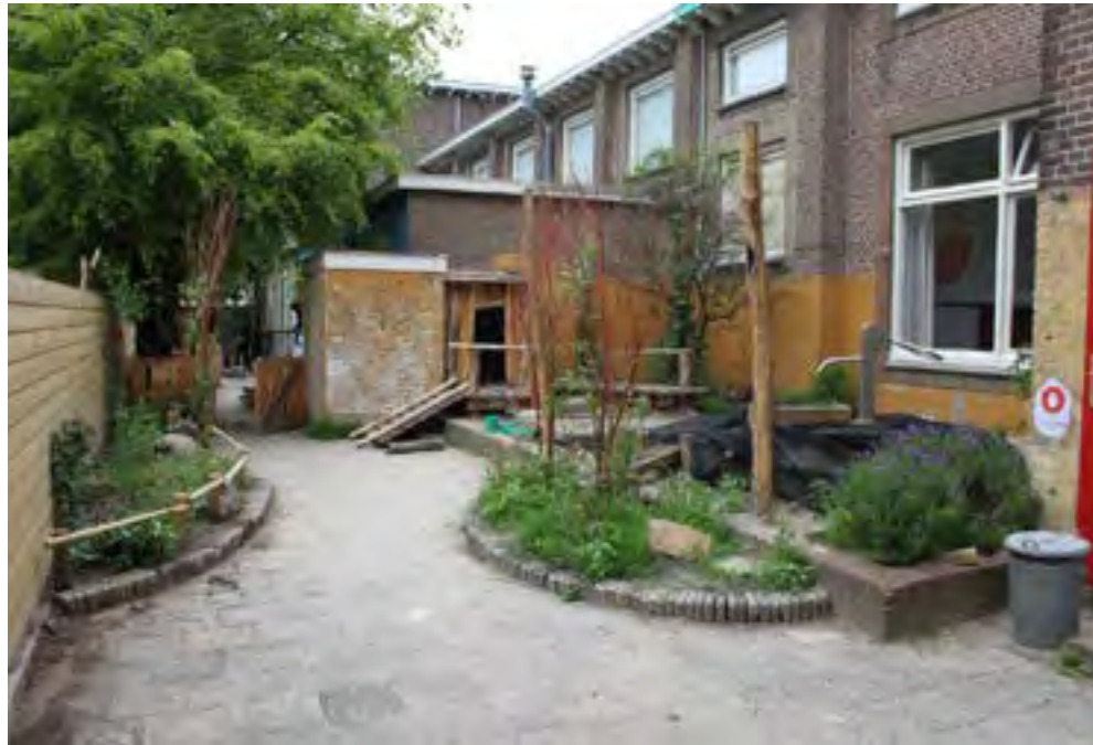
spannende route langs 't Fortje door speelhuisje langs krentenboompje via trap de zandbak in, naar waterpomp+goot