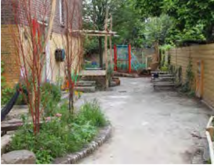
lachspiegel, podium voor oa poppenkast/winkeltje, met lunchplek. troon voor de juf, ook als voorleesplek, bij oude speeltoestel