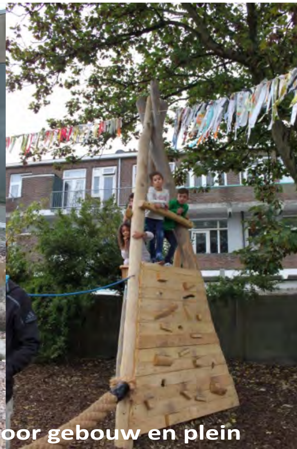
een "eigen" gezicht voor gebouw en plein