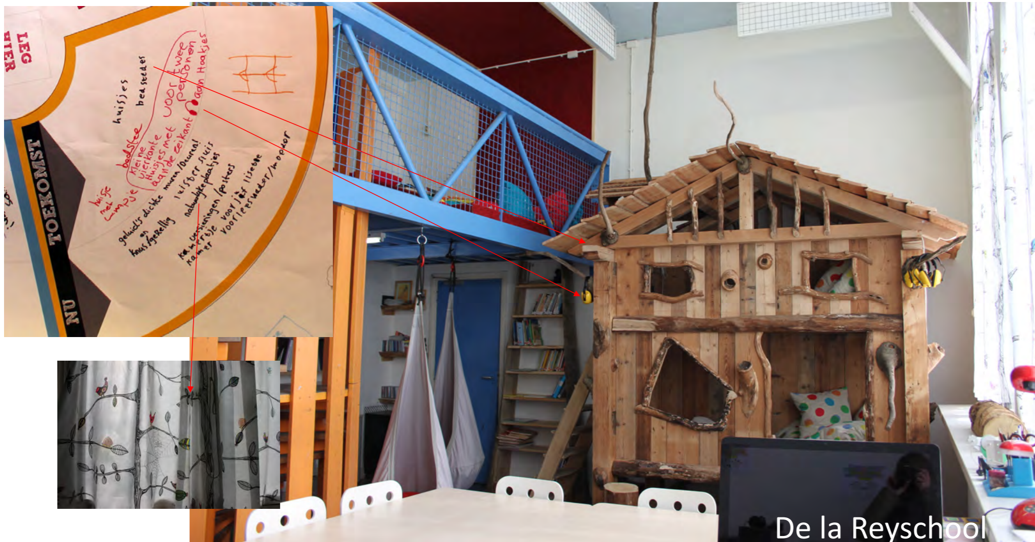
De la Reyschool