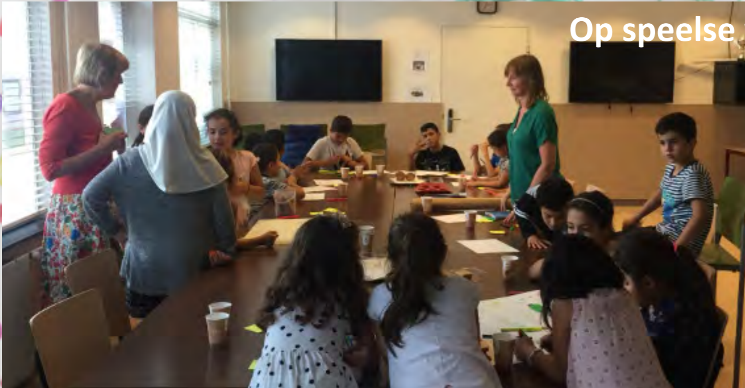
Op speelse wijze is een passend ontwerp gemaakt.