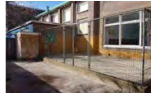
speellandschap met kruip-door-sluip-door padjes, een buitenkeukentje, wilgenhut en wachtershuisje bij de poort.