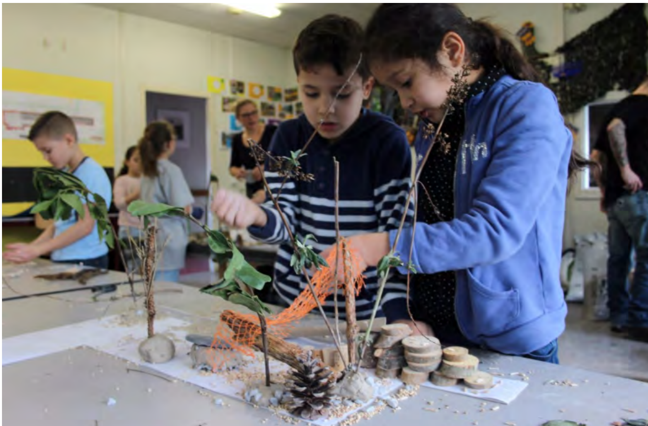
maquettes maken met materialen uit het bos, in het tuinlokaal

"Het enthousiasme en de verwondering van het jongetje toen hij zag hoe het water uit de waterpomp tussen de stenen door de helling afstroomde, via de gaatjes in de zandbakrand de zandbak in en daarna verdween in het zand." Zo fijn om te zien, daar doe ik het voor!