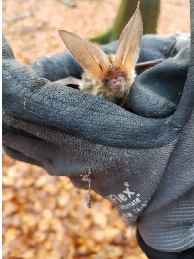
Een grootoorvleermuis