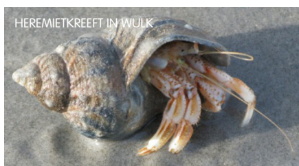
HEREMIETKREEFT IN WULK

Op het strand kun je de slakkenhuizen van wulken (2), tepelhoorns en alikruiken vinden. Soms vind je van deze weekdieren lege slakkenhuizen die onderaan mooi zijn afgeschuurd. Dan heeft er een heremietkreeft (2)