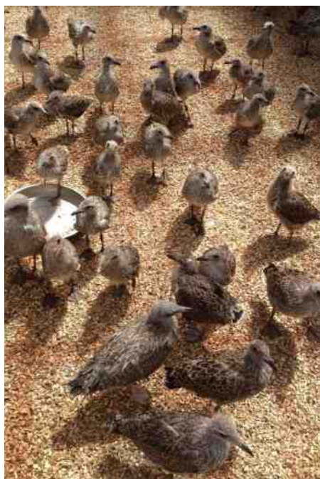
Wie komt ons verzorgen?

Een houtig plofje vanuit de hoge bomen op Middenduin. Een eikel of kastanje komt omlaag. De zwaartekracht heeft gewonnen. Dat brengt me helemaal in de sfeer van het thema van deze Toorts: vruchten en zaden. Zuid Kennemerland is er rijk mee bedeed. Met kleurrijke bessen van zwartblauw tot oranjegeel en met heel veel neutraler getinte eikels, hazel- en beukenootjes en wilde kastanjes. Kleine kunstwerkjes allemaal.