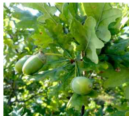
Zomereik met lange steeltjes aan de eikels.

Wat is dat toch heerlijk steeds meer te ontdekken, terwijl je gewoon rustig blijft zitten of staan in de zon. Zo vallen mij ook opeens kleine eikjes op, maar ze zijn wel volwassen want ze zitten vol eikels. Ik klim omhoog om ze van dichtbij te bekijken. Zomer- of winter-eik? Nu is 98 procent van de eiken in Nederland zomereik, maar je weet maar nooit. Maar de eikels zitten op lange stelen en de blaadjes niet, dus ja, een zomereik. Het woord 'eik' is trouwens een Oud-Germaans woord en betekent 'boom'. Het hout wordt en werd voor allerlei doeleinden gebruikt, echter niet meer voor een galg. Die mocht vroeger van geen andere houtsoort dan van eikenhout worden gemaakt.