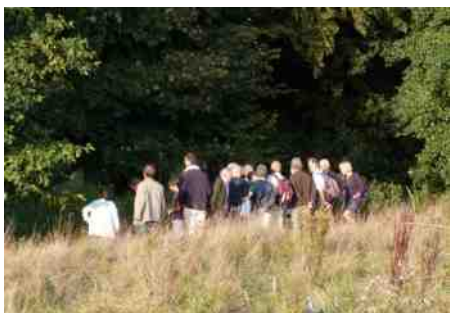
In Groenendaal is een overvloed aan noten, bessen en zaden.

We leggen het thema van de wandeling uit: vruchten, zaden en de verspreiding van planten. Wat is er op dit punt speciaal aan Groenendaal? Wat kun je er zoal vinden? Als je vanaf het vertrekpunt om je heen kijkt, is dat snel duidelijk. Je kunt de hazelnoten, sleedoorn- en meidoornbessen, tamme kastanjes, bramen, esdoornzaden en rozebottels zo aanwijzen. Alle soorten zaadverspreiding kun je illustreren als je hier even rondloopt: wind, vogels, klitten, insecten en het werpmechanisme van klein springzaad.