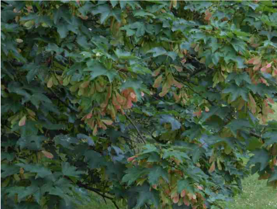
Gewone esdoornvrucht.

Ken je dat? Dat er in je tuin of moestuin ineens allemaal plantjes opkomen die je helemaal niet gezaaid hebt? Waar komen die zaadjes in de grond vandaan? Soms is het duidelijk van een plant of boom die vlak in de buurt staat. Maar planten bedenken ook allerhande trucs om hun zaden te verspreiden: door de wind, via het water, mechanisch of door mens en dier. Iedere plant heeft zijn eigen techniek om te overleven.