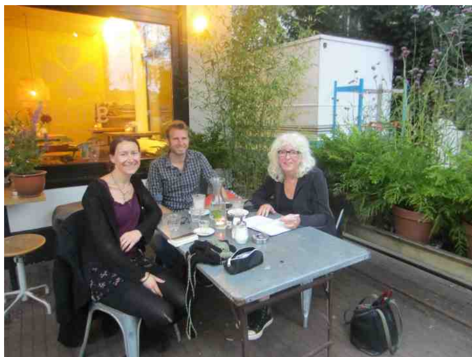
De tijdelijke redactie heeft er zin in.

Dit doen wij in het kader van onze eindopdracht voor de Natuurgidsen-opleiding. Een opleiding die wij met veel plezier en enthousiasme volgen.