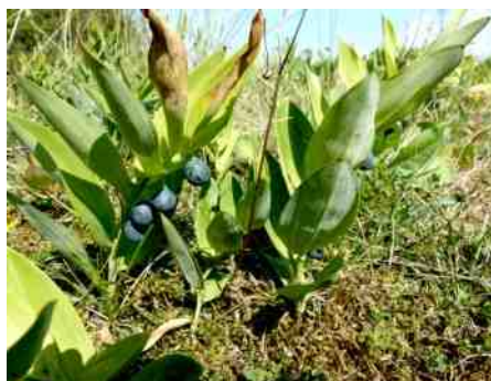
Salomonszegel met blauwe bessen.

bodembedekkers en stoppen bij de bessen van de salomonszegel. De bessen zijn flink, zeker een centimeter in doorsnee en hebben een dof donkerblauwe kleur. Hoewel ze zoetig schijnen te smaken, zijn ze ook giftig, dus laat ik ze hangen.