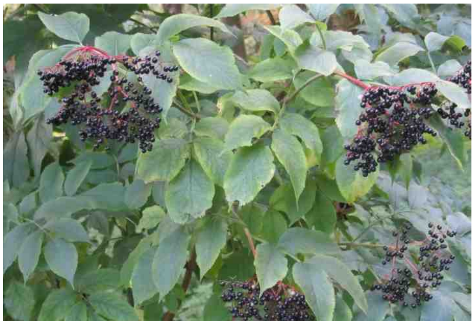
Sambucus nigra, vlierbes.

Sommige dieren eten vruchten waar de zaden nog inzitten. Vogels zijn bijvoorbeeld gek op vlier- en lijsterbessen. Ze eten de bessen op maar kunnen de zaden die erin zitten niet verteeren. Zo komen de zaden via het spijsverteringskanaal in de poep van deze