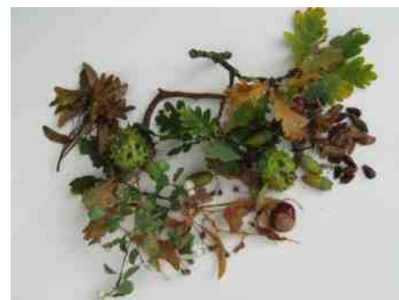
Natuurlijk stilleven.