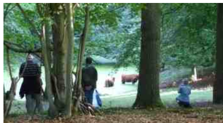
Verrassende ontmoeting met Hooglanders.

De van de opzichter geleende sleutel opent een verrassend bloemenweitje dat normaal gesloten blijft voor het publiek. Zoiets schept een gevoel van exclusiviteit bij de deelnemers. Hier staan late bloeiers zoals de wilde teunisbloem, rode en witte klaver, leverkruid, kaasjeskruid, watermunt en bramen. Dit keer valt ook een oude pe-