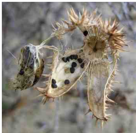
Zaadjes van de doornappel.

Maandag 26 december Tweede Kerstdag 13 – 14:30 uur Vertrek: AWD ingang Oase Aanmelden verplicht via ivnzk.kerstwandeling@gmail.com