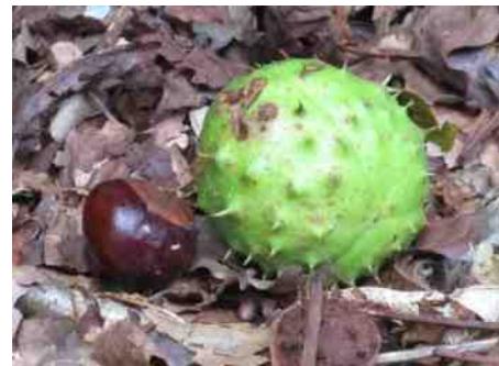
Kastanje en bolster.

Aanmelden is niet nodig tenzij aange- geven. Staat er 'reserveren web- site' dan is reserveren verplicht via www.np-zuidkennemerland.nl Geen internet? Bellen kan di. t/m zo. via 023-5411123