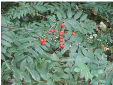
Sorbus aucuparia, lijsterbes.

dieren terecht. En dat is vervolgens weer vruchtbare mest.