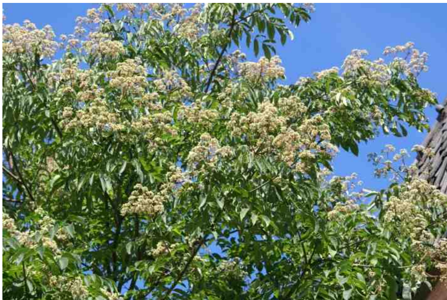
Bijenboom met rijke bloesem in 2011.

De aantrekkelijkheid voor bijen wordt in de classificatie in Arie Koster's Planten Vademecum bevestigd. Het boek kent aan de bijenboom op 'bevliegging door honingbijen' de aanduiding (np)5 toe. Dat is de hoogste waarde op