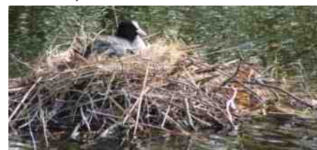
Tekst en foto's: Marisca van der Eem

En nu ga ik toch een rondje buiten maken, kijken of de buurtbedelzwaan er al is. Twee keer per dag komt hij door de sloot en hangt dan wat rond bij het huis waarvan de bewoners altijd brood strooien op het gras. Al jaren zwemt er hier een zwaan alleen, maar of het steeds dezelfde is weet ik niet. Het is een mannelijke knobbelzwaan en hij kijkt me geregeld dreigend aan als ik stil blijf staan om hem te fotograferen. Ik doe dan een stap achteruit en zoom wat meer in. Helemaal rustig op het nest blijft de meerkoet, hoeveel foto's ik ook maak. Mensen, dit is genieten op de vierkante meter.