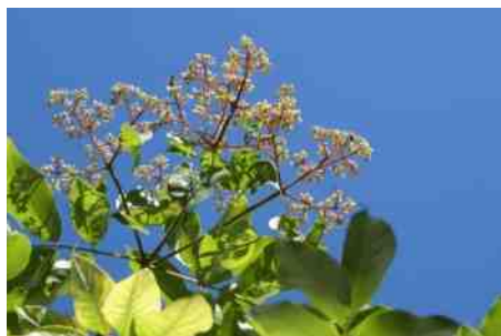
Bijenboom in 2007: voorzichtig in bloei.

Het staakje overleefde in zijn jonge jaren een verhuizing, begon voorzichtig te groeien en eind juli 2007 stond het boompje voor het eerst in bloei. Kleine roomwitte bloemetjes en ja, meteen groepjes bijen op en boven de bloempluimen. Elk jaar meer bloei en toenemend bijenbezoek en bijbehorend gezoem. Ze zijn er weer! Je wordt er helemaal blij van. Het drukke bezoek is goed verklaarbaar. Omdat de Tetradium daniellii een late bloeier is met zijn bloemen van eind juli tot ver in augustus, komen nectar en stuifmeel op een welkom moment.