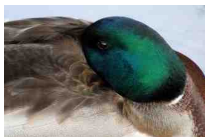
Tekst en foto: Marisca van der Eem

luw, slaapt denk ik geen andere vogel: die vliegt/zweeft en slaapt tegelijk.