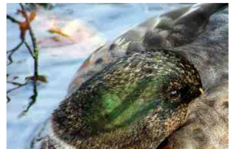
Slapende eend.