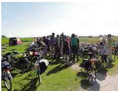
Tijdens een verkennende fietstocht over Texel.