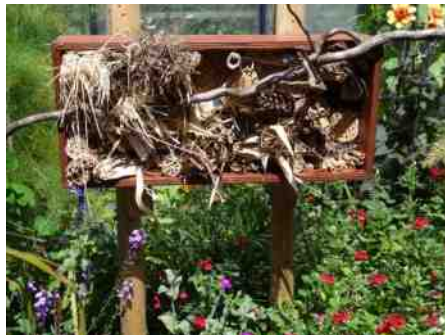
Klein insectenhotel Stadskweektuinen.

De larven die uit de eitjes komen eten van het stuifmeel, en als dat op is verpoppen ze zich, om uiteindelijk een volwassen bij te worden. Het proces duurt een aantal maanden.