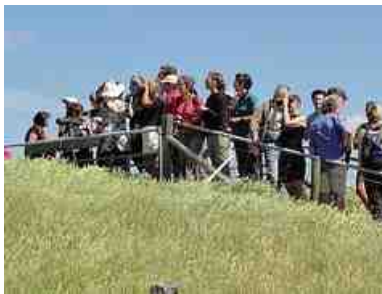
Ver kijken tijdens het Texelweekend.