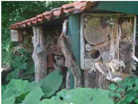
Insectenhotel in de Stadskweektuinen van Haarlem.

Mijn favoriete insectenhotel staat in de Stadskweektuin, levensgroot en verscholen tussen het groen. Daardoor geïnspireerd heb ik een oude, houten plantenbak volgepropt met dennenappels, takken, riet en rommel uit de tuin.