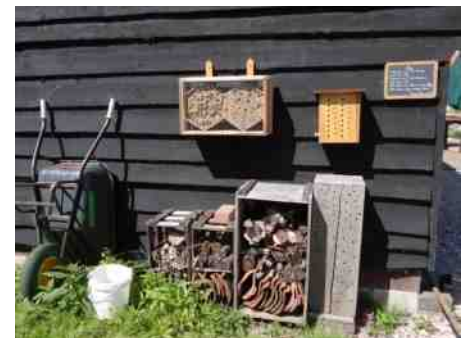
Insectenhôtels en bijenkast op het Landje van de Boer in Overveen.