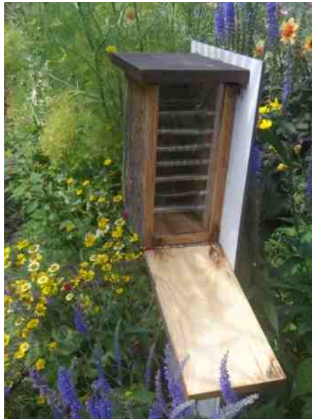
Binnenkant van een bijenkast.

Speciaal voor hen kocht ik op de jaarlijkse voorjaarsmarkt van de Stadskweektuin een bijennestkast van Stichting De Boei uit Vlaardingen (ook te koop bij De Zandwaaijer). De zijkant kan open, zodat je kunt zien wat er in de plastic buisjes gebeurt. Het vrouwtje stopt achter in de buis stuifmeel, waar ze een eitje op legt.