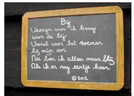
Gedicht geschreven door Ellewiene Wijs.

Solitaire bijen en hun relatie met planten én met elkaar / Jan Jaap Boehlé, in Tijdschrift Oase, winter 2006: www.stichtingoase.nl