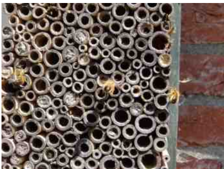
Deze kast hangt in Thijssse's Hof, tegen de achterkant van het pannenkoekenhuis aan.

Een insectenhotel trekt van alles aan: spinnen, oorwurmen, slakken, lieveheersbeestjes, vlinders, wilde bijen. Sommige soorten gebruiken het hotel om te schuilen of te overwinteren, andere gebruiken het als nestruimte. Het is niet alleen een kijkkast voor ons plezier, de insecten doen ook nuttig werk: ze eten luizen, ruimen afval op, en zorgen voor bestuiving. Belangrijke bewoners zijn wilde, of solitaire bijen. Die vormen geen volk (staat) zoals honingbijen, maar doen alles alleen.