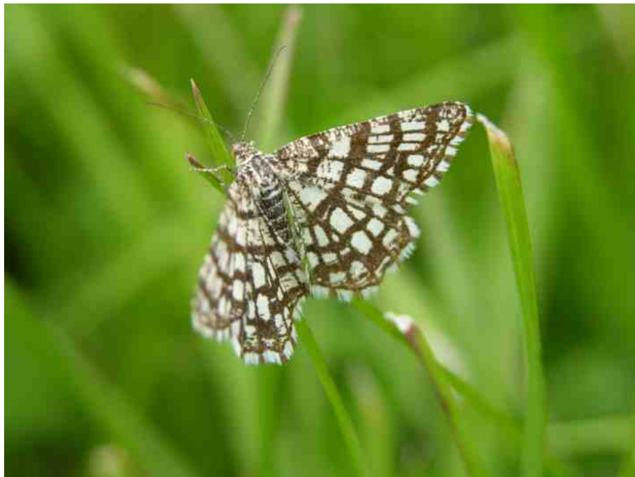
Klaverspanner ( Chiasmia clathrata ).