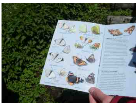
De vlinderzoekkaart.

Op een koude zaterdag wandelen we door een veld vol madeliefjes, over het bruggetje, naar een wei grenzend aan een heuvel vol brandnetels. Vlinders hebben minimaal zeventien graden nodig om actief te kunnen zijn, maar in de luwte in de zon is het behaaglijk. Yvonne Roep gidst deze nieuwe excursie. Ok Overbeek is ook mee, hij weet veel van libellen. Ok en Yvonne hebben aan onze groep van ruim vijftien deelnemers speciale vlinderkijkers en loeppotjes uitgedeeld.