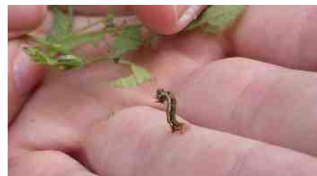
Spanner in actie.

Vogelkers vol gaten verklapt de rupsen van de stippelmot. Yvonne vindt enkele rupsen van spanners, een grote familie van nachtvlinders.