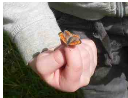
Kleine vuurvlinder (Lycaena phlaeas) op kinderhand.