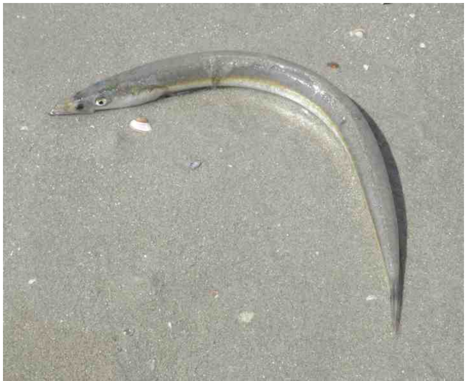
Zandspiering op het strand. Deze vis leeft in grote scholen op de Noordzee. Wellicht krijgen wij hem nog te zien tijdens de ledendag.

Anne komt, sinds hij in Amsterdam woont, al met vrienden en kennissen naar de duinen en het strand. "Gewoon omdat het heerlijk toeven is in de natuur. Later kwamen we er vaak met de kinderen en hun vriendjes." Bovendien werkt Anne al twintig jaar in Haarlem en Heemstede, onder andere bij Zorgcentrum Bosbeek, dat ingeklemd ligt in het Groenendaalse Bos. Daar ging hij vaak even wandelen met zijn verrekijker. Hij wilde graag actiever in de natuur zijn en aarzelde niet, toen het