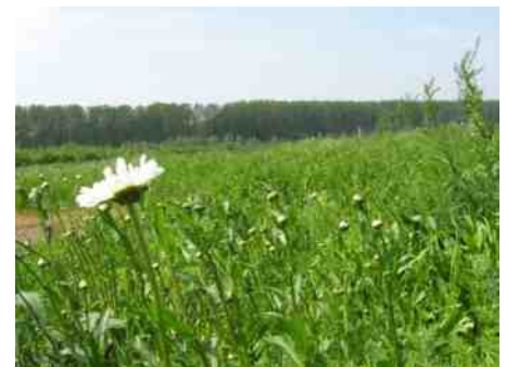
Natuur in de Haarlemmermeer.

Meer informatie vind je op De Groene Loper: www.degroeneloper.info