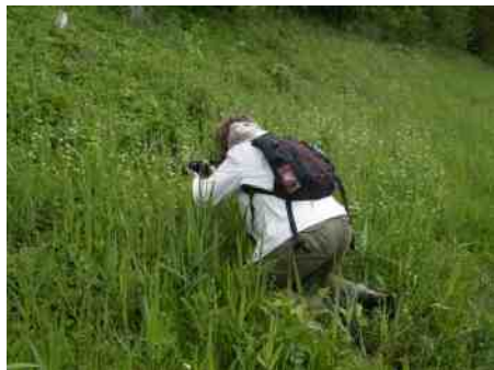
Je moet wat over hebben voor een mooi plaatje... (zittend tussen de brandnetels).

We genieten van gezang van nachtegaal, fitis en zwartkop. Prikkende knieën van de brandnetels, waar ik in heb gezeten om de viervlek van dichtbij te fotograferen, herinneren later aan een geslaagde vlinderwandeling.