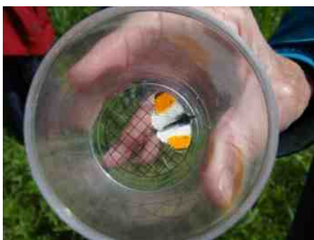
Oranjetipje in loeppotje.

"Er komt een oranjetipje jullie kant op", roept Ok, die al is doorgelopen. Hij vangt de vlinder met een vlindernetje, zelfgemaakt van een gestript badmintonracket en zachte vitrage. In het loeppotje bestuderen we het oranjetipje van dichtbij. Dit is een mannetje.