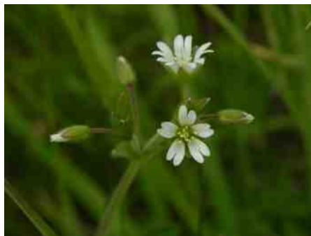
Gewone hoornbloem ( Cerastium fontanum ).

De IVN Zomerweek is een actieve en educatieve vakantie week voor jong (vanaf 5 jaar) en oud. Dit jaar slaat de zomerweek z'n kamp op in Mechelen, van 3 t/m 10 augustus. Er is een groepsaccommodatie maar er kan ook gekampeerd worden, zie http://www.vinkenhof.com . Vraag informatie of meld je aan bij Harrie Moonen, email: h.moonen3@kpnmail.nl tel.nr. : 06-38106238.