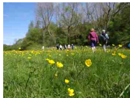
Een veld vol boterbloemen.

Voorzichtig lopen we door een glinsterend gele weide van boterbloemen. Nu bloeien ze nog niet, maar aan de gevlekte bladen herken je de orchideeën die ertussen staan. We zien een vrouwtje oranjetipje, weer een andere libel, nog meer vlinders.