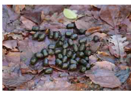
Keutels van een ree of van een hert ??