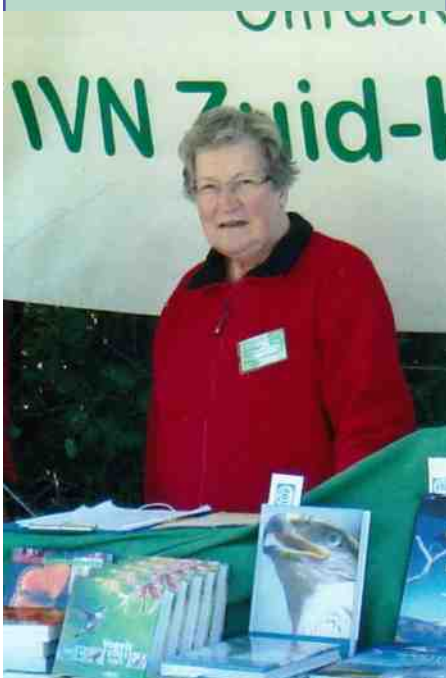
Hennie in actie

Meins van der Wal, coördinator Groene Winkel