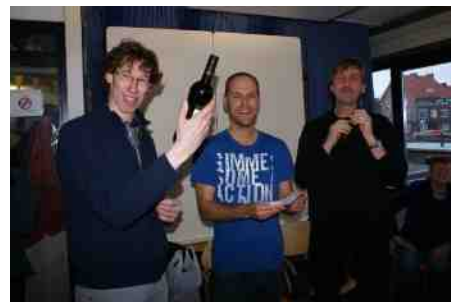
De winnaar van de natuurquiz van de Vogelwerkgroep tijdens de nieuwjaarsreceptie.

Als u het idee heeft dat wij nog niet uw (actuele) emailadres hebben, verzoeken wij u om dit aan ons door te geven.