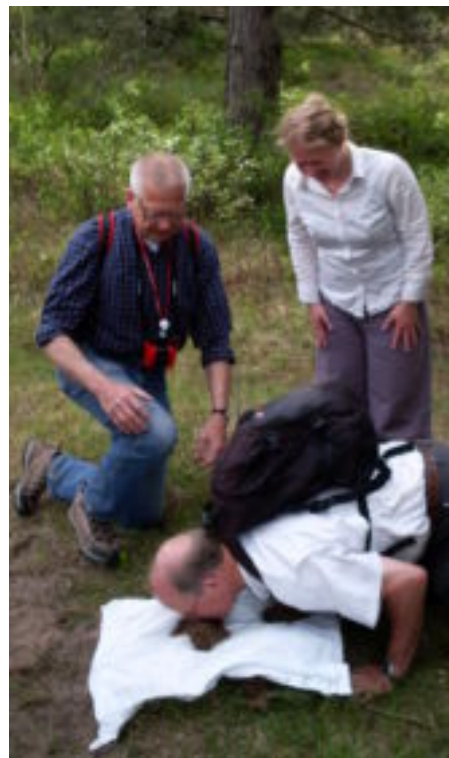
Welke aarde ruikt er zoeter: die van onder een naaldboom of die van onder een loofboom?