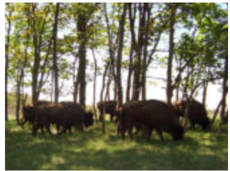
Wisenten in het Kraansvlak.

Voorts leidde Walter ons langs enkele natuuroopbouwprojecten, waaronder een met de grappige naam De Bruid van Haarlem , vanwege de vele witbloeiende Liguster die er vroeger stond. Interessant was ook te horen