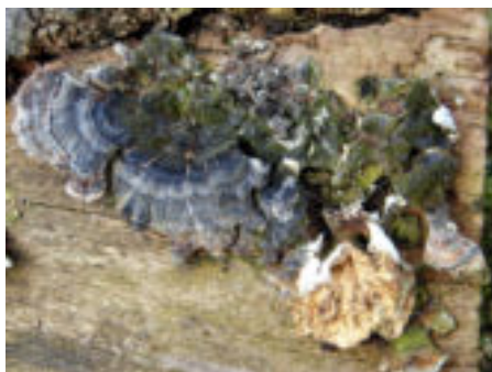
De verschillende kleuren van de hoedjes.

Het zijn saprophyten: afbrekers van afgestorven plantaardig materiaal. En er is een volgorde in de groei en bloei van die soort. De pioniers, bijvoorbeeld de Purperkorstzwam, zijn de eerste afbrekers van de houtstof en bereiden zo de weg voor de volgende groep.