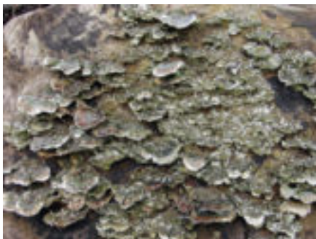
De dakpansgewijze groei van het Elfenbankje.

Het gewone Elfenbankje ( Trametes versicolor ) is een van de meer dan 3500 soorten schimmels die in ons land voorkomt en in ieder bos of tuin waar dode loofbomen mogen blijven, kun je het tegenkomen. Het is een van de weinige paddenstoelen die over bijna de hele wereld voorkomt. Soms kun je hun groei op een boom volgen: van kleine wittige vlekjes die uitgroeien, uitstulpen en dan dakpansgewijs in groepjes langzaam hun hoeden ontvouwen.