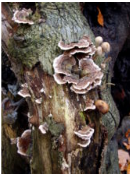
Elfenbankjes en andere paddenstoelen op een dode boom.

zie ik bijna alleen Elfenbankjes. Je realiseert je niet dat als je diep de gezonde boslucht inademt, je mogelijk duizenden sporen inademt, want bijna alle sporen worden door de lucht verspreid.