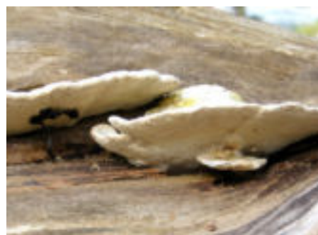
De witte poriën aan de onderkant van een houtzwam.

dan een zaadje. In een zaadje zit al het nieuwe plantje (blad en wortel) klaar en het kan direct uitgroeien tot een plant.