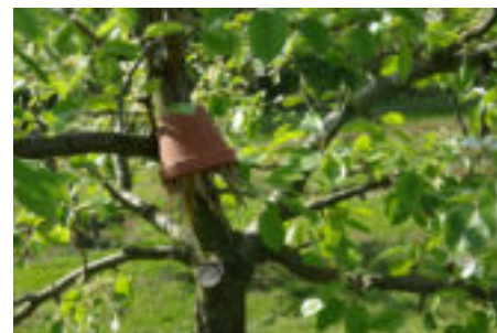
Biologische rupsbestrijding: huisvesting voor oorwurmen

PS: op www.ivn.nl/zuidkennemerland >publicaties>toorts een lijstje met web-links naar sites over appels, de genoemde verenigingen, etc.