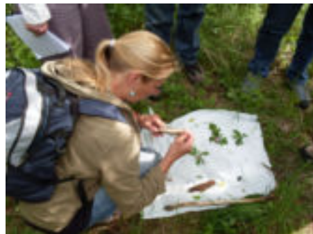
Biodiversiteit, verzameld door de gidsen, op het witte doek. (zie artikel in groene kader)