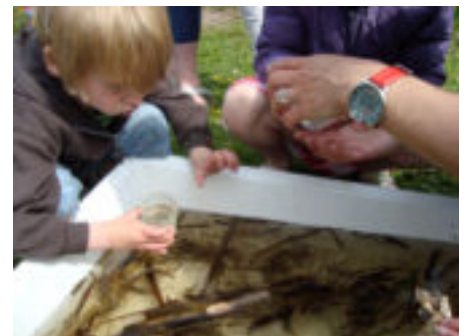
Welk waterdiertje is dat nou?