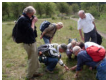
Biodiversiteit ontdekken tijdens de 'Voor-en-door-gidsen-wandeling' op zaterdag 29 mei.