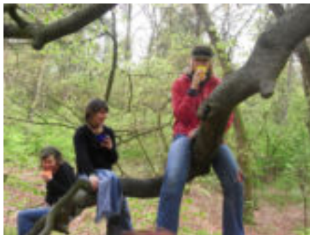
Woestelanders rusten uit na hard werken in de natuur.

Een goede PR is niet eenvoudig, omdat het een landelijke afdeling is, die dus door heel Nederland moet