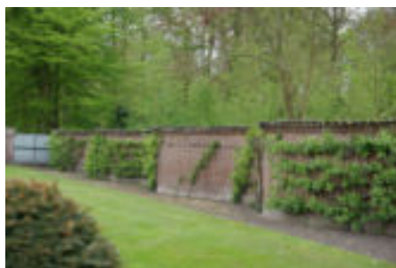
Slangenmuur met perelaars op Huis Te Manpad.

In Zuid-Kennemerland is de vereniging met advies en/of snoei onder meer actief bij Huis Te Manpad in Heemstede en Huis Te Spijk in Velsbroek. Bij Huis Te Manpad staan ruim zestig oude rassen tegen de slangenmuur op het landgoed. Goed beschermd en vroeg in bloei. Erg leuk om te gaan kijken. Huis Te Spijk is niet voor publiek toegankelijk. Op deze historische grond, waar vroeger een kasteel stond en waar de overgebleven wallen nu rijksmonument zijn, plantten de huidige bewoners zo'n tien jaar geleden vijftig oude appelrassen. De schapen grazen er tussen.