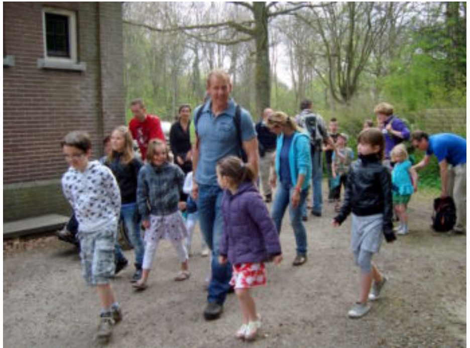
Natuurgidsen op pad met kinderen in Middenduin.

Beide excursies zijn opgezet door Sietse Terpstra[1] en Petra van Wezel, gidsen van de nieuwe lichte, als eindopdracht van hun opleiding. En beide excursies werden deze zondagochtend door allemaal nieuwe gidsen gegeven.