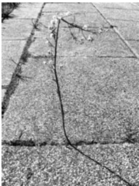
Natuur in Haarlem.