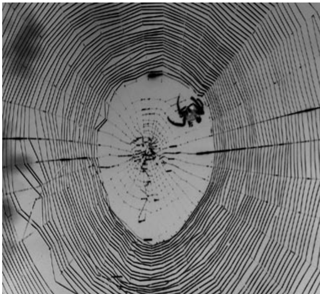
Natuur in de stad Haarlem: spinnenweb in aanbouw.