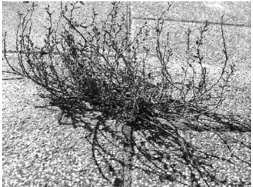
Natuur in de stad Haarlem: tussen de stoeptegels.

Tijdens een kennismakingsgesprek met enkele bestuursleden, merkte ik al snel de betrokkenheid en het enthousiasme van deze mensen. Al met al heb ik in korte tijd ontdekt dat het IVN een club van mensen is die hun kennis van en liefde voor de natuur en het milieu graag met anderen willen delen. Bij het IVN ben je, samen met anderen, actief in de samenleving bezig en dat vind ik ook belangrijk.