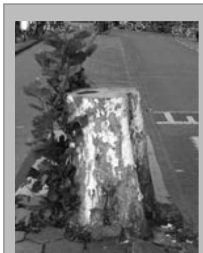
Boom die niet weg wil, Stationsplein Haarlem.