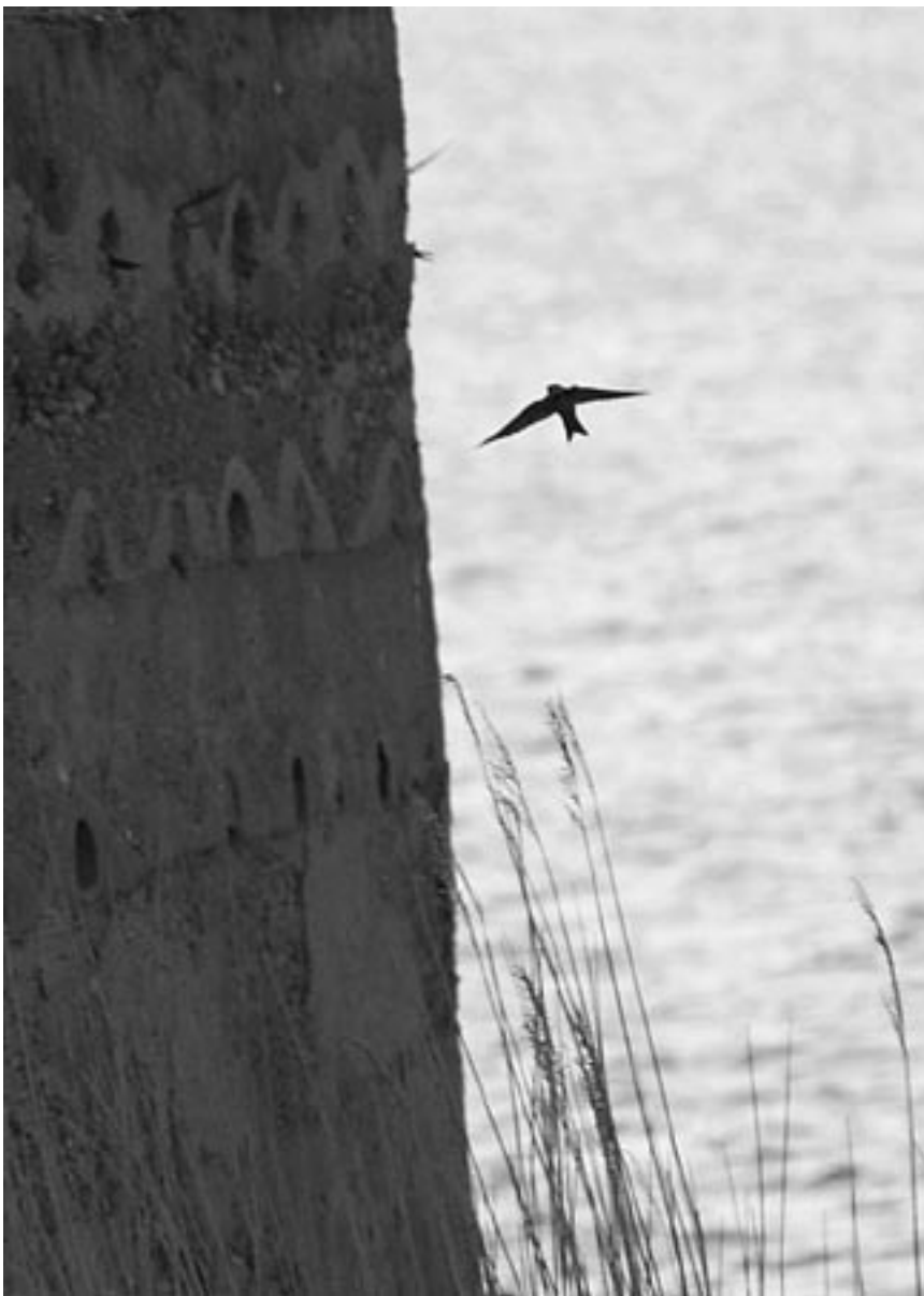
Oeverzwaluw bij de broedwand in de Toolenburgerplas (7 mei 2008).

lijk sprookjesachtige naam voor een zwam, maar ondertussen ... Er groeit op die halfvergane stammen op opschot van diverse loofbomen. Op het terreintje ligt ook een oud vaartje met deels afgekalfde oevers met kleine, ondiepe plekken op wit zand, ideaal om waterdierpjes te bekijken.