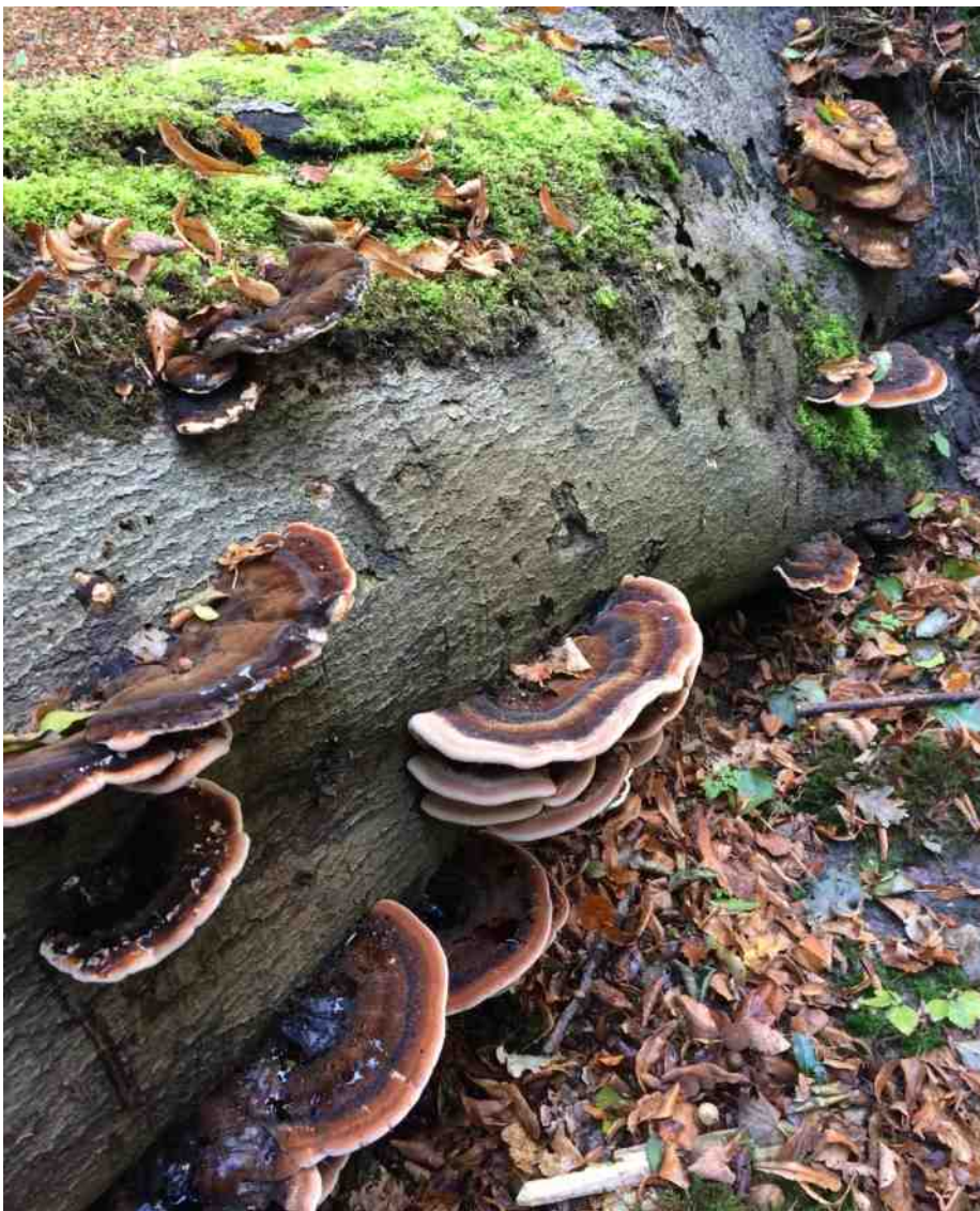
Goed voor de weerstand.

Tekst: Mariëlle Gerritsen