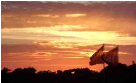
Kracht van wind.