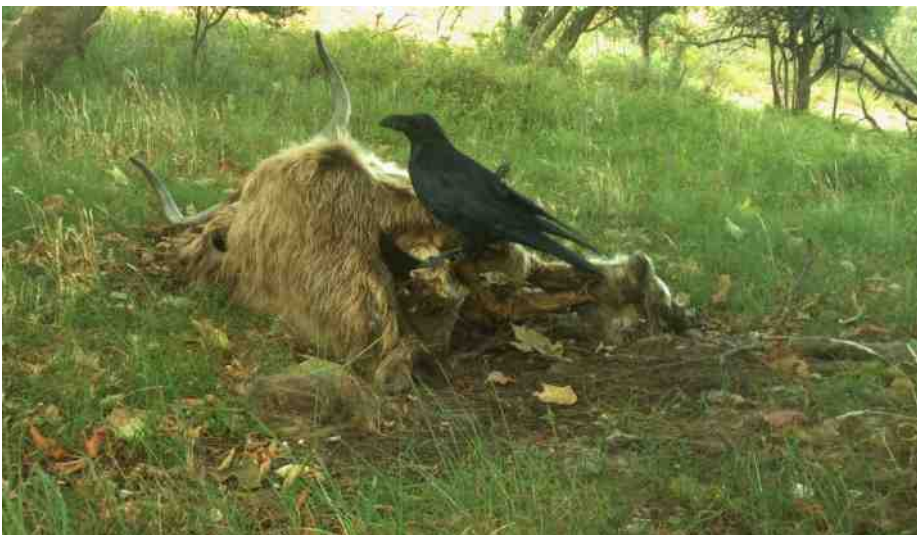
Voor het eerst weer raven in het duin.