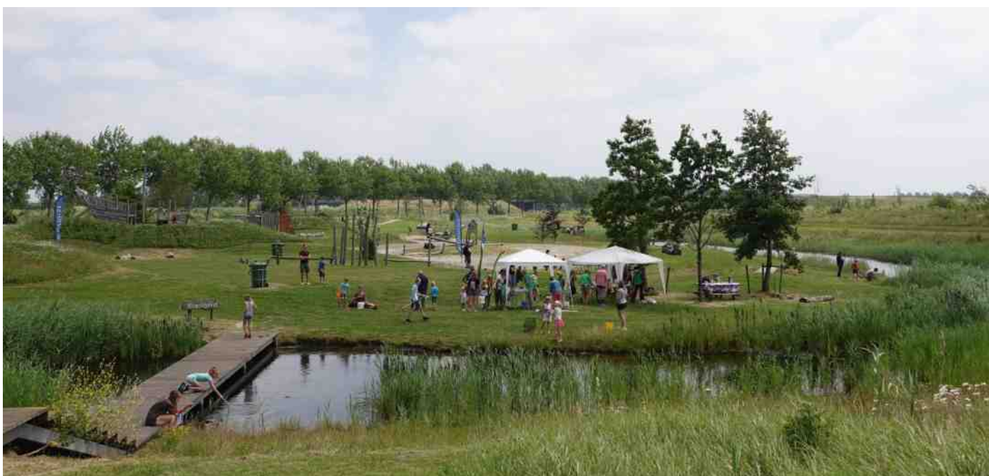
Gezellige drukte bij Slootjesdag 2019.