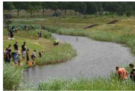
Meanderende sloot in PARK21.