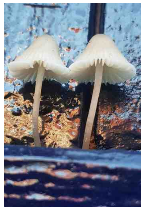
Paddenstoelen op de deur.