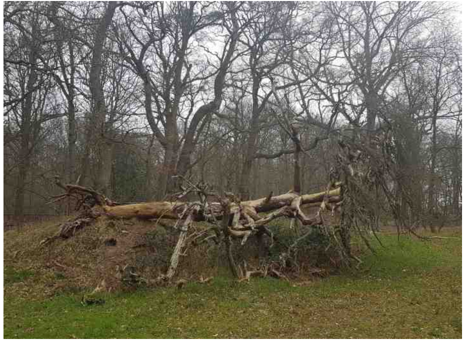
... en opgebaard

Je ziet dwarsbomen niet zo vaak. Niet iedere boomsoort leent zich ertoe en voor de overlevingskansen maakt het uit of ze vrij staan of in het bos. Meestal worden ze snel weer opgeruimd. Ik herinner me een imposant geval, een gigantische populier, ergens in de omgeving van Gouda, dichtbij een meter in diameter, die horizontaal vrolijk verder leefde. De dikke takken kozen de weg omhoog, houvast biedend voor een droog wandelingetje over de stam boven het zompige bos waar de boom gevallen was. Het wortelgestel torende een meter of vier