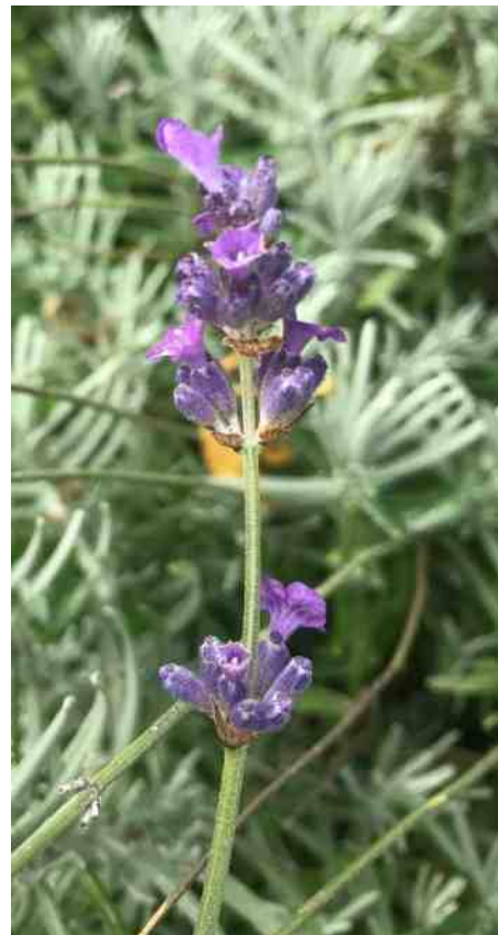
Voorbeeld van balsemkruid.

Tekst: Margo Slot