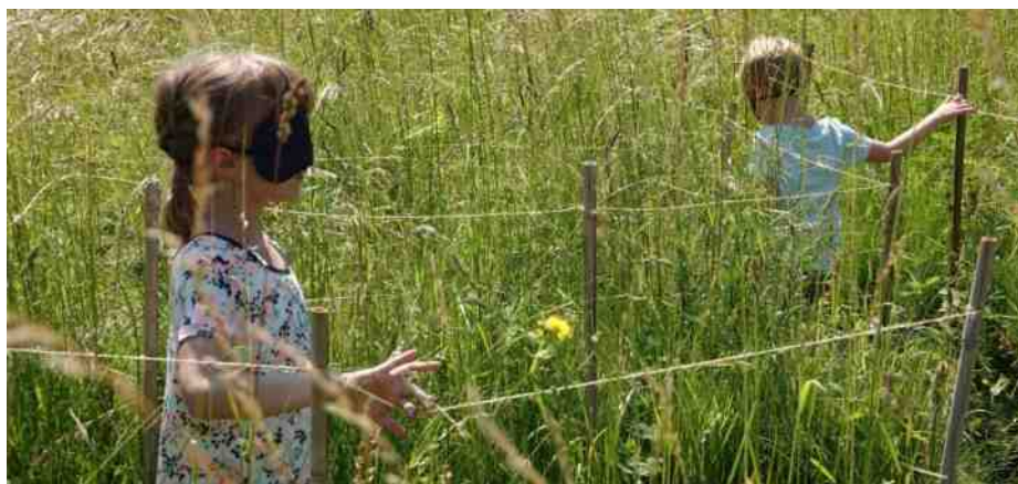
Blote voeten pad.

door de bezoekers. Diverse groenorganisaties waren present om bezoekers te vertellen over hun activiteiten. Voor de kinderen was er een spellencircuit met als beloning een smoothie of een ijsje.