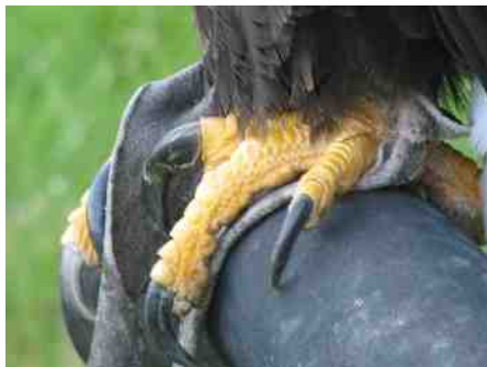
Krachtige klauwen.

De kracht van de natuur is voor een groot deel het zelfherstellende vermogen van de natuur. De reactie van bomen, bloemen en dieren op vraat, overbevolking en voeding is wonderlijk. En even wonderlijk is de kracht waarmee het mensen uit hun huizen kan trekken voor een fijne wandeling en simpel genieten.