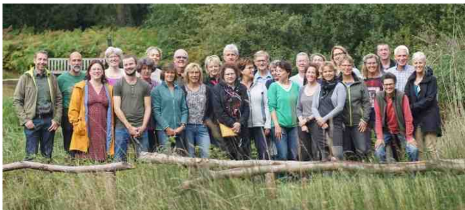
Enthousiaste cursisten en docenten.