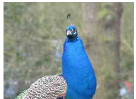
Trotse pauw.

Natuur betekent voor mij: rust, ontspanning. Even weg uit de hectiek van alle dag. Mij verwonderen over bijzondere kleine details of gewoon heerlijk genieten van het mooie landschap.