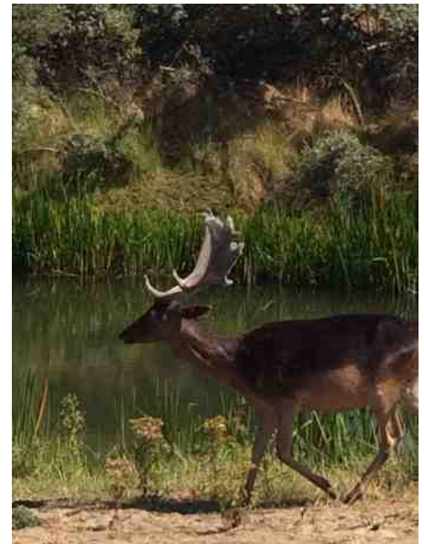
Hert in de duinen.