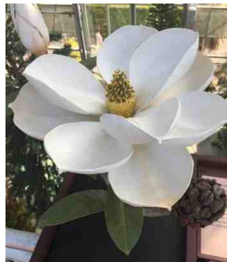
Oeroud en oersterk!