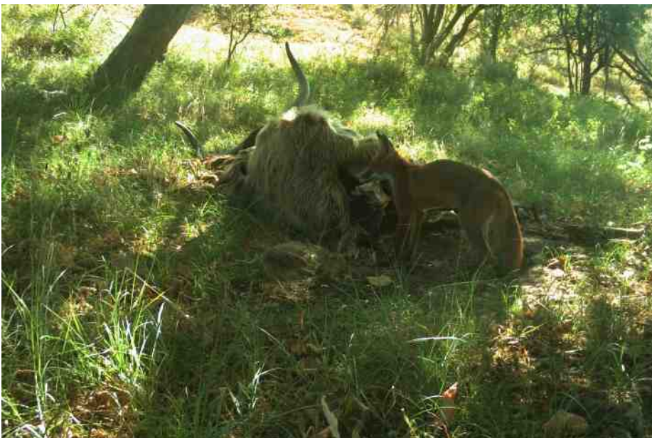
Vos eet van kadaver Hooglander.

Schimmels en bacteriën zetten de laatste restjes kadaver om in de mineralen waaruit ze zijn opgebouwd. Die mineralen komen uiteindelijk weer beschikbaar voor de levensgemeenschap.