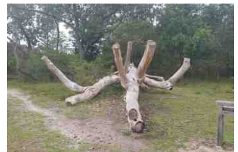
Een kunstige dwarsboom

Maar terug naar de dwarsbomen: afgelopen zomer liep ik rond het Bezoekerscentrum in de duinen langs een kunstige variant. Het gladde hout en de afgezaagde stompjes wezen alle kanten op. Ondanks het ontbreken van bladeren en groei straalde de boom kracht uit. En in de weekenden wemelt het hier van de kinderen. Ook op die manier brengen gevallen bomen leven in de brouwerij.