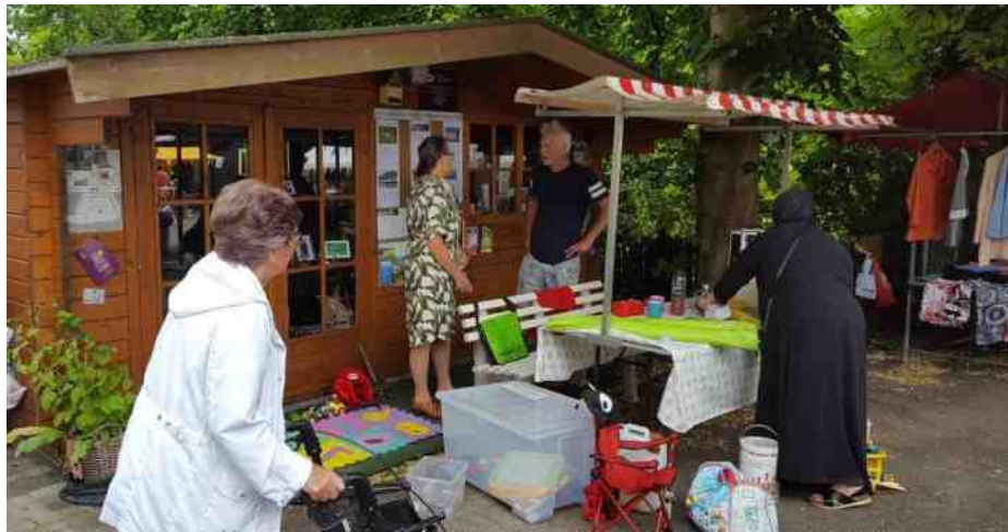
Open dag Natuurcentrum Schalkwijk.

29 november Niet-Winkeldag 5 december Wereld Bodem Dag 7 december Nationale Vrijwilligersdag