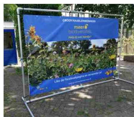
Meer biodiversiteit: Help jij een handje?