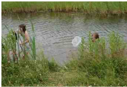
Lekker met de voeten in het water.

De flauwe oevers en steigers vormen een perfecte plek voor kinderen en