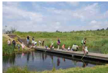
Flauwe oevers en steiger.

volwassenen om waterbeestjes te vangen en waterplanten te bekijken. Zo'n 275 deelnemers zijn langs gekomen op deze zonnige dag. Kinderen, maar ook de volwassenen, drukten hun neus tegen het glas van de waterbakken om niets te missen van krioelende waterbeestjes.