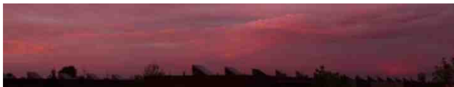
Saharazand in de lucht.

De winnaar mag een onderwerp kiezen en eventueel schrijven voor een pagina in de volgende Toorts nummer 109.