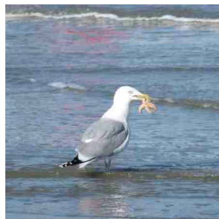
Eten en gegeten worden.

nis. Samen zagen ze al eens een reiger die acht dikke vette kikkers opat. "Hoeveel kikkers passen er eigenlijk in een reiger?"