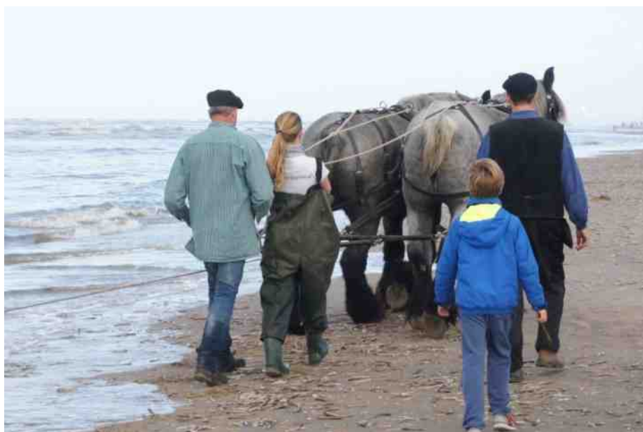
Korvissen met paardenkracht.