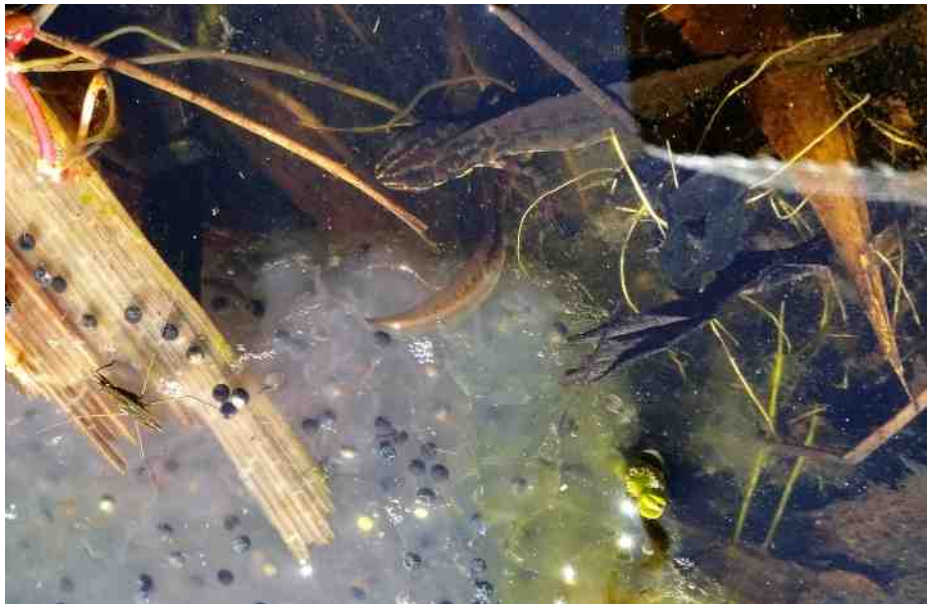
Watersalamander en zijn prooi.

in het voorjaar komen eerst de hommalkoninginnen na hun solitaire overwintering tevoorschijn. Hommels bouwen hun nest meestal in een muur of in de grond. Als nestmateriaal knagen ze stukjes van oude planten. Een bijenvolk overwintert met z'n allen, en is