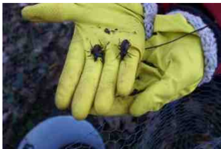
Paarse schallebijters als bijvangst. Foto boven en midden.