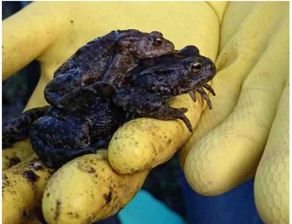
Bruine kikkers in amplexus.