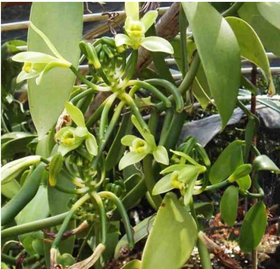
Vanilleplant met bloemen en peulen.