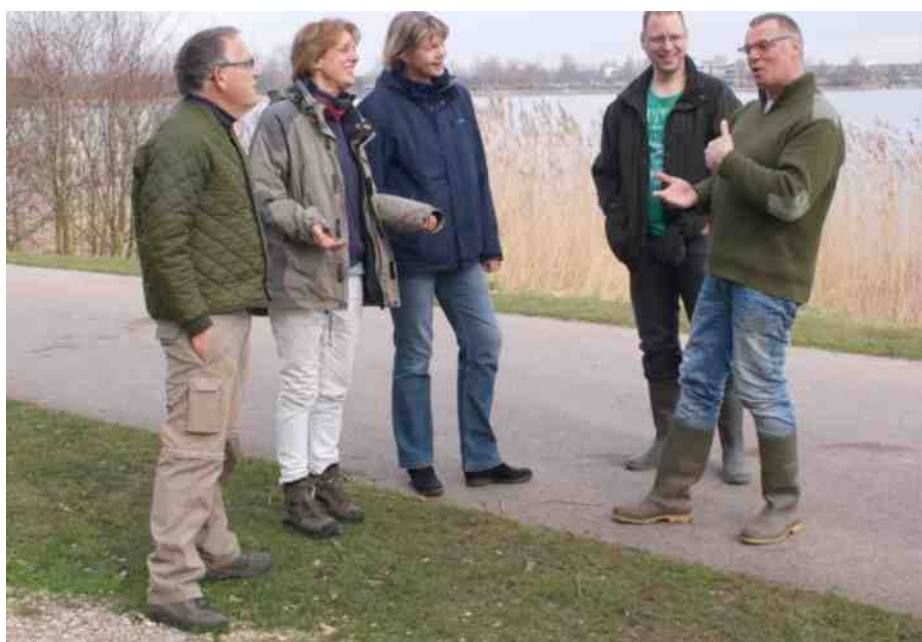
Werkbespreking van het NLdoet team.

Foto's: Heidi van der Marel m.u.v. groepsfoto door NLdoet-medewerker