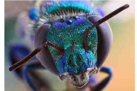
De orchideebij valt op door fluorescerende kleur.

Het lijkt erop dat de bijen eerder waren in de evolutie; terwijl de bij voorkeuren ontwikkelde voor bepaalde stoffen, volgde de orchidee door deze stoffen te ontwikkelen en zo de bestuivende bij te lokken.