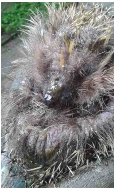
Egeltjes vertederen altijd weer.

In het eerste huis blijkt een mannetjesegel te zitten, die zich snel tot een balletje rolt. Na een tijdje kijkt hij toch wat schuchter om zich heen. Hij ziet er gezond uit. In oktober woog hij nog 660