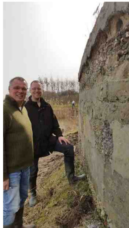
Inspectie van de broedwand.