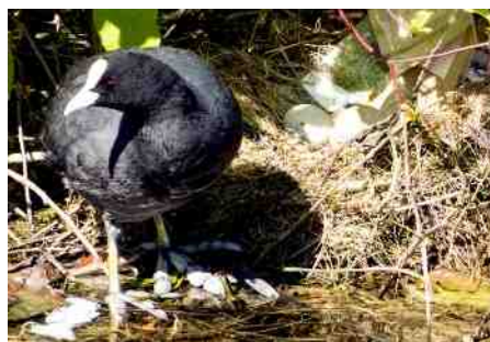
Meerkoet met legsel.

van watervogels die ik zie zijn die van meerkoeten, op een klein stuk lopen zijn het er wel drie. Alle drie tegen de oeverwand aan, op basis van takken en wortels van waterplanten. Maar ik zie er geregeld ook veel plastic tussen zitten. Zo ook bij het volgende nest waar ik langs loop.