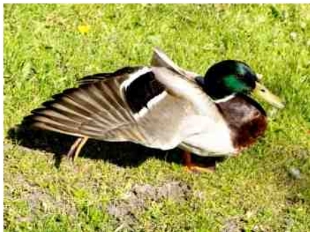
Eendenmannetje in rust.

Vlak langs het voet- en fietspad liggen de wilde eendenmannetjes in het gras. Eén oog dicht, het andere waakzaam open. Je merkt dat ze gewend zijn aan mensen want als je niet dichtter bij ze komt, blijven ze rustig liggen. De zon schijnt op hun prachtig gekleurde groen, blauw, paarse kop. Zodra ik wat langer stilsta komen ze overeind en naar me toe, maar als er geen eten komt zijn ze ook zo weer weg. Mopperehend.