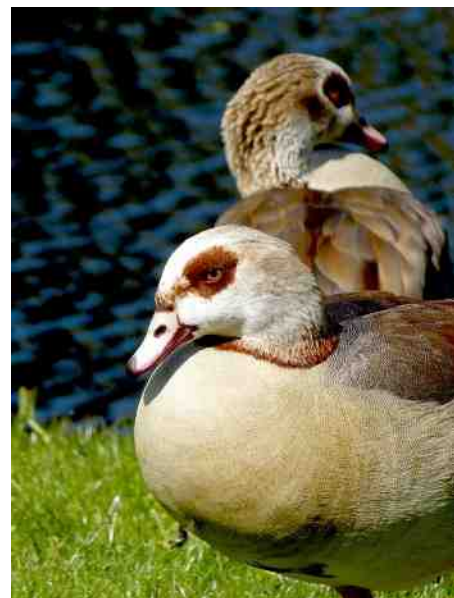
Wat een mooi paar!

Voor het thema van de Toorts zie ik niet veel, dus kijk ik verder naar de plataan die begint te bloeien met prachtige donkerrode bolletjes. Er zit een soort wit in, mogelijk iets van een insect? En dan op de valreep kom ik twee nijlganzen tegen die me argwanend aankijken. Ik kijk terug en zie dan in het gras twee kleine pulletjes die bijna niet boven de grassprietten uitkomen. Ik maak foto's, maar ze zijn niet goed te zien. De ouders wel, dus dan van hen maar een foto. Want ze zijn zeer fotogeniek.