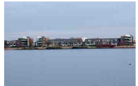
De zandhopen aan overkant van de plas.

Ondanks dat de broedpijpen van de wand niet schoongemaakt hoeven te worden, valt er genoeg te doen bij het eilandje, zoals het verwijderen van riet rondom en het snoeien van een flinke