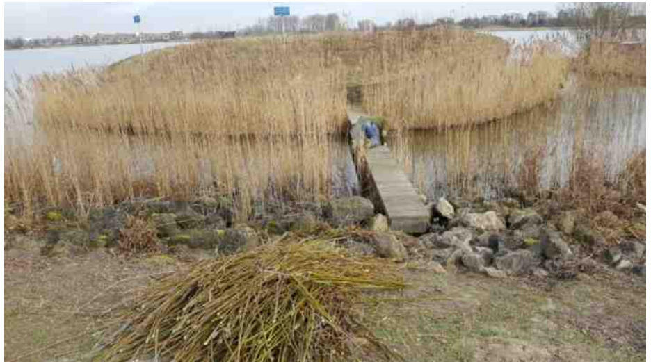
De oeverzwaluwwand ligt veilig op een eilandje in de Toolenburgerplas.