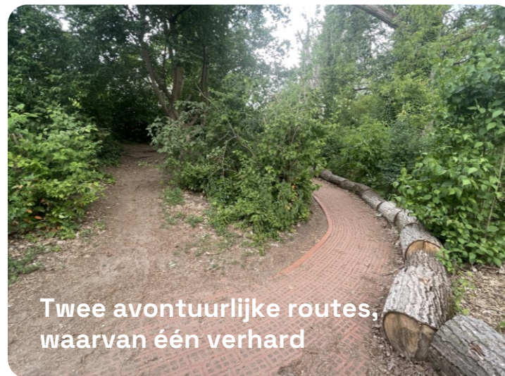
Twee avontuurlijke routes, waarvan één verhard