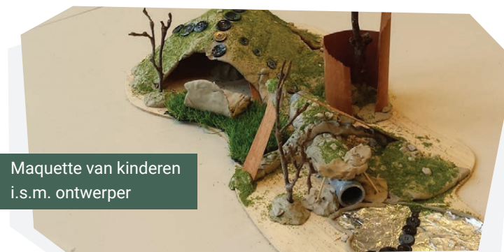
Maquette van kinderen i.s.m. ontwerper

Naast deze input heeft de ontwerper waarschijnlijk ook een plattegrond van het plein nodig. Deze kun je vaak opvragen bij de gemeente (Grootschalige Basiskaart van Nederland: GBKN). Op de digitale kaart staan o.a. gebouwen, wegen en waterlopen in het terrein weergegeven.