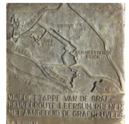
Informatie bij de grafheuvel

Na een poosje zie je bij een T-splitsing links drie grafheuvels liggen. Zie beschrijving op het paaltje aan je linkerhand. Op de hele Utrechtse Heuvelrug zijn honderden grafheuvels bekend, maar het merendeel is helaas in vroegere tijden leeggeroofd of beschadigd.