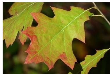
Blad Amerikaanse eik