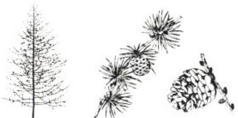
Wintersilhouet, takje en kegel van de lariks