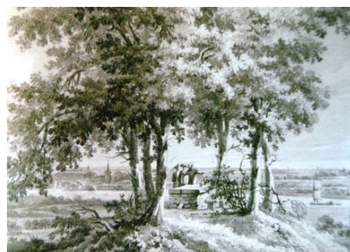
Collectie C.P. v. Eeghen, 1789

Tijdens de wandeling krijg je te maken met hoogteverschillen van meer dan 30 m en een afdaling door een voormalig smeltwaterdal.