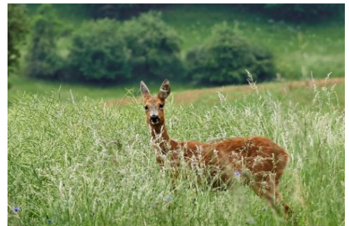
Een waakzame reehinde

Ze vinden hier voldoende voedsel en kunnen zich goed verschuilen. Soms zie je aan de sporen waar ze hebben gelopen. Vooral in de sneeuw kun je zo goed traceren. Maar nog leuker is het natuurlijk als je ze echt ziet. De kans hierop is het grootst in de vroege ochtend en avonden als het schemert. Het is belangrijk om honden aan de lijn te houden. Vooral in de zomer, als er reekalfjes zijn.