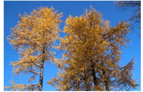
Lariksen in de herfst

Voordat de naalden vallen, kleuren ze prachtig geel. De afgevallen lariksnaalden vormen een zacht tapijt op het bospad.